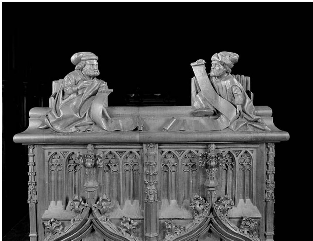
Statuettes de la première jouée basse : personnages assis, lisant.