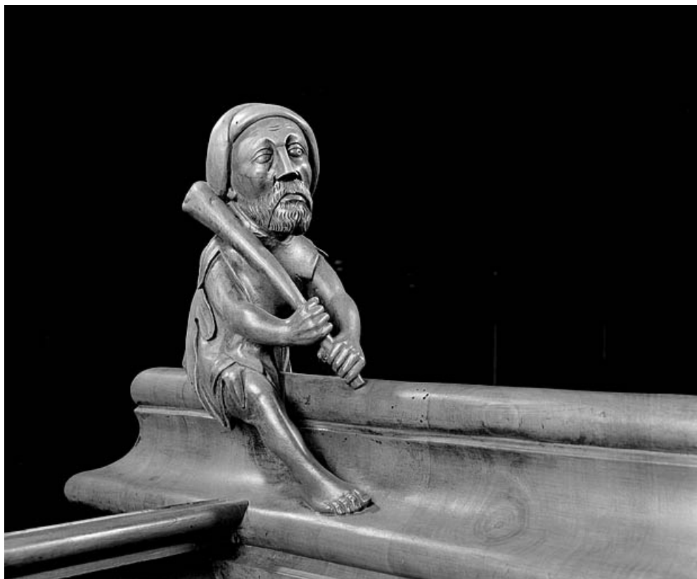
Statuette de la deuxième jouée basse : homme luttant avec une massue.