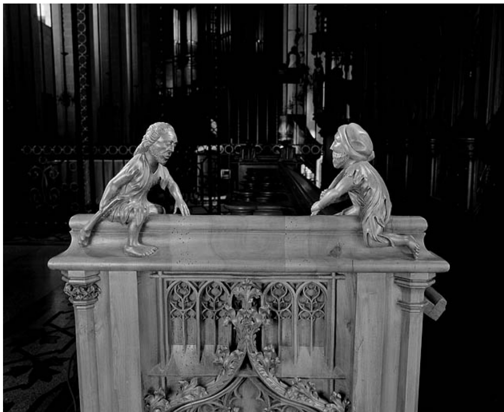
Statuettes de la deuxième jouée basse : hommes luttant avec une massue. 39, Saint-Claude place de l' Abbaye