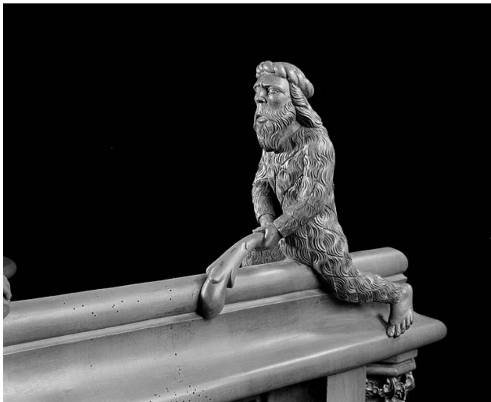
Statuette de la troisième jouée basse : homme sauvage luttant avec une massue. 39, Saint-Claude place de l' Abbaye