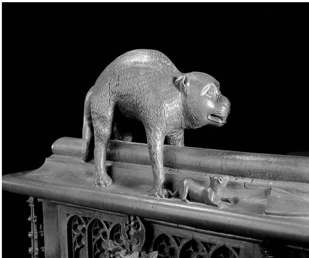
Statuette de la quatrième jouée basse : chat.