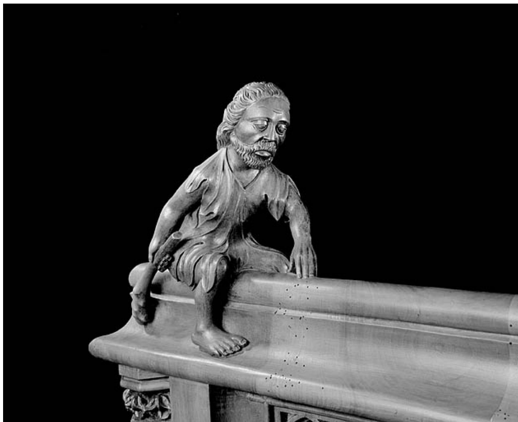
Statuette de la deuxième jouée basse : homme luttant avec une massue.