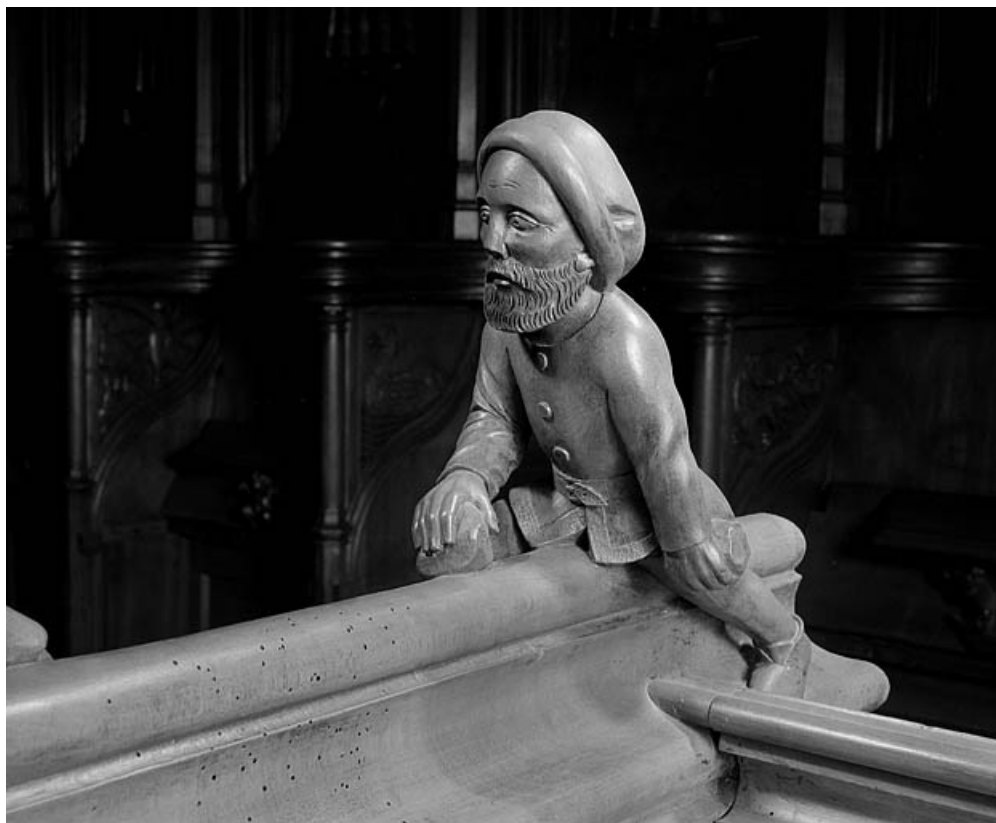
Statuette de la troisième jouée basse : homme luttant avec une massue.