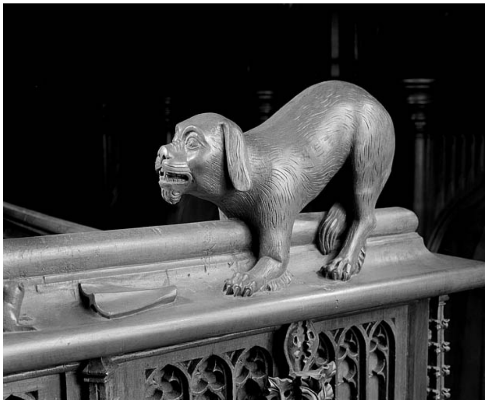
Statuette de la quatrième jouée basse : chien.