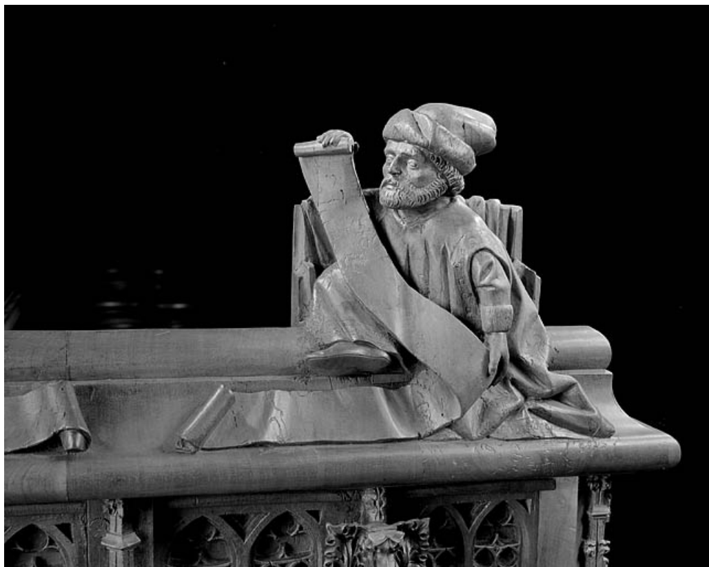
Statuette de la première jouée basse : personnage assis, lisant sur un phylactère.