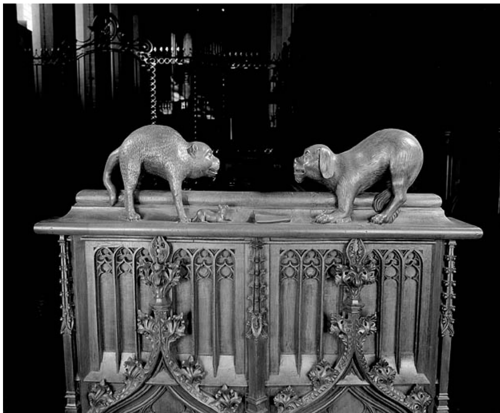
Statuettes de la quatrième jouée basse : chien et chat affrontés.