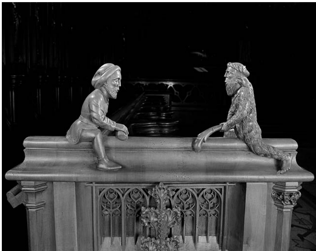
Statuettes de la troisième jouée basse : homme et homme sauvage luttant avec une massue. 39, Saint-Claude place de l' Abbaye