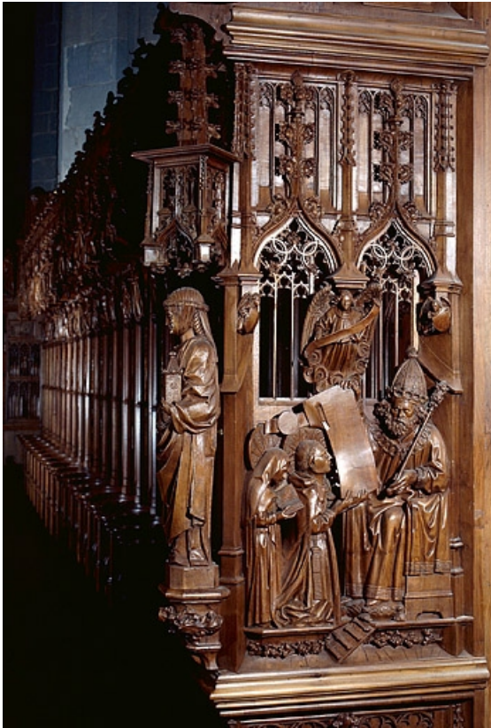
Jouée haute est : saint Romain et saint Lupicin recevant une charte de donation des mains du roi Chilpéric.