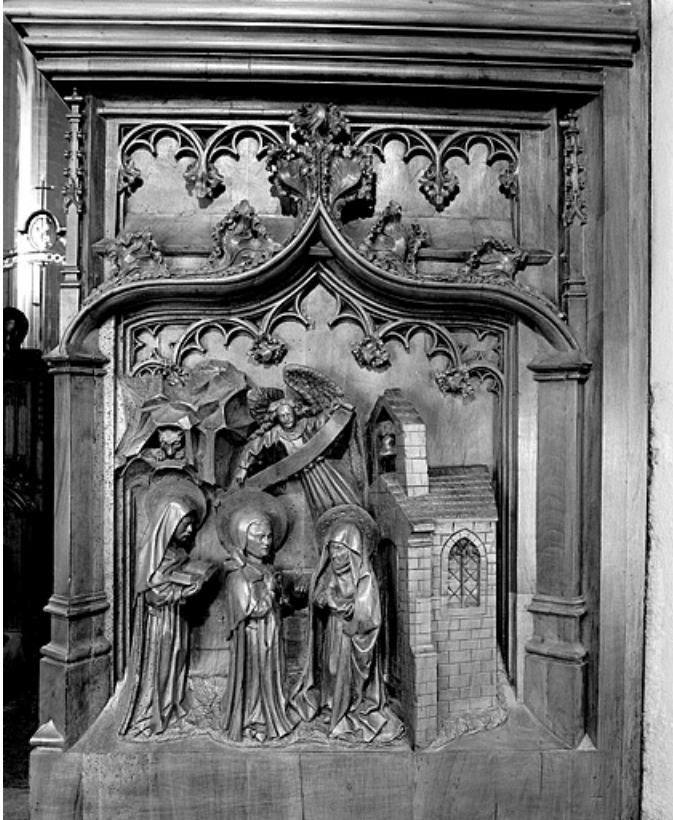
Jouée haute est : saint Romain et saint Lupicin rendant visite à sainte Yole.