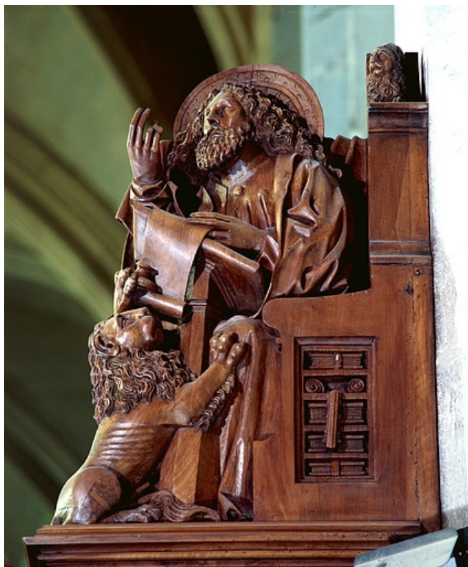
Jouée haute est : saint Marc.