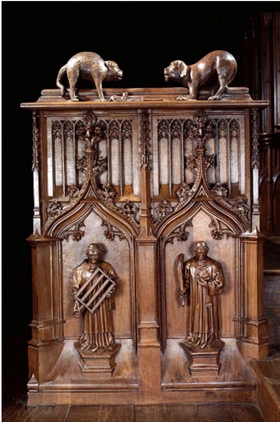
Quatrième jouée basse : saint Laurent et saint Etienne.