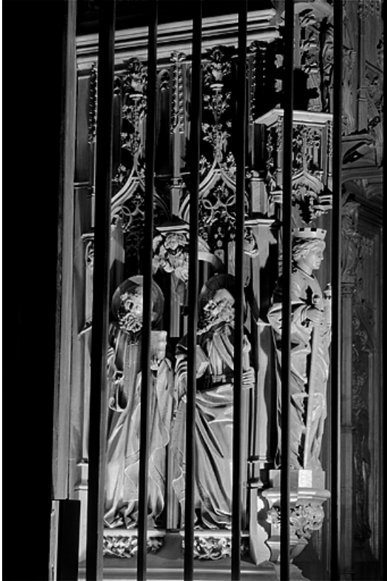
Première jouée haute : saint Pierre et saint Paul.