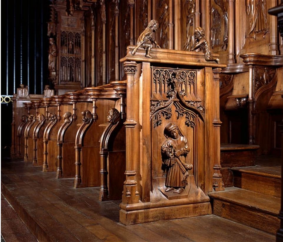
Deuxième jouée basse : moine portant les clefs.