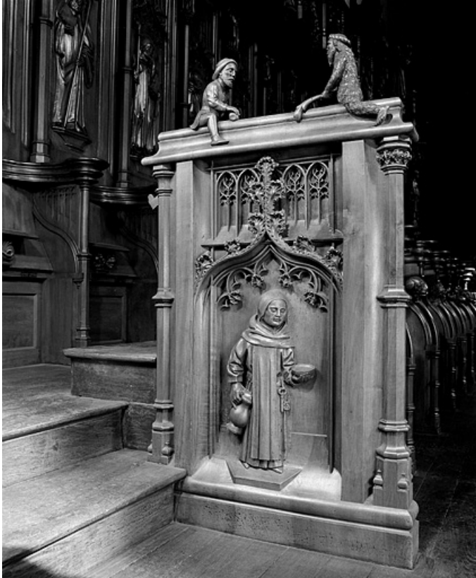
Troisième jouée basse : moine réfecturier.