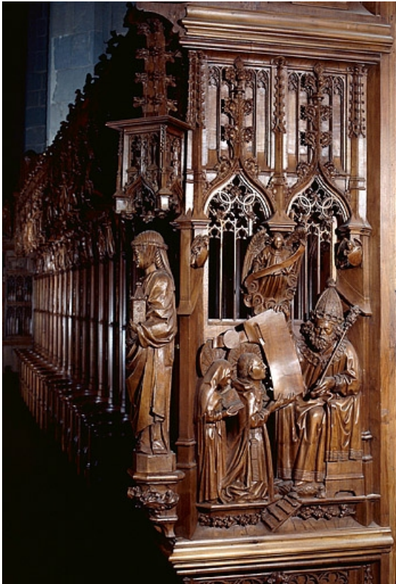
Jouée haute est : saint Romain et saint Lupicin recevant une charte de donation des mains du roi Chilpéric.