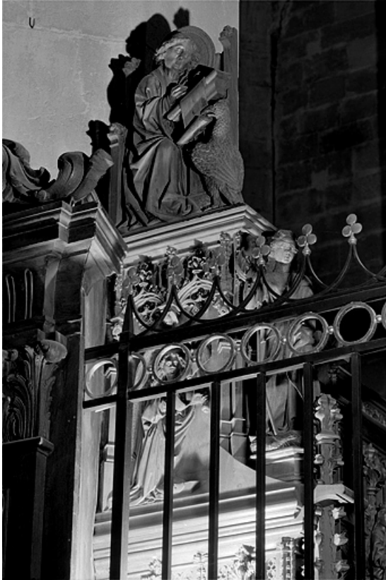
Première jouée haute : saint Jean et ange de l'Annonciation.