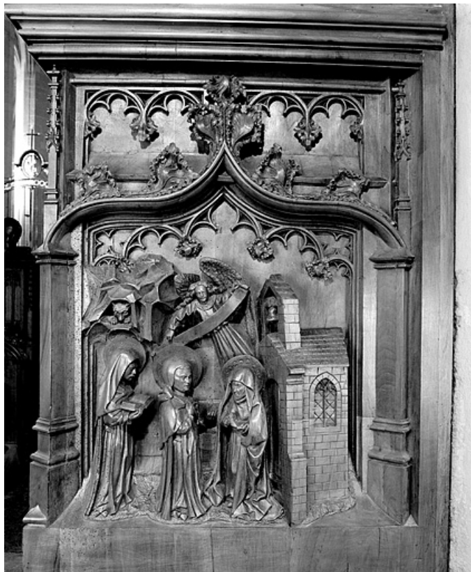
Jouée haute est : saint Romain et saint Lupicin rendant visite à sainte Yole.