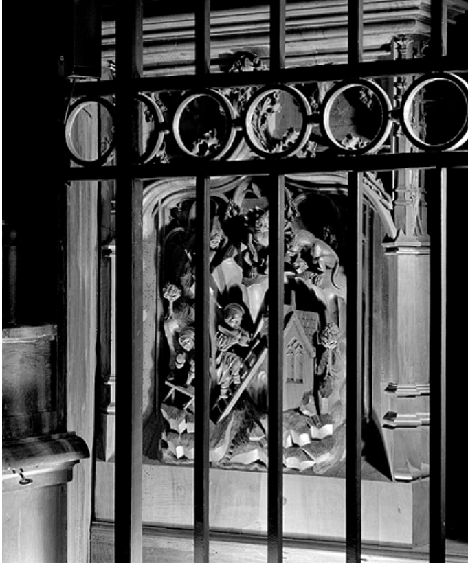
Première jouée haute : saint Romain et saint Lupicin construisant leur église.