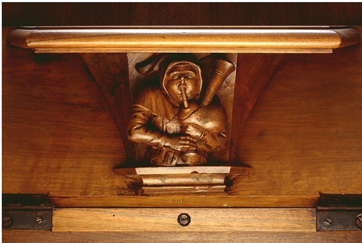
Miséricorde de la treizième stalle basse.