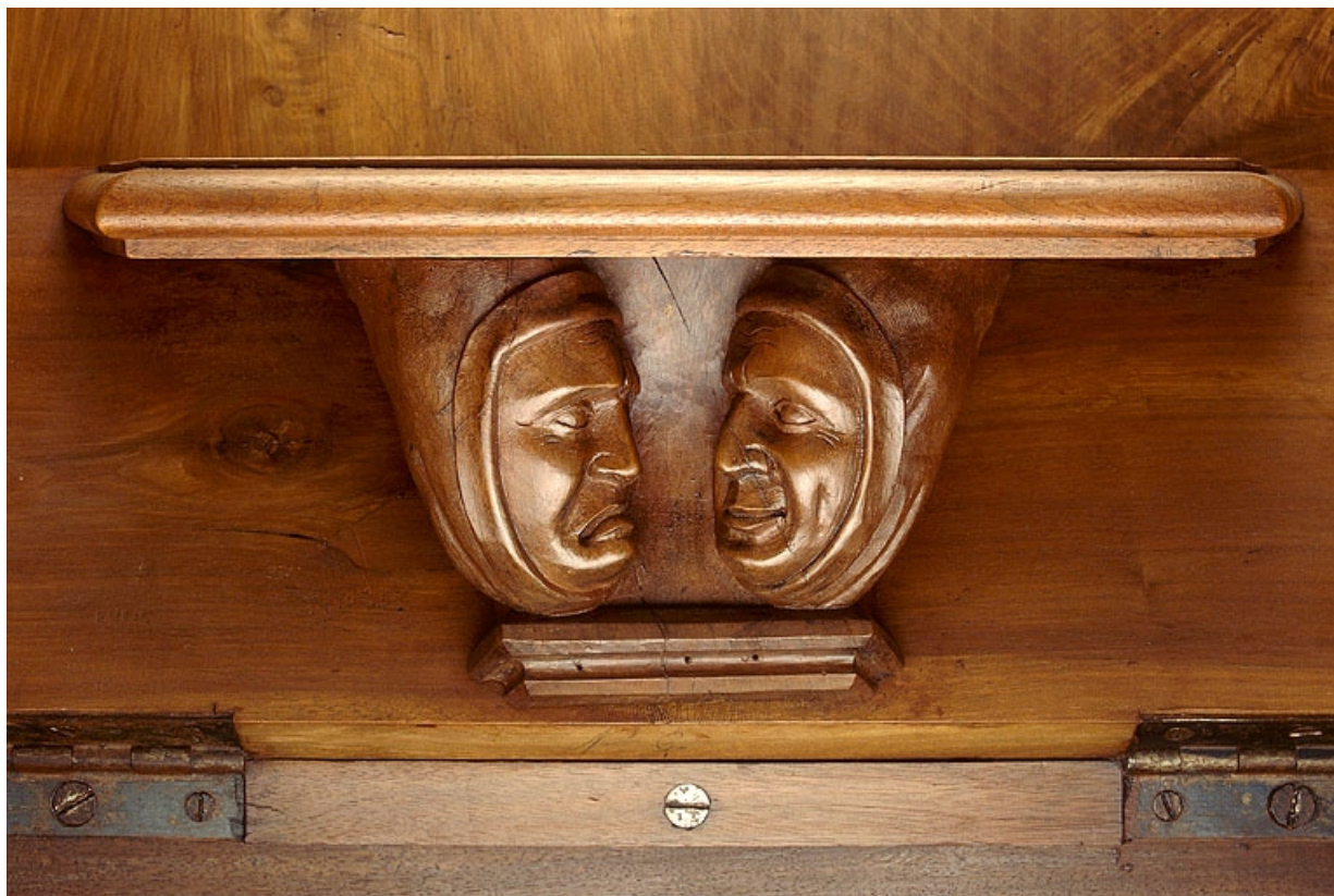
Miséricorde de la neuvième stalle haute.