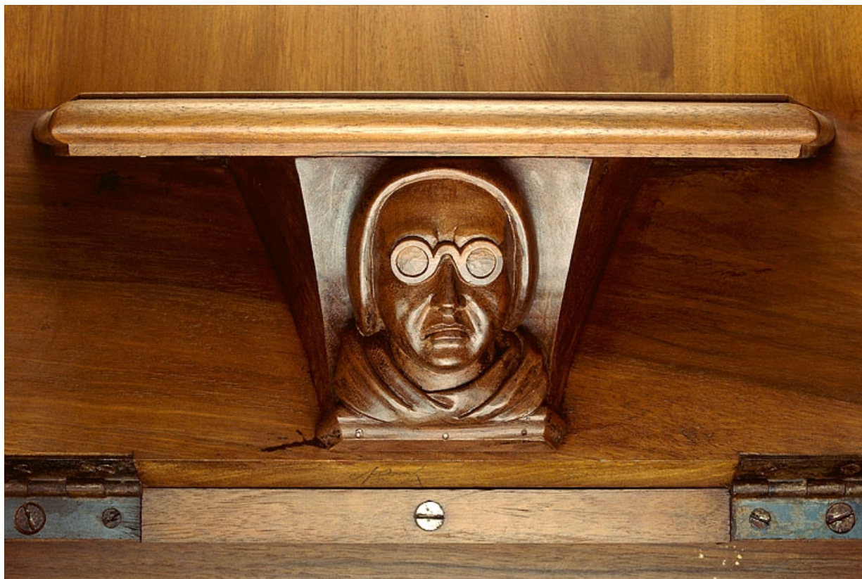
Miséricorde de la septième stalle haute.