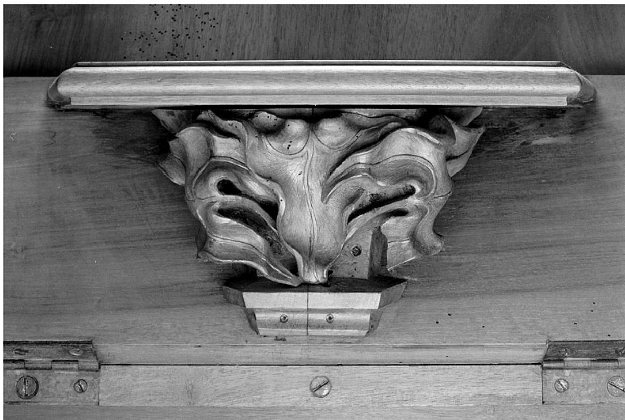
Miséricorde de la quatrième stalle basse.