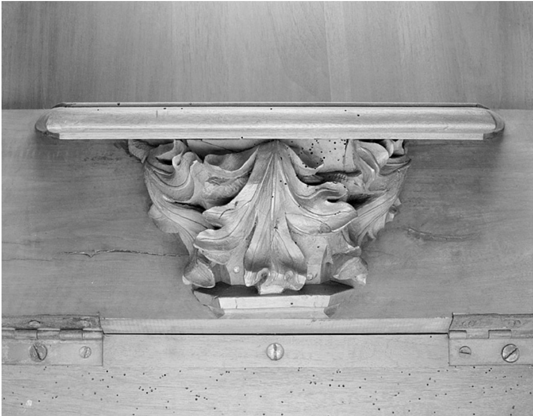
Miséricorde de la dix-huitième stalle haute.