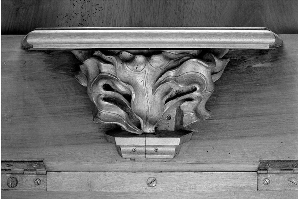
Miséricorde de la quatrième stalle basse.