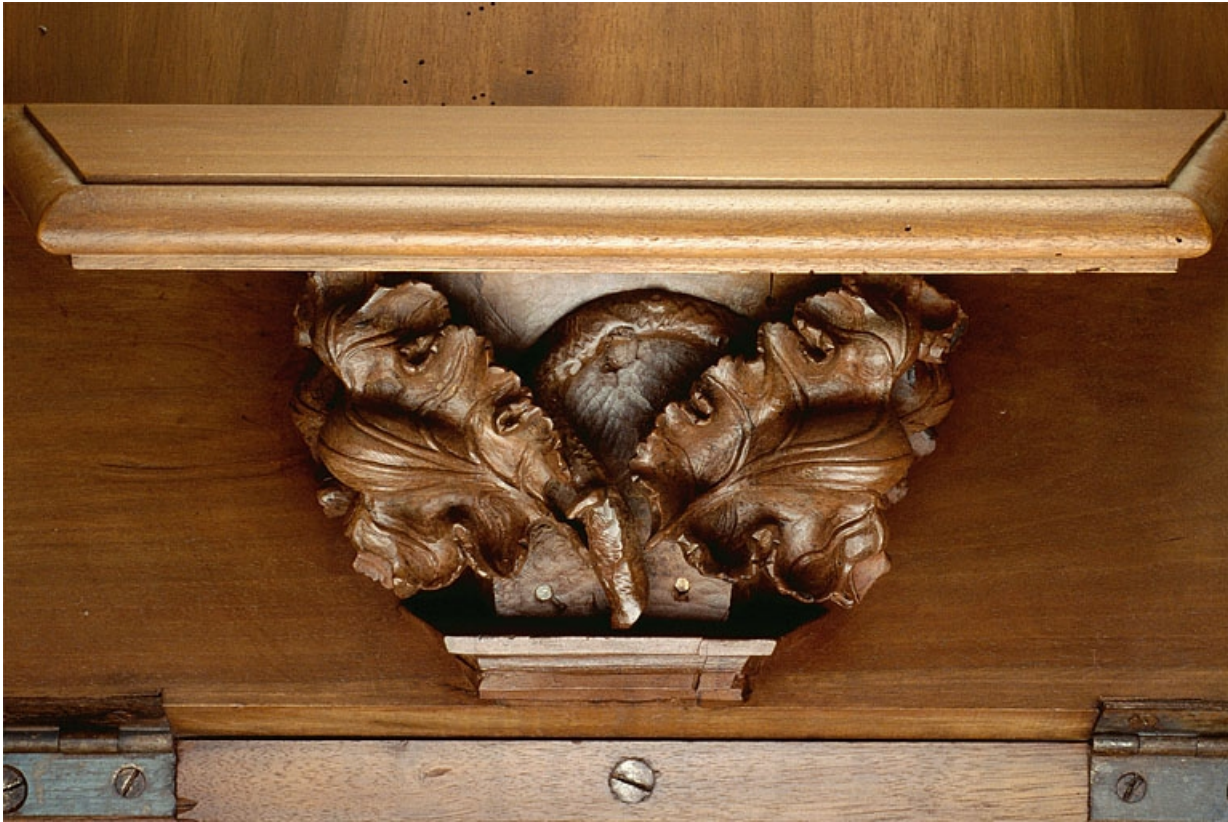
Miséricorde de la quatorzième stalle haute.