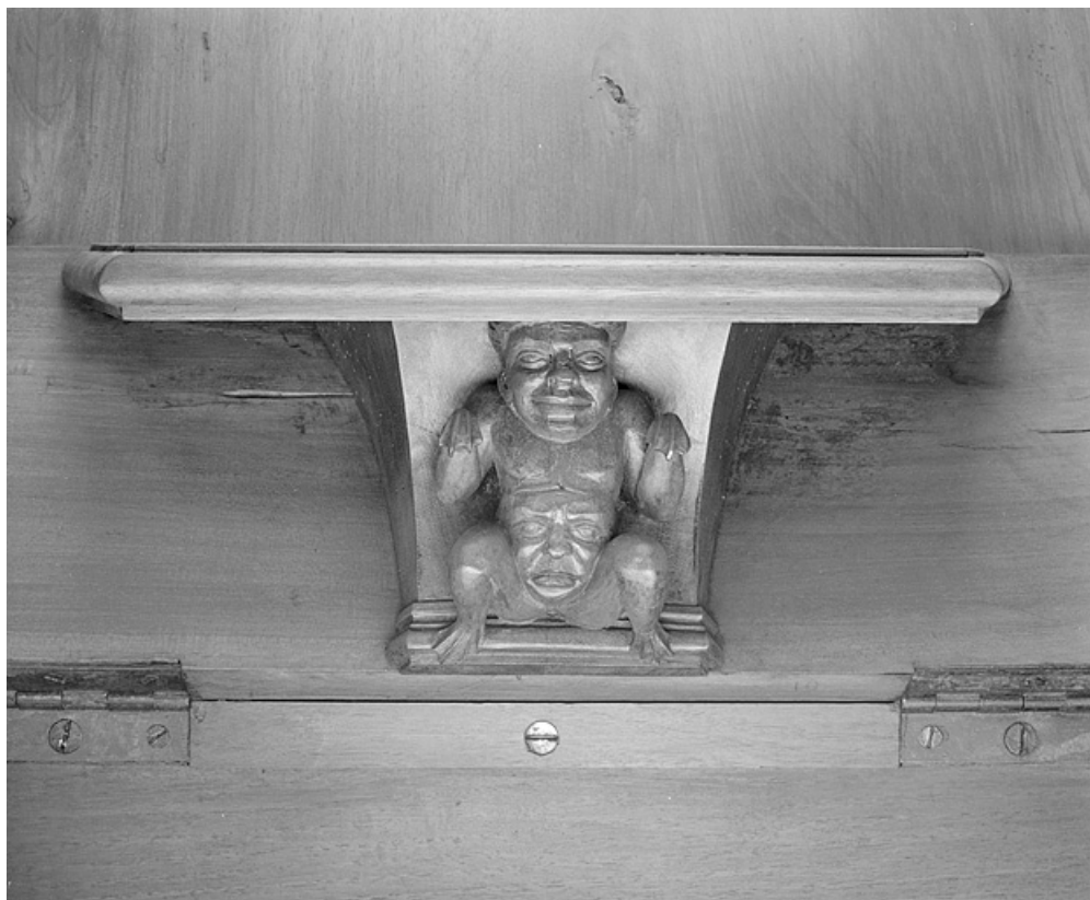
Miséricorde de la dixième stalle haute.