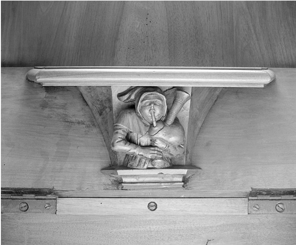
Miséricorde de la treizième stalle basse.