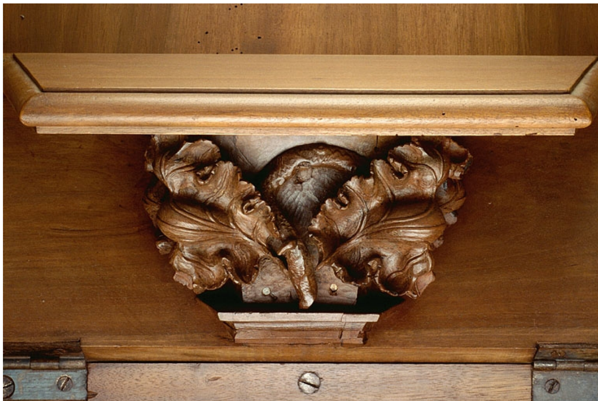
Miséricorde de la quatorzième stalle haute.