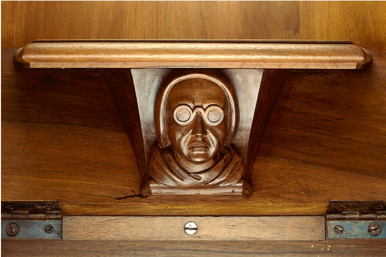
Miséricorde de la septième stalle haute.