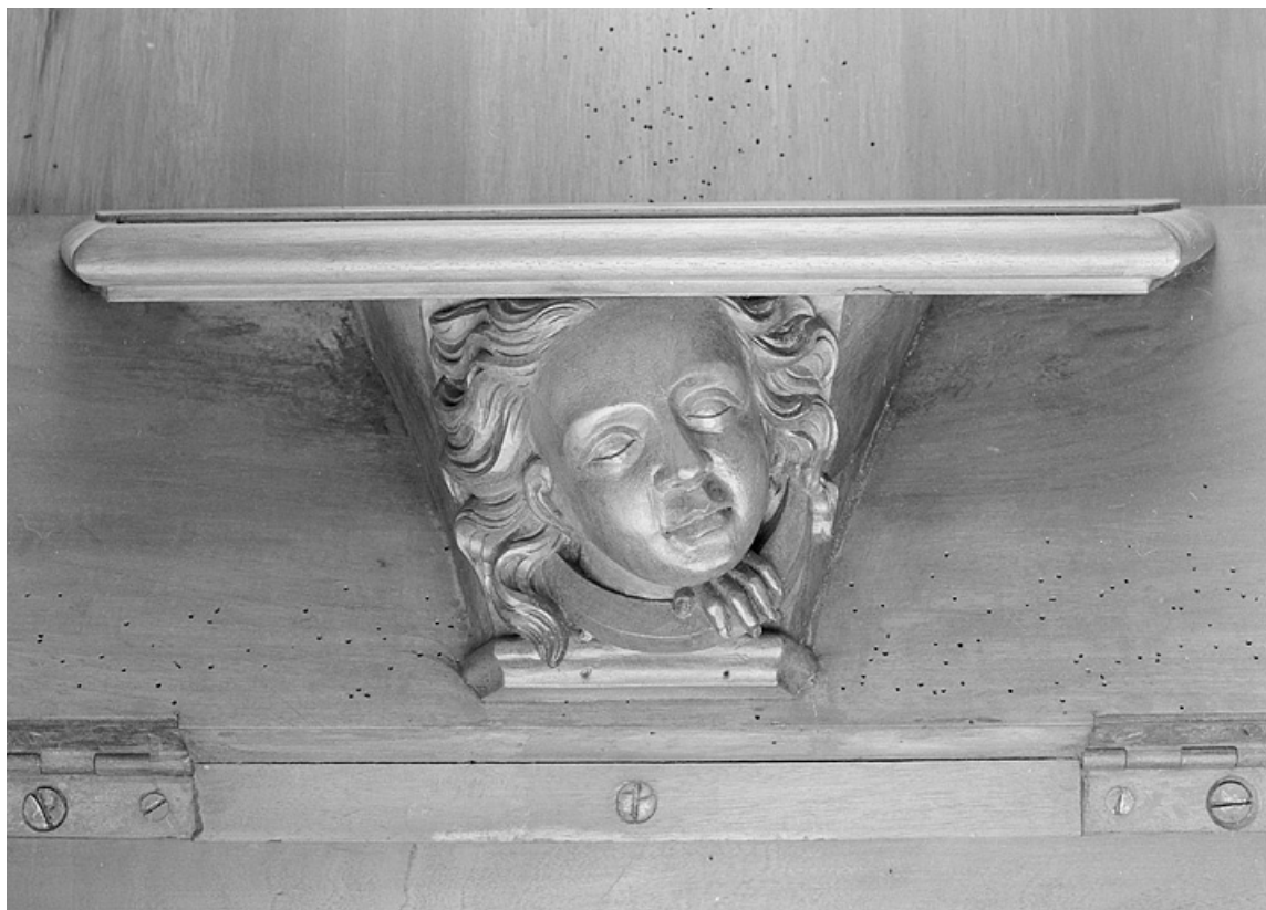
Miséricorde de la dix-neuvième stalle haute.