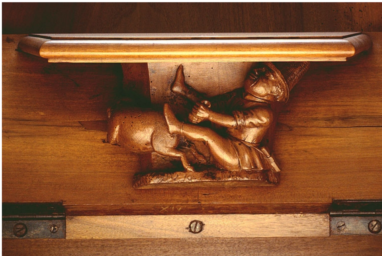
Miséricorde de la quatorzième stalle basse.