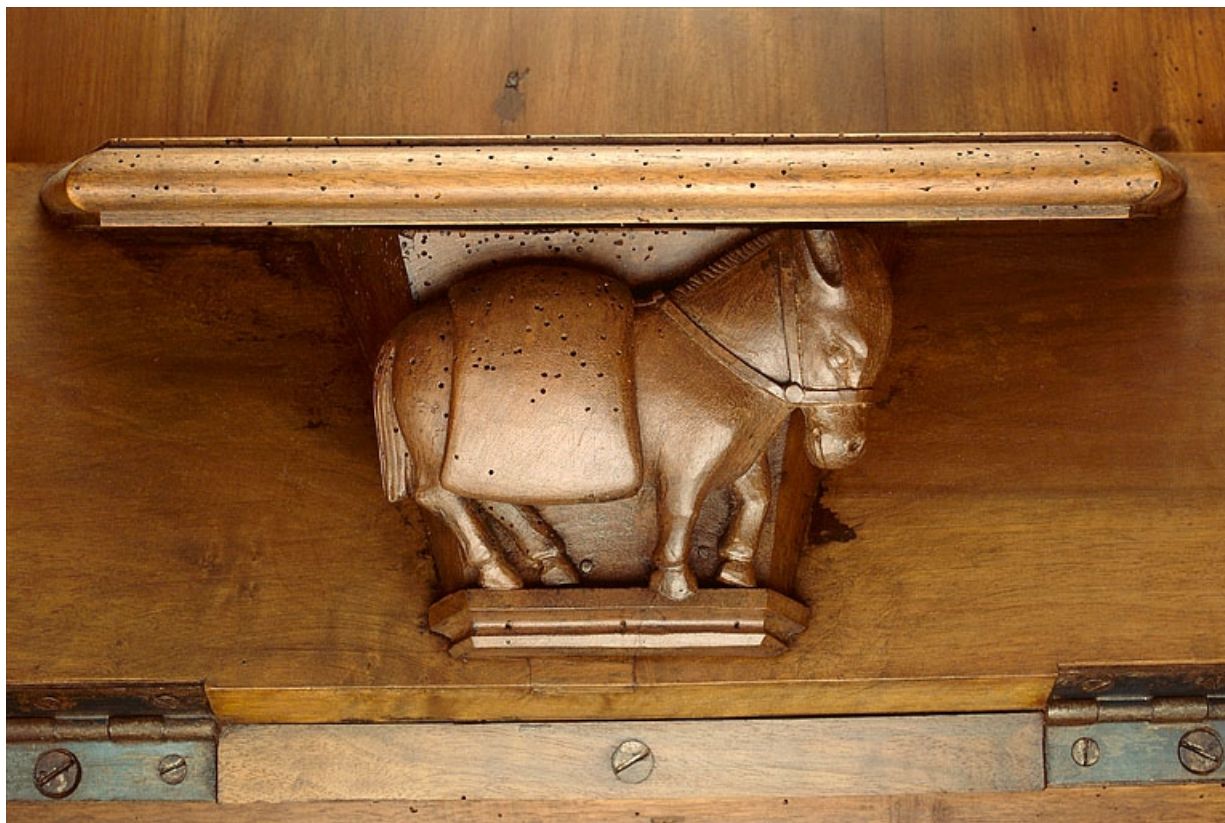
Miséricorde de la quinzième stalle haute.