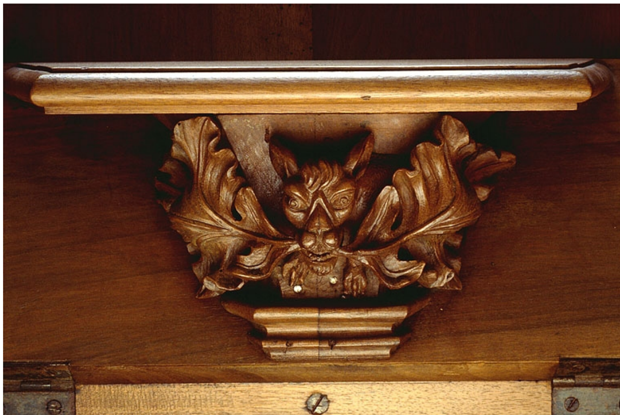
Miséricorde de la troisième stalle basse.