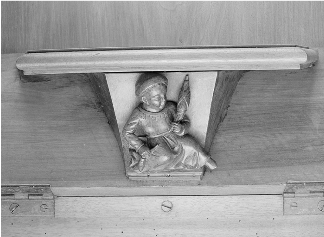
Miséricorde de la deuxième stalle haute.