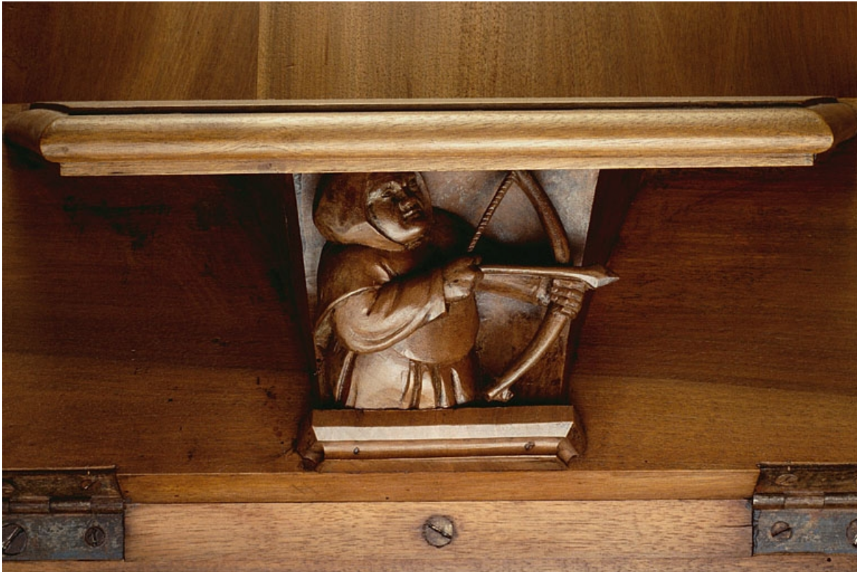
Miséricorde de la troisième stalle haute.