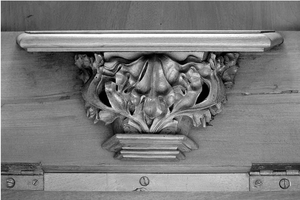
Miséricorde de la huitième stalle basse.