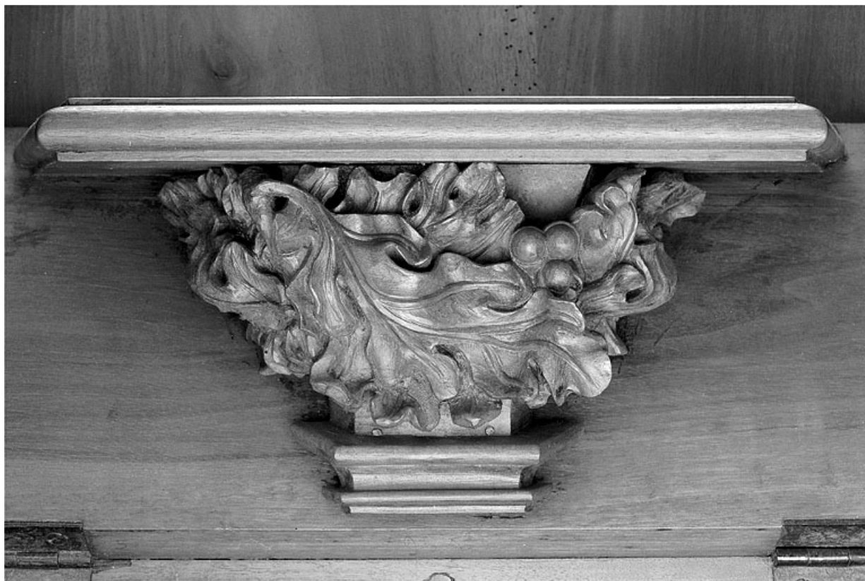
Miséricorde de la première stalle basse.