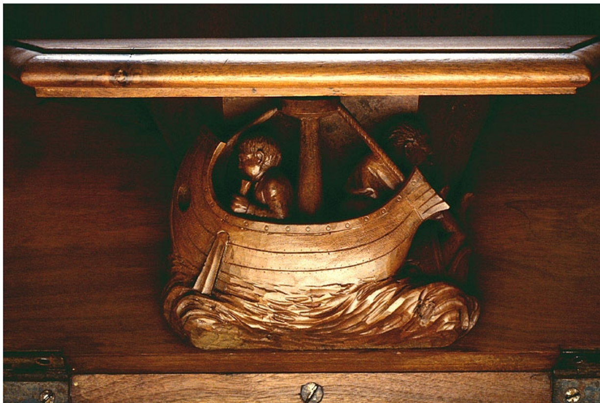
Miséricorde de la septième stalle basse.