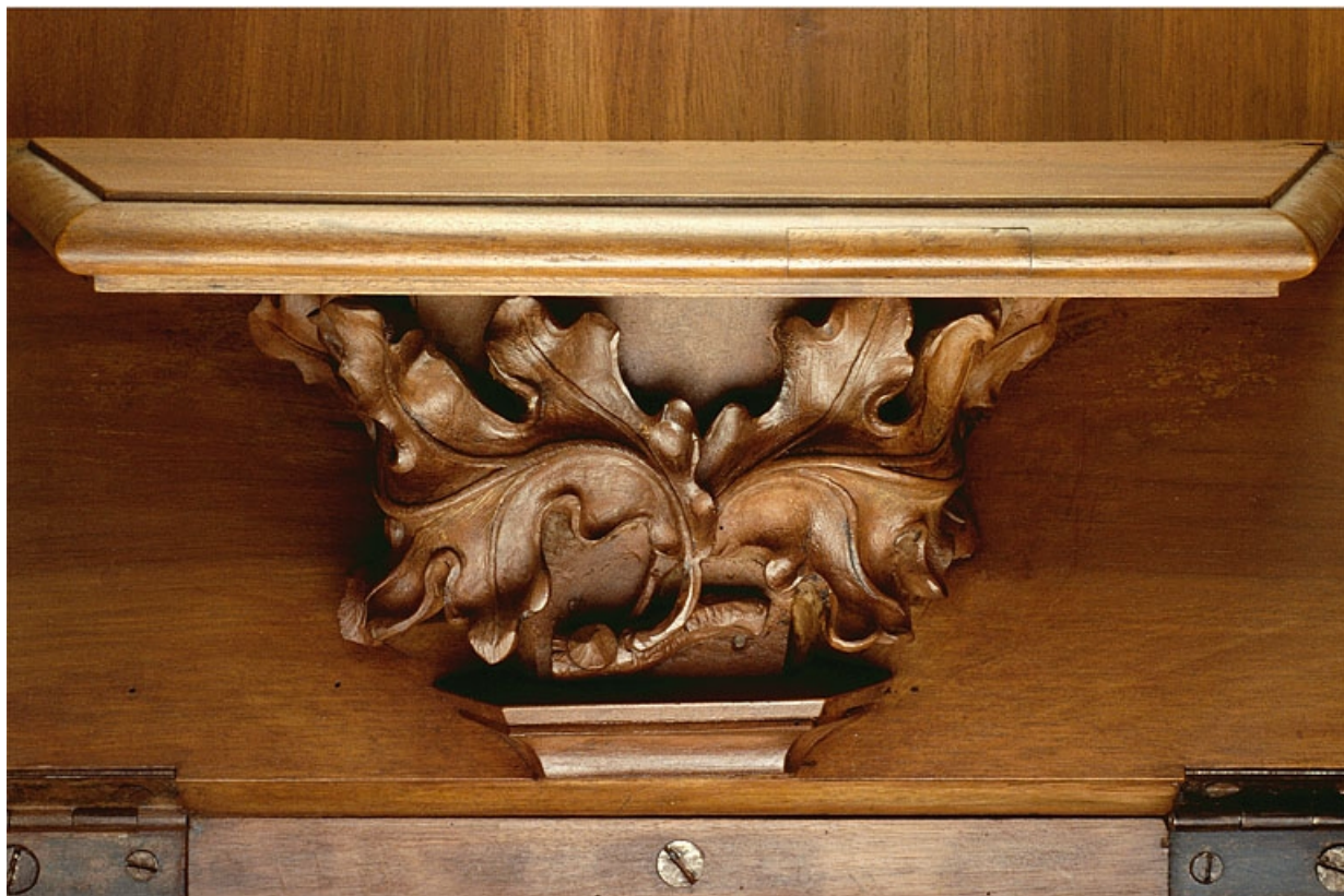
Miséricorde de la seizième stalle haute.