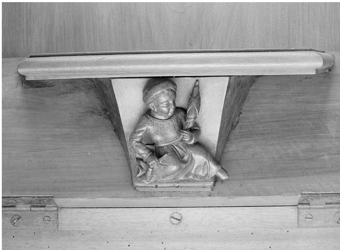
Miséricorde de la deuxième stalle haute.