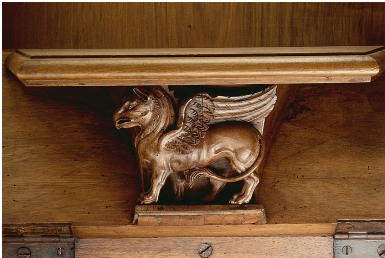
Miséricorde de la première stalle haute.