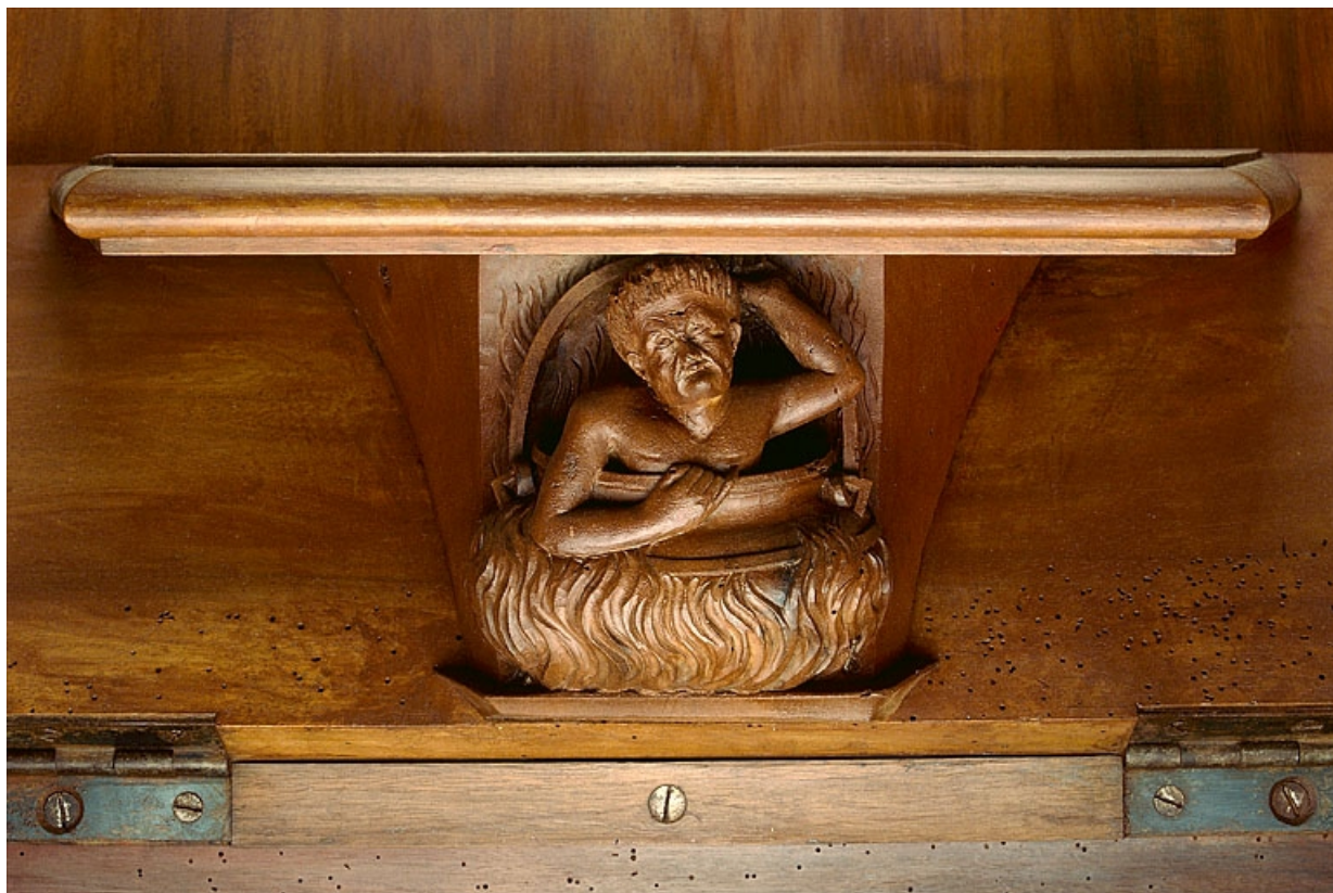
Miséricorde de la vingt et unième stalle haute.