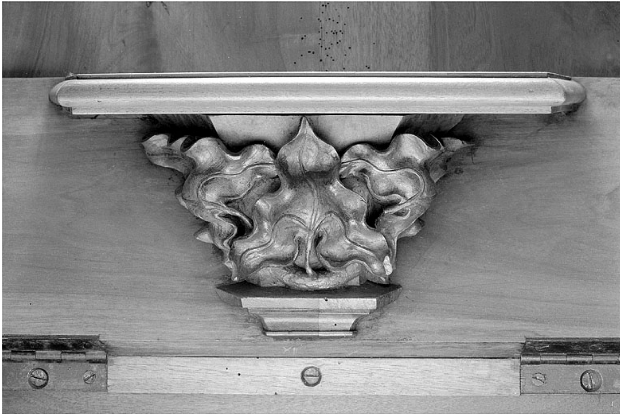
Miséricorde de la douzième stalle basse.