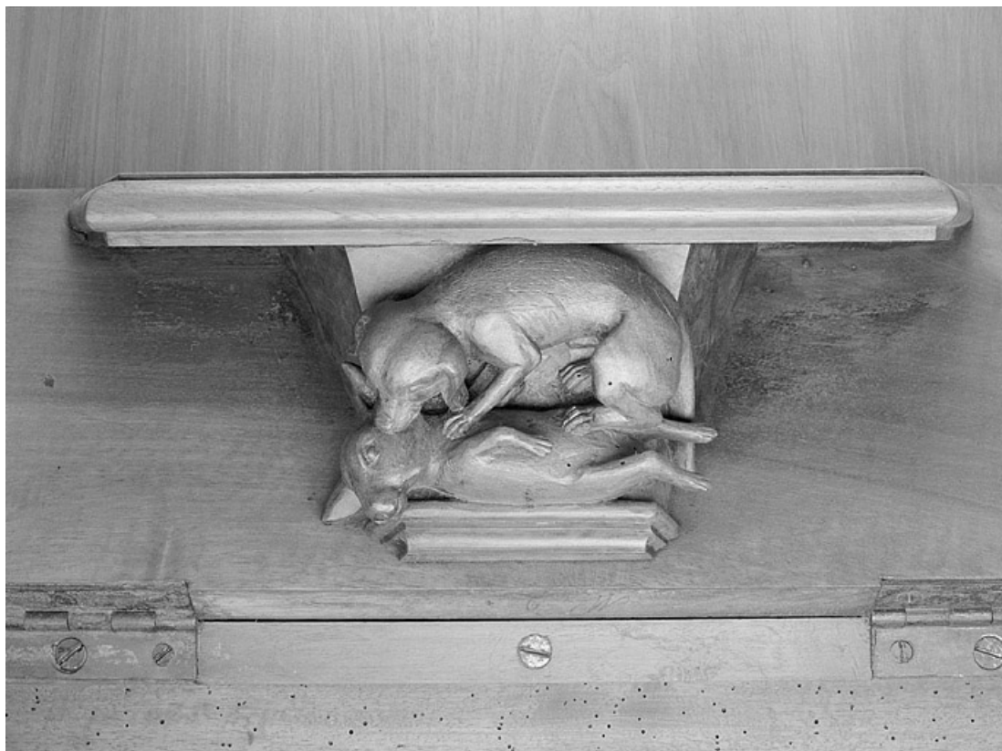
Miséricorde de la cinquième stalle haute.