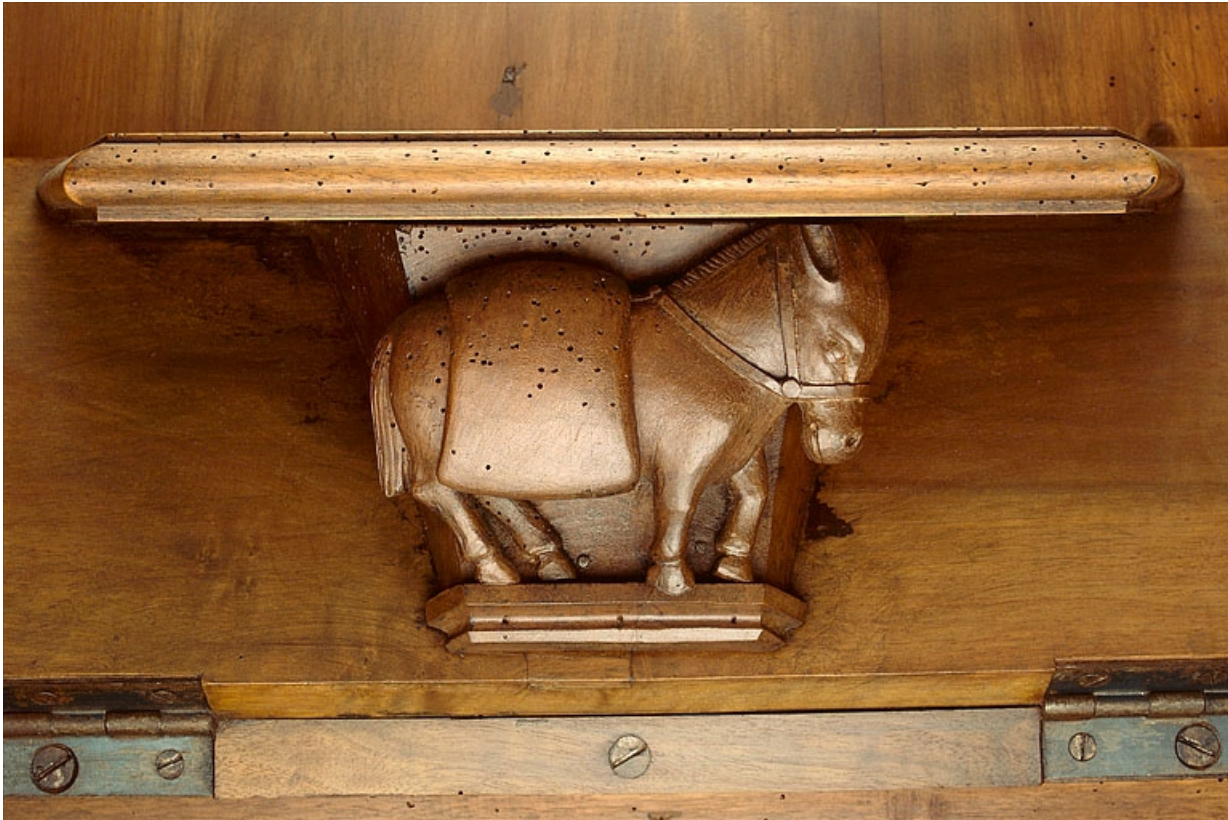
Miséricorde de la quinzième stalle haute.