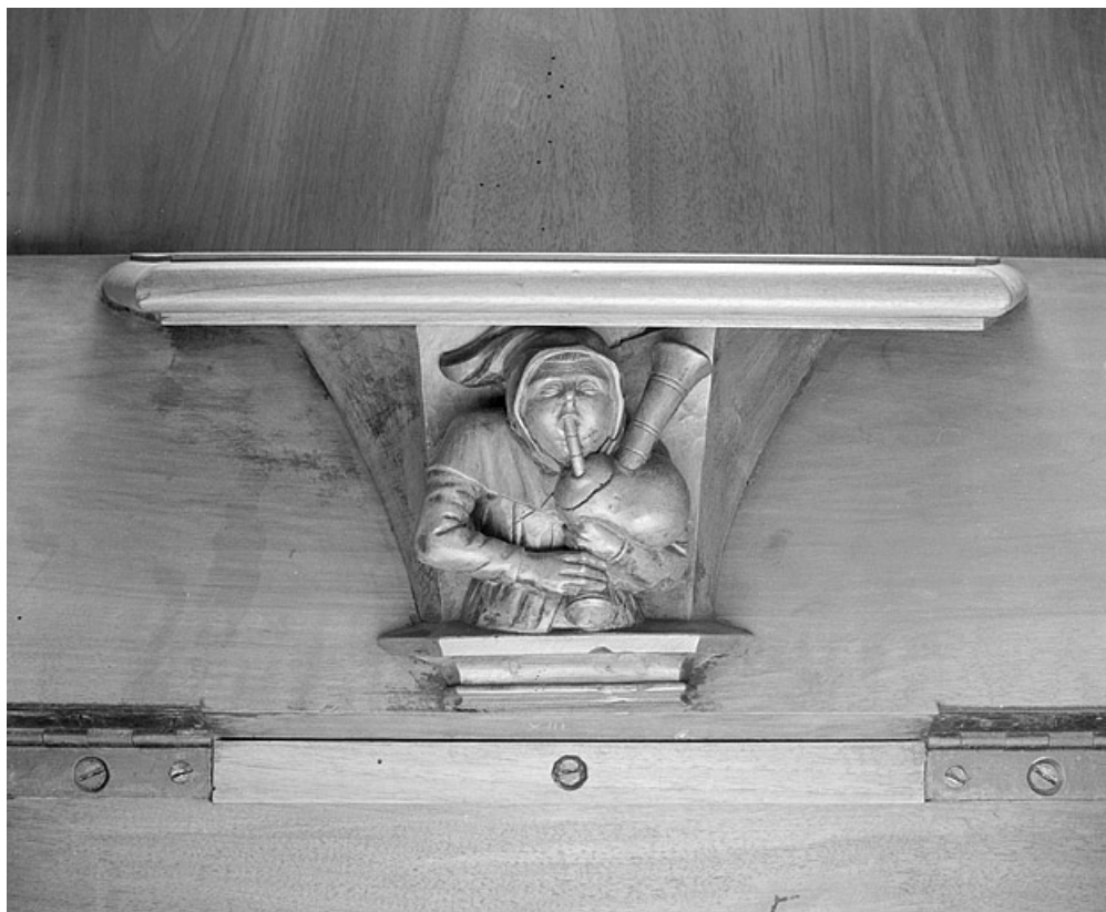
Miséricorde de la treizième stalle basse.