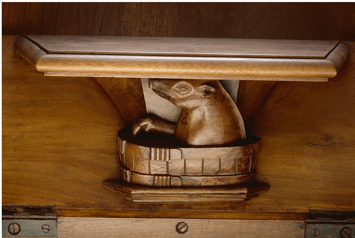
Miséricorde de la quinzième stalle basse.