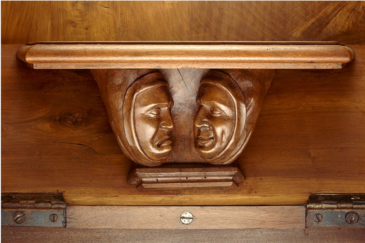
Miséricorde de la neuvième stalle haute.