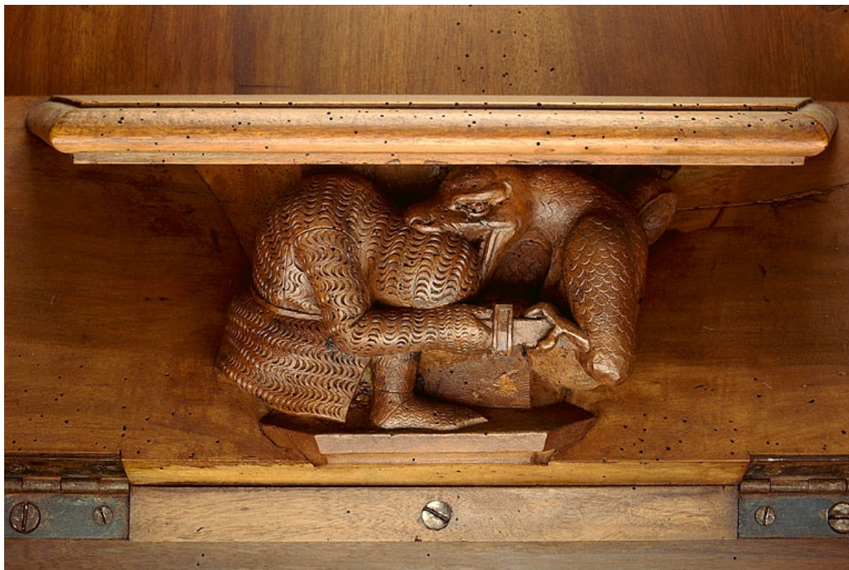
Miséricorde de la vingtième stalle haute.