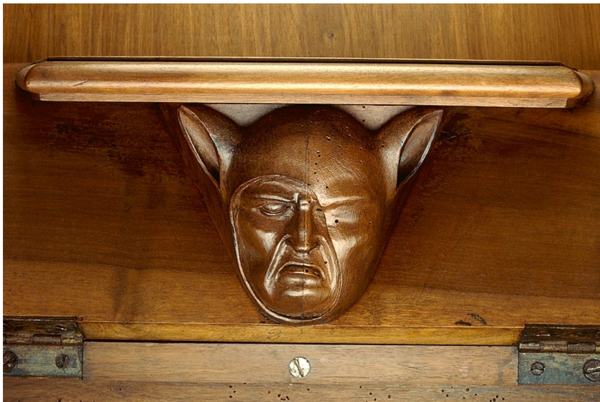
Miséricorde de la sixième stalle haute.