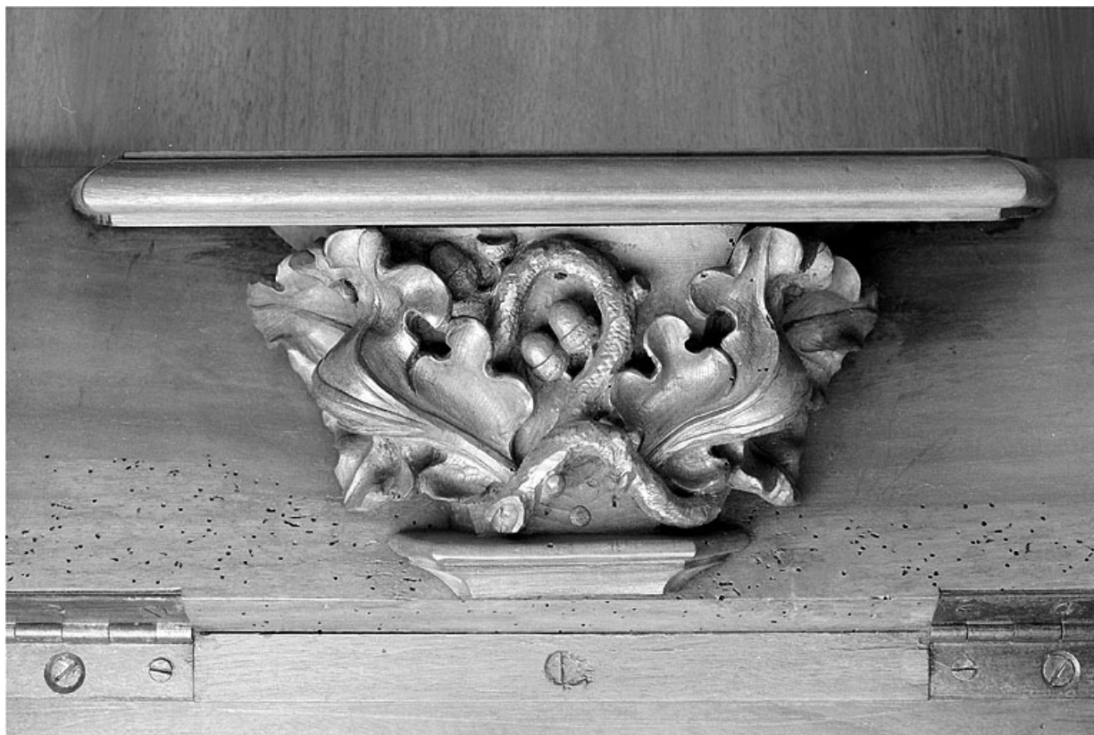
Miséricorde de la vingt deuxième stalle haute.