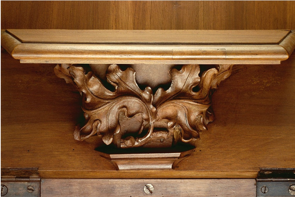
Miséricorde de la seizième stalle haute.