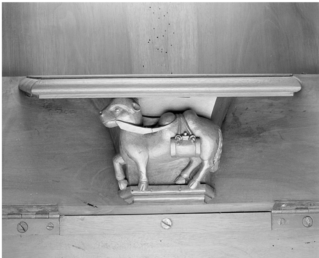
Miséricorde de la dix-septième stalle haute.