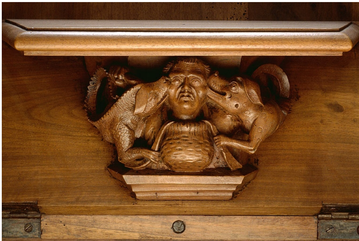
Miséricorde de la neuvième stalle basse.