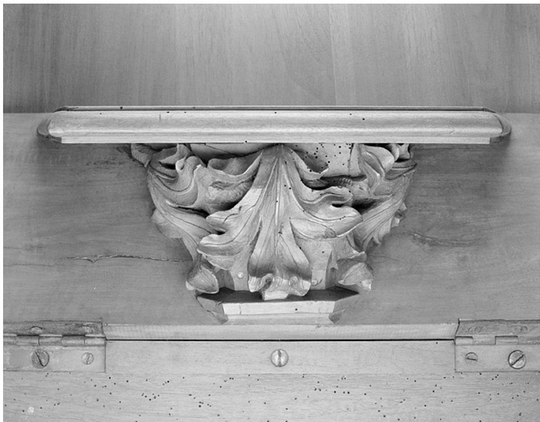
Miséricorde de la dix-huitième stalle haute.