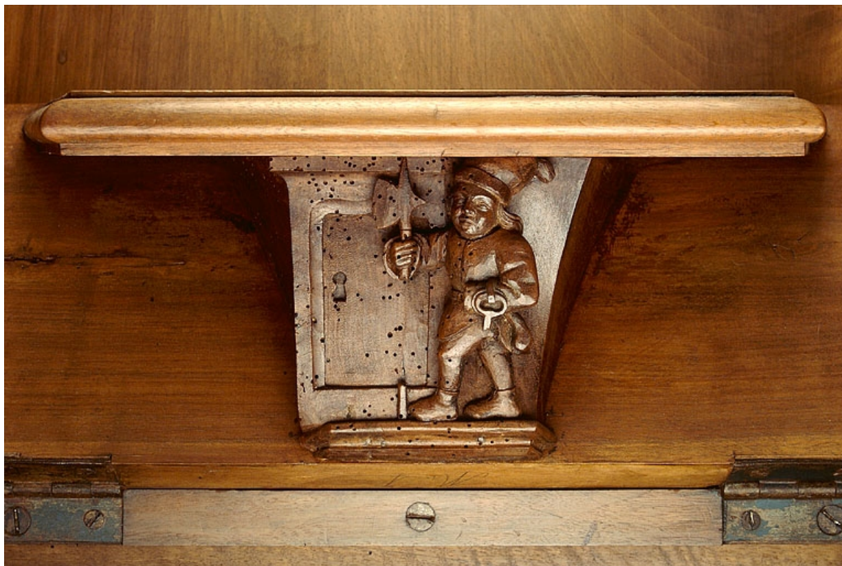
Miséricorde de la quatrième stalle haute.