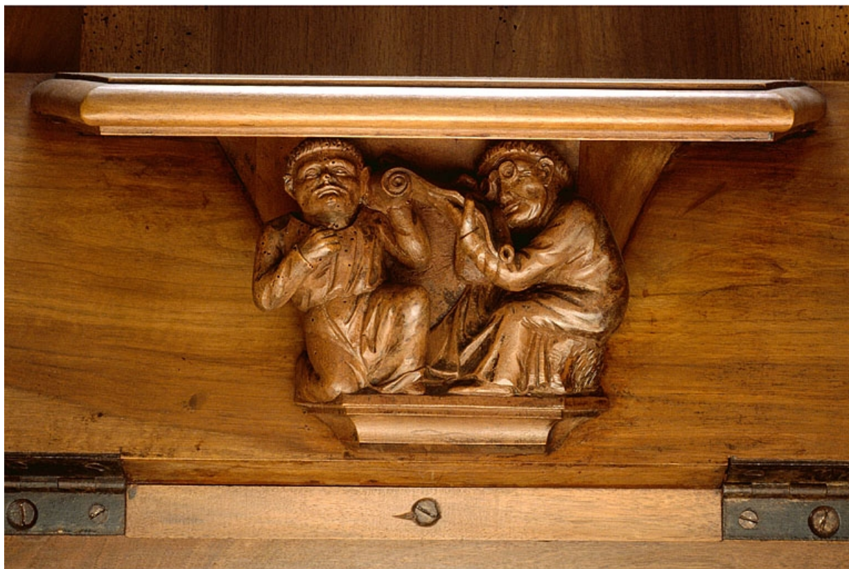
Miséricorde de la onzième stalle basse.