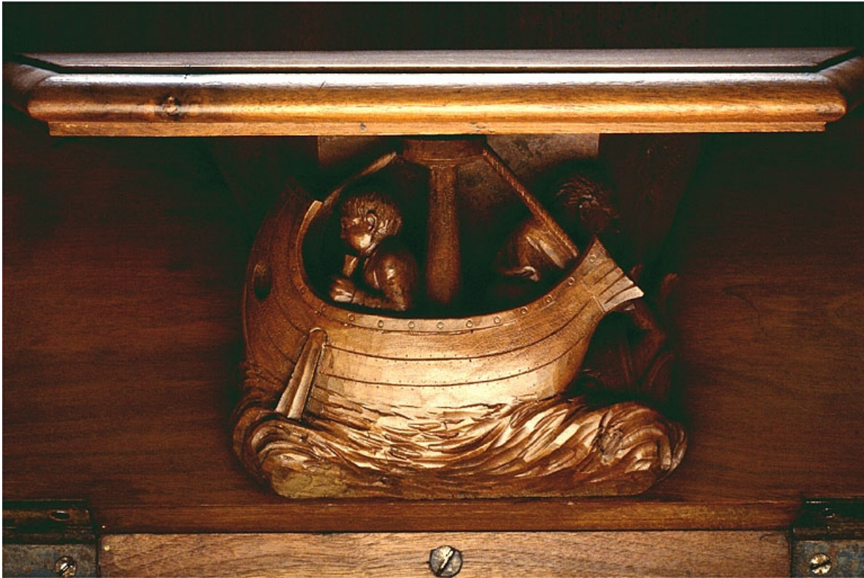
Miséricorde de la septième stalle basse.