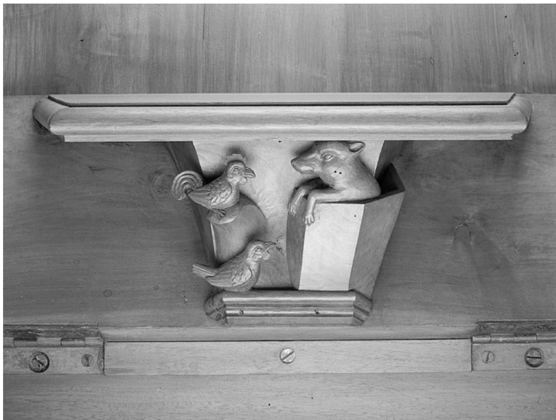
Miséricorde de la douzième stalle haute.