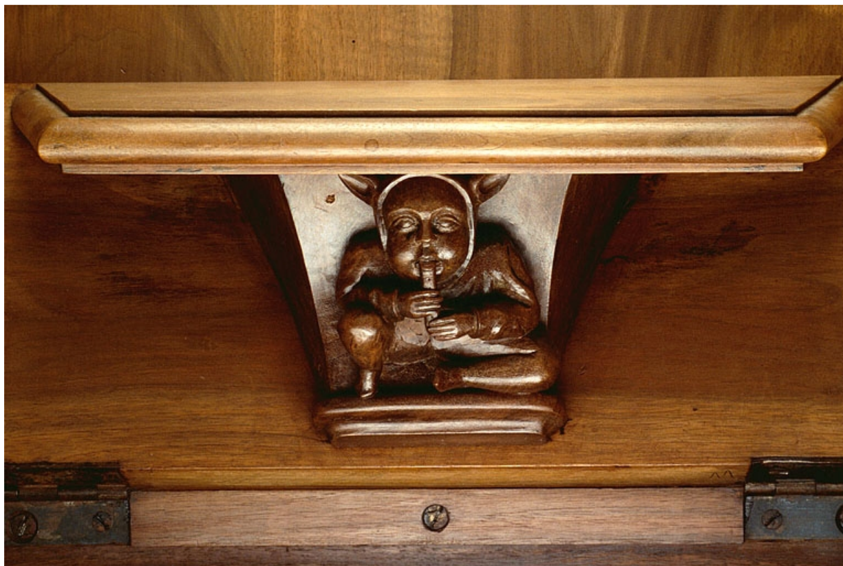
Miséricorde de la onzième stalle haute.