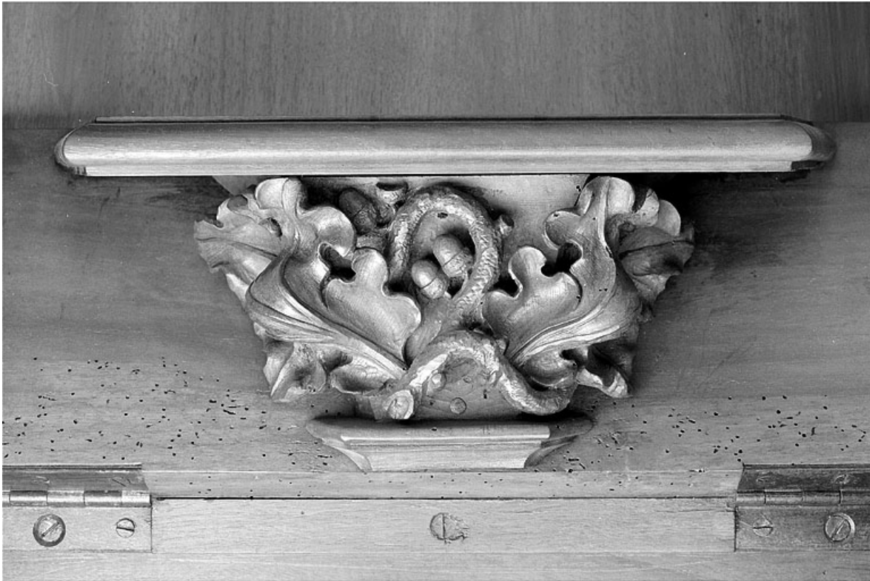
Miséricorde de la vingt deuxième stalle haute.