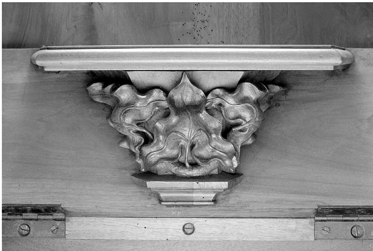
Miséricorde de la douzième stalle basse.