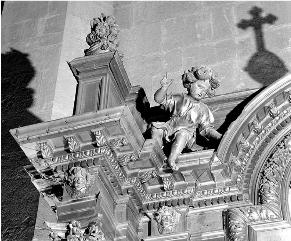
Détail de la partie supérieure gauche.