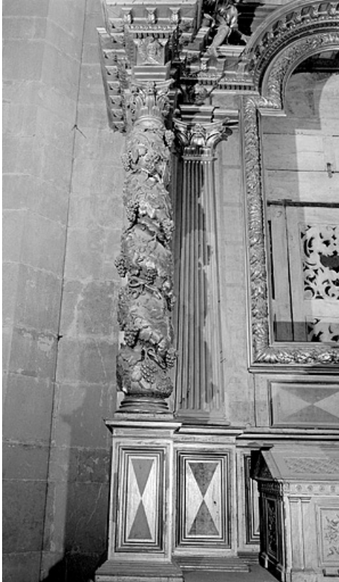
Détail de la colonne gauche.