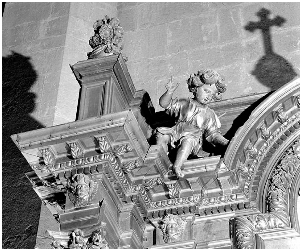
Détail de la partie supérieure gauche. 39, Saint-Claude place de l' Abbaye