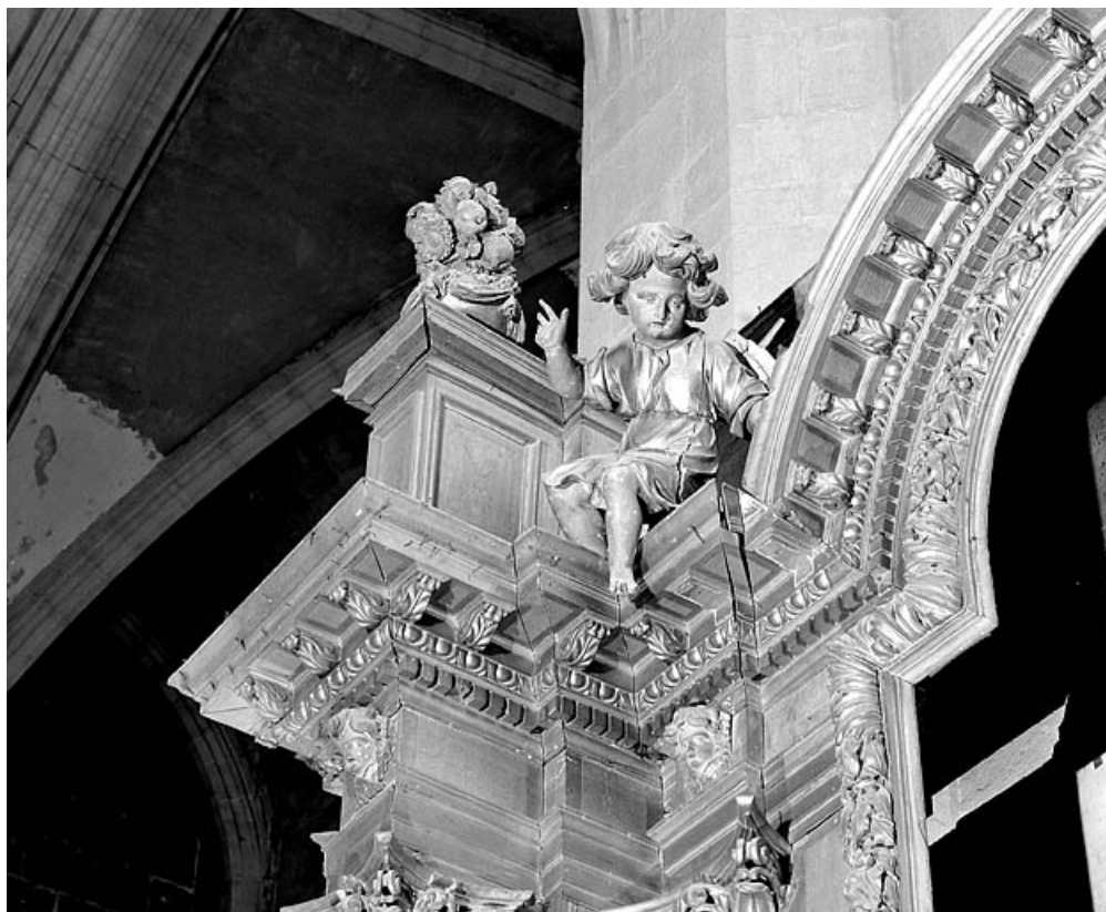
Détail de la partie supérieure gauche.