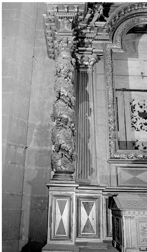
Détail de la colonne gauche.