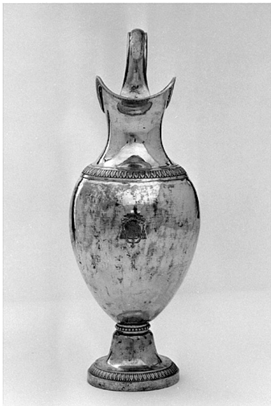
Vue de l'aiguière, de face.