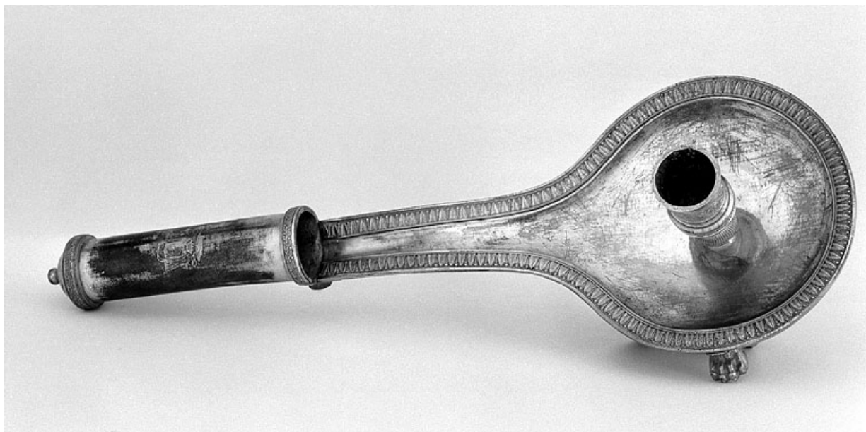
Vue générale, de trois quarts.