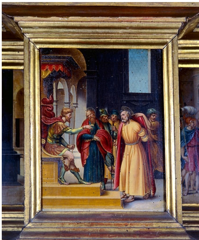
Saint Pierre et saint Paul devant Agrippa.