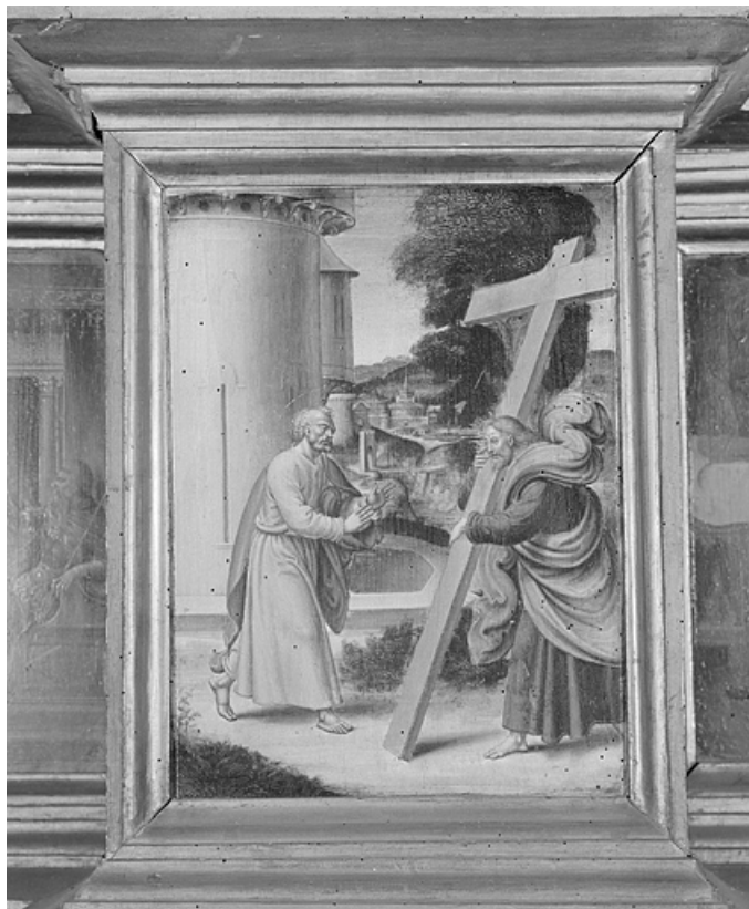
La Rencontre avec le Christ sur la Voie Appienne.