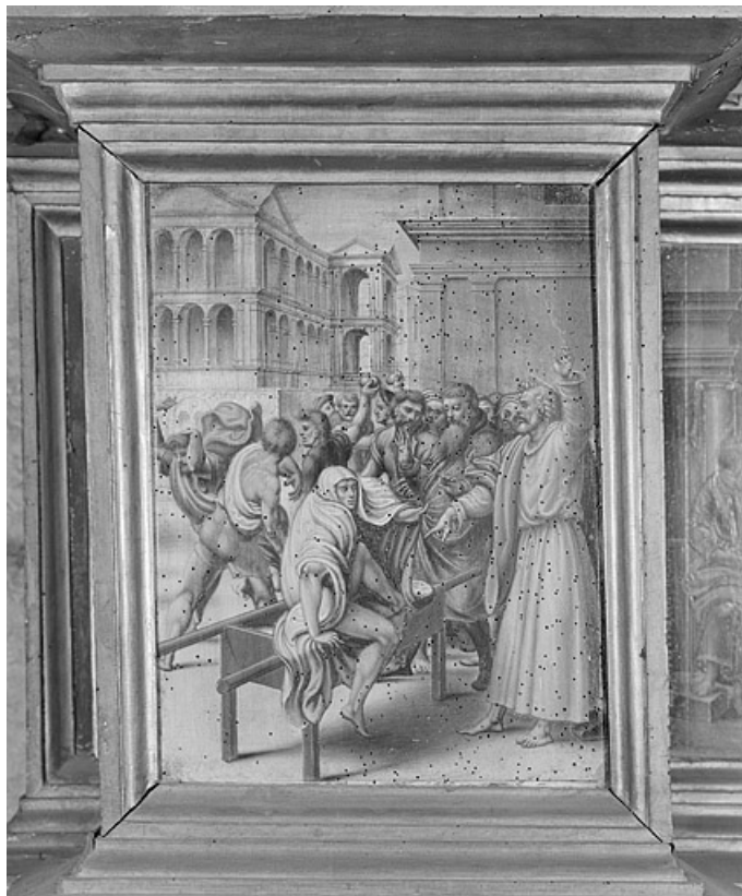
La Résurrection du jeune homme mort.