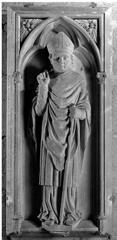
Vue générale, de face.