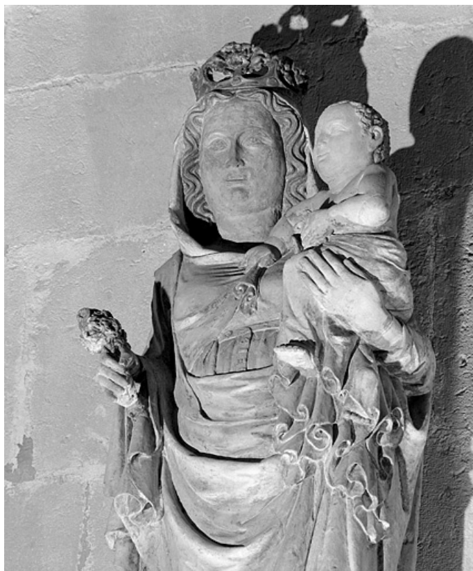
Détail : le buste de la Vierge.