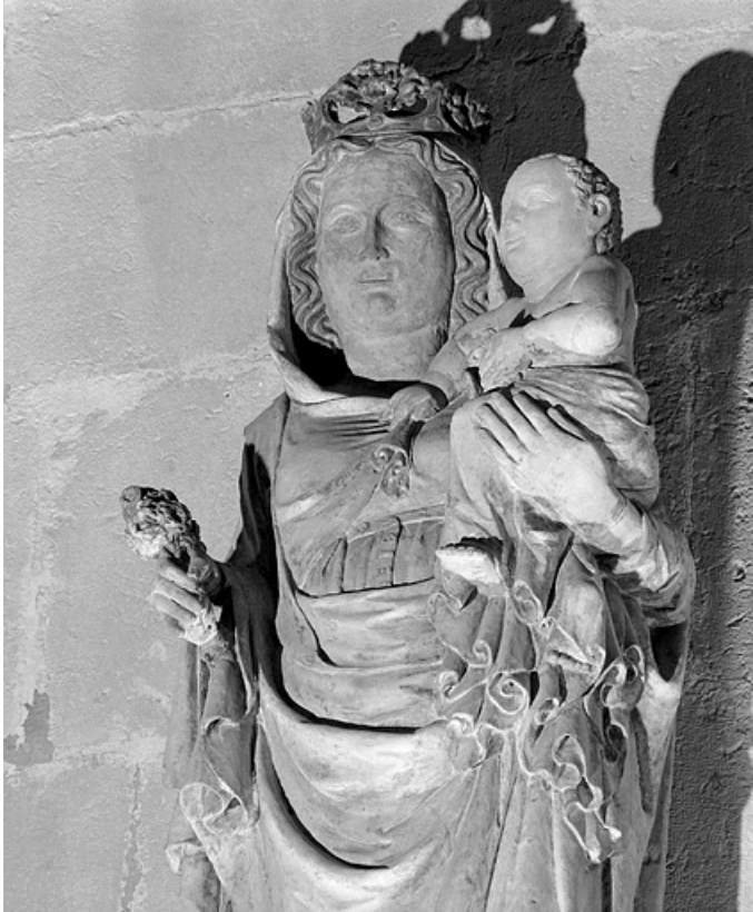
Détail : le buste de la Vierge.