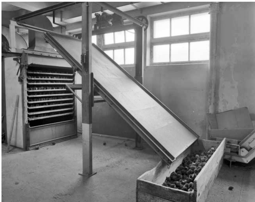
Séchoir ouvert et grille basculée.