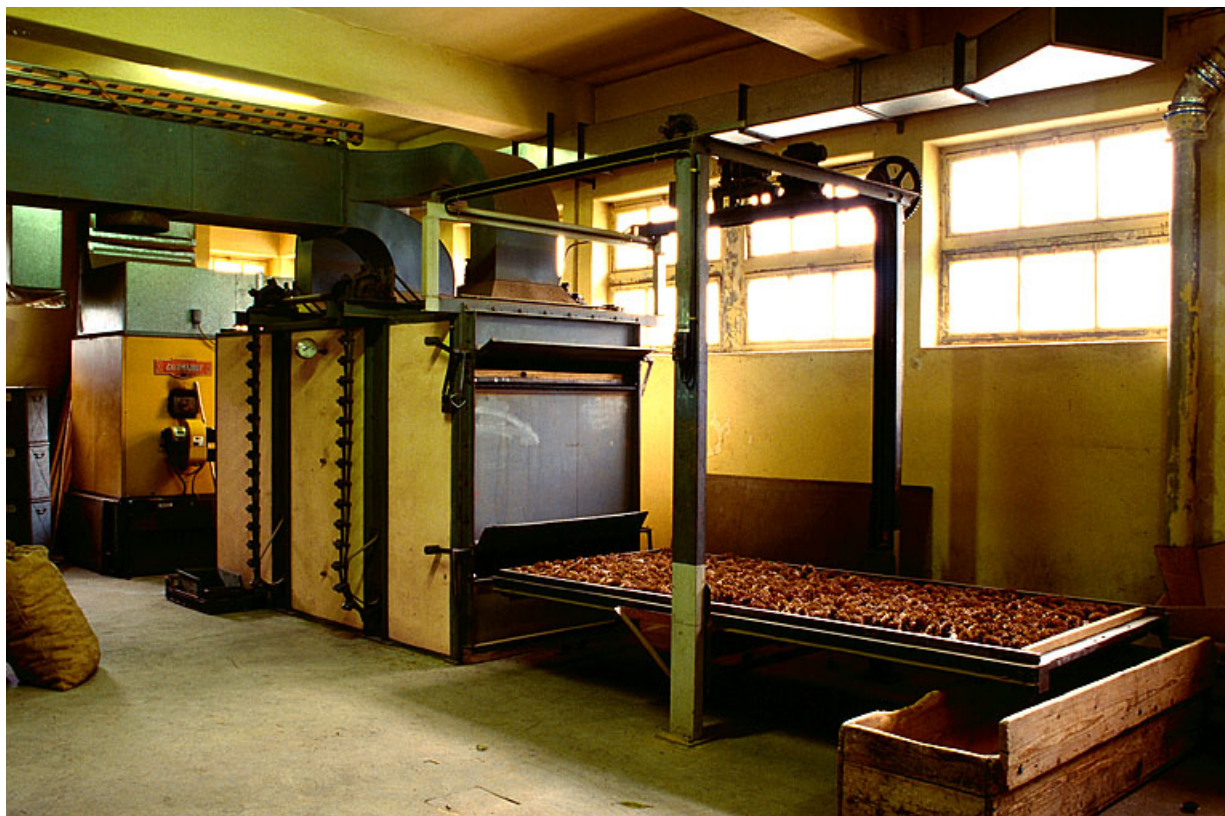
De gauche à droite : chaudière, séchoir et grille chargée de cônes sur le portique. 39, Supt, lieudit : la Joux