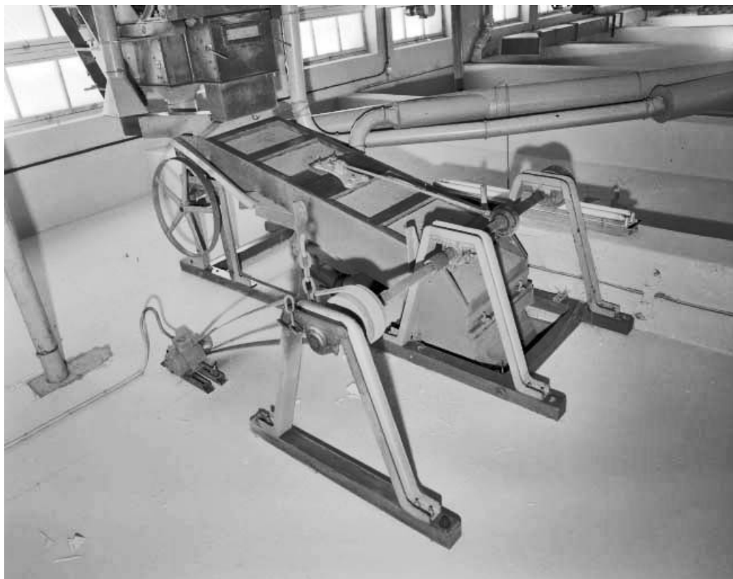
Trémie d'alimentation et distributeur vibrant.