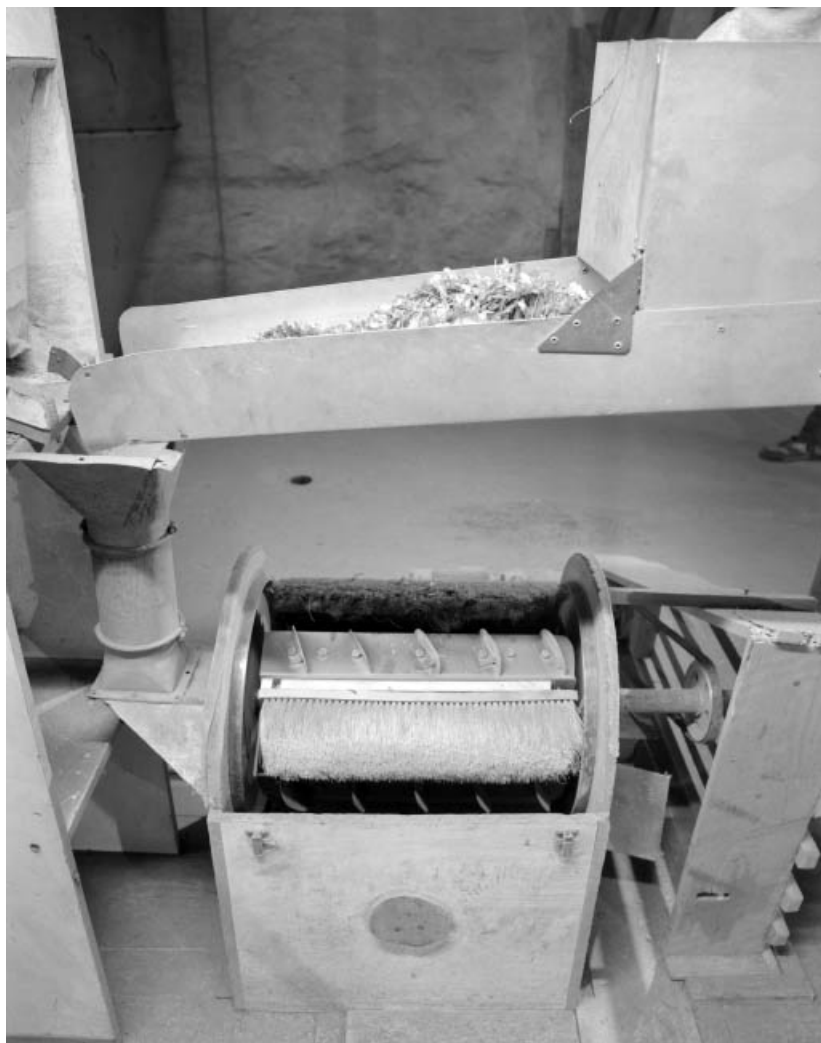
Vue plongeante. Le démontage de la paroi supérieure laisse apparaître les brosses (fibres végétales). 39, Supt, lieudit : la Joux