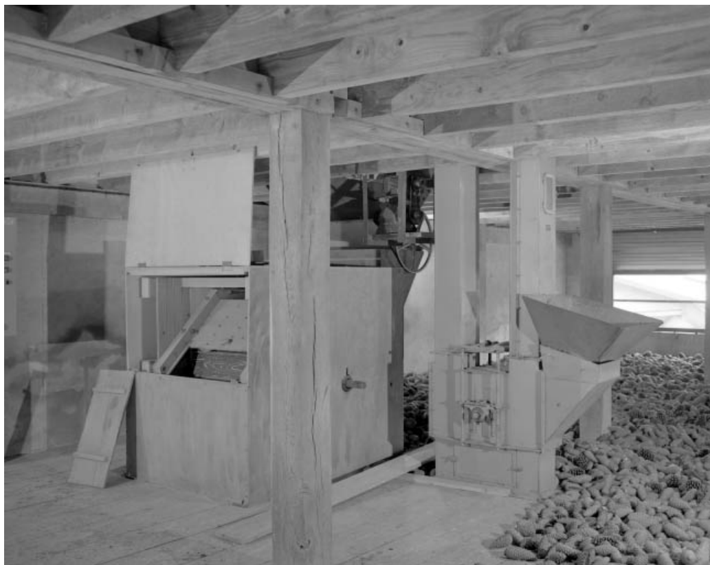
Vue d'ensemble. Batteur et élévateur à godets.