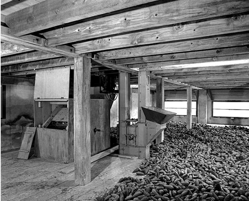
De gauche à droite : batteur, élévateur à godets et aire de séchage des cônes de résineux.