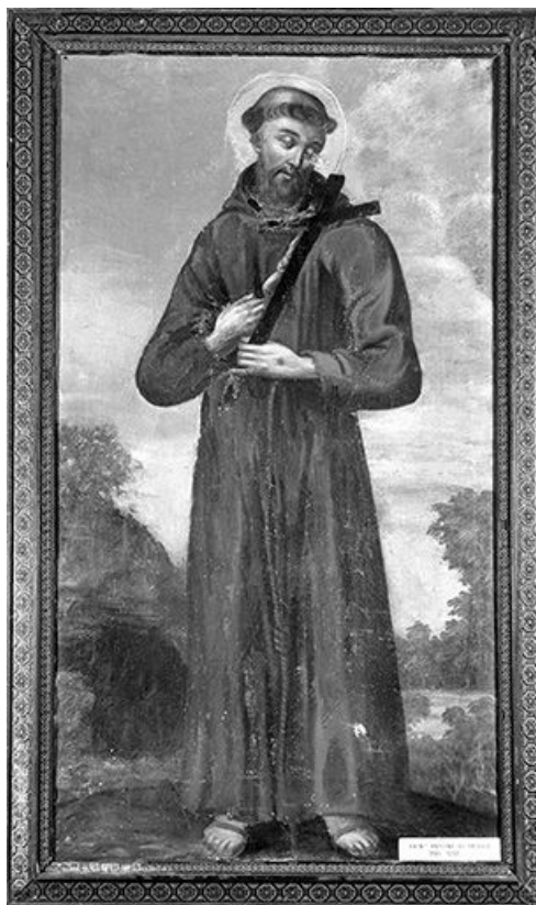
Saint Antoine de Padoue.

39, Saint-Claude chemin de la Chapelle, lieudit : Chaumont