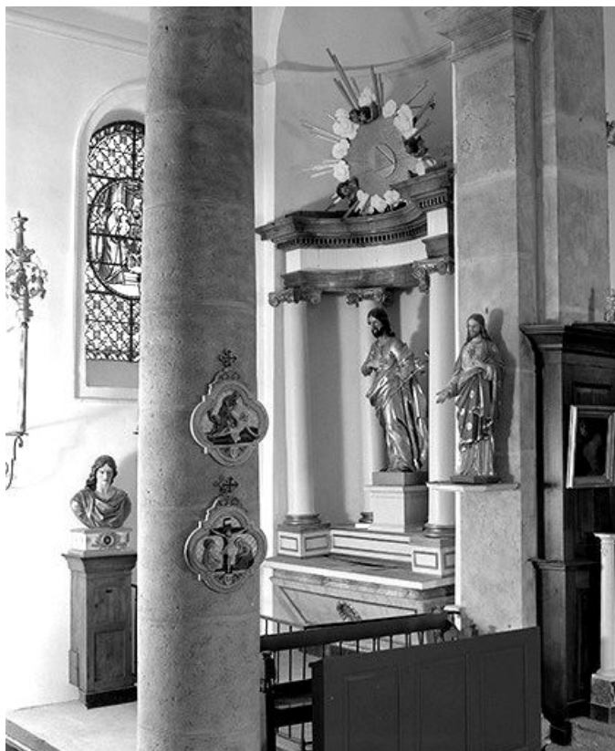
Vue d'ensemble de l'autel et du retable de la Vierge.

39, Saint-Claude rue de la Mairie, lieudit : Valfin-lès-Saint-Claude