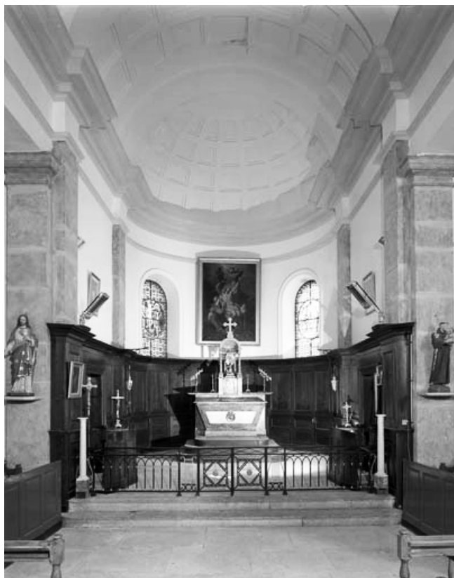
Le choeur vu depuis la nef.

39, Saint-Claude rue de la Mairie, lieudit : Valfin-lès-Saint-Claude