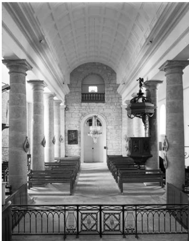
La nef vue depuis le chœur.

39, Saint-Claude rue de la Mairie, lieudit : Valfin-lès-Saint-Claude