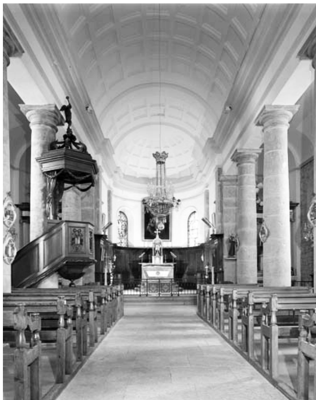
La nef et le chœur vus depuis l'entrée.

39, Saint-Claude rue de la Mairie, lieudit : Valfin-lès-Saint-Claude