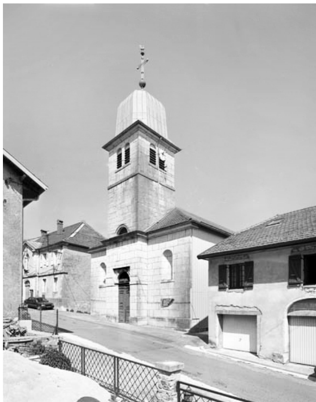
Façade ouest et clocher, vus de trois quarts droit.

39, Saint-Claude rue de la Mairie, lieudit : Valfin-lès-Saint-Claude