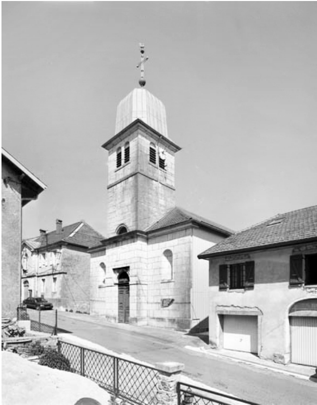
Façade ouest et clocher, vus de trois quarts droit.

39, Saint-Claude rue de la Mairie, lieudit : Valfin-lès-Saint-Claude