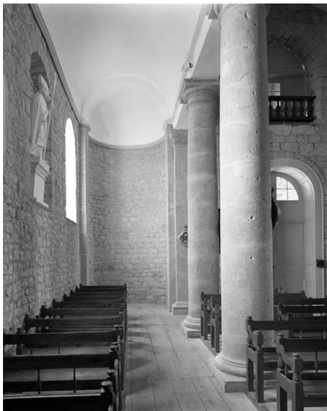
Le bas-côté sud, vu depuis l'est.

39, Saint-Claude rue de la Mairie, lieudit : Valfin-lès-Saint-Claude