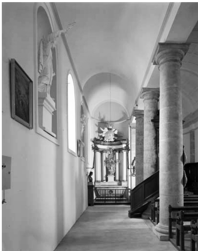
Le bas-côté nord, vu depuis l'ouest.

39, Saint-Claude rue de la Mairie, lieudit : Valfin-lès-Saint-Claude