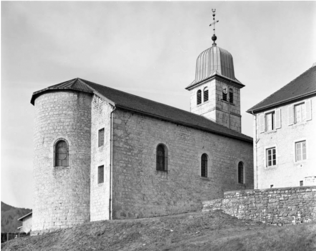
Face nord et abside.

39, Saint-Claude rue de la Mairie, lieudit : Valfin-lès-Saint-Claude