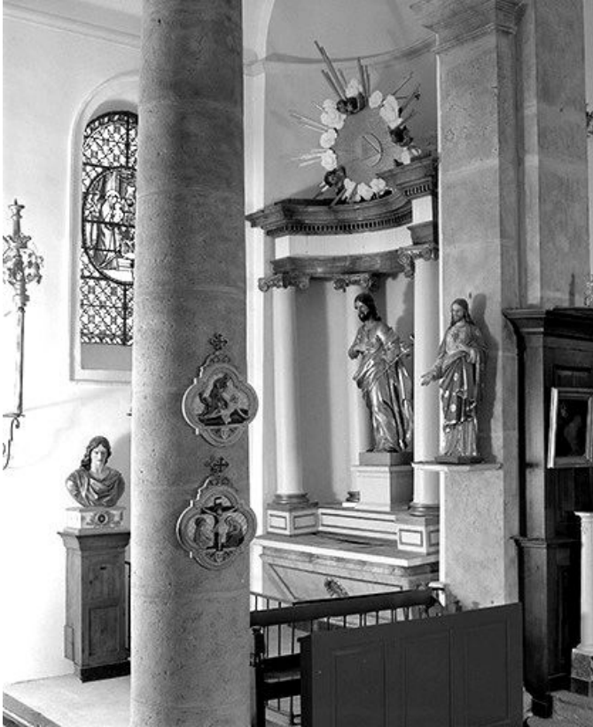
Vue d'ensemble de l'autel et du retable de la Vierge.

39, Saint-Claude rue de la Mairie, lieudit : Valfin-lès-Saint-Claude