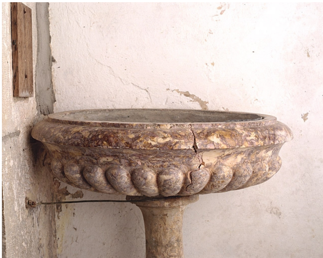
Détail de la cuve.