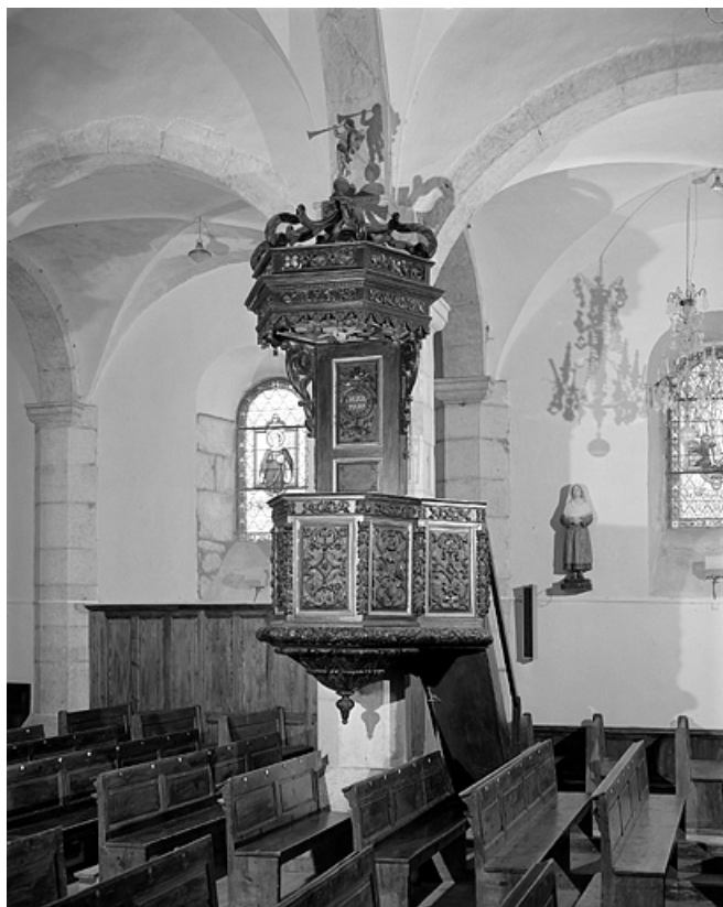
Vue générale. 39, Lamoura