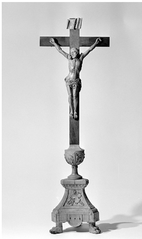
La croix d'autel.