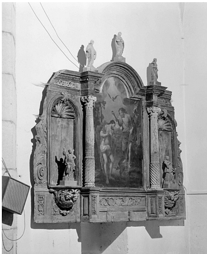
Vue de trois quarts droit.