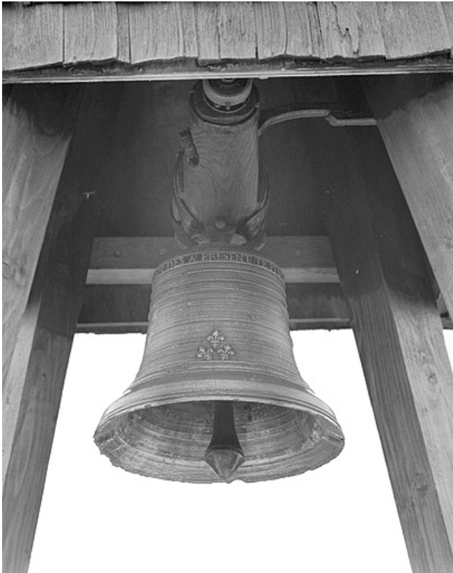
Vue depuis le sud-ouest. 39, Cuttura