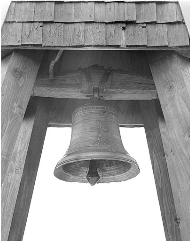
Vue depuis le nord-ouest. 39, Cuttura