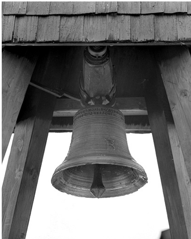
Vue depuis le sud-est. 39, Cuttura