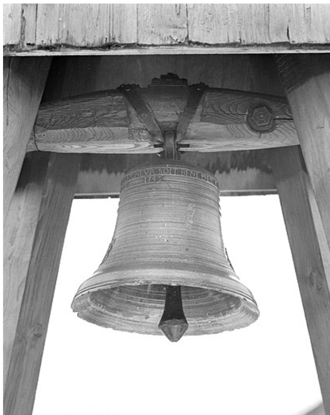
Vue depuis le nord-est. 39, Cultura