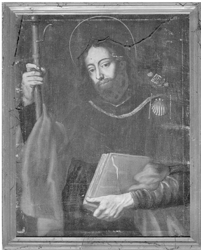
Saint Jacques. 39, Saint-Lupicin