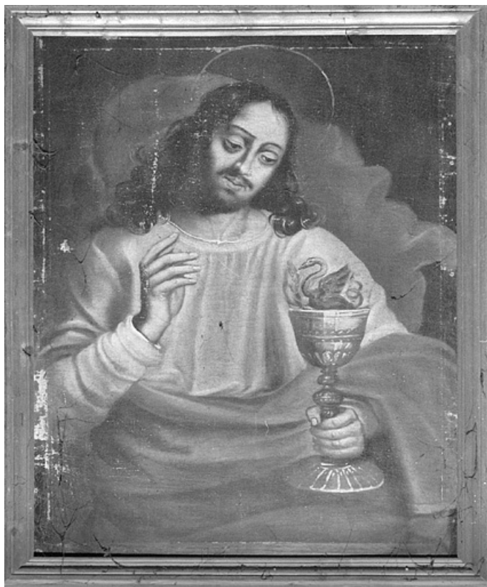
Saint Jean l'évangéliste.