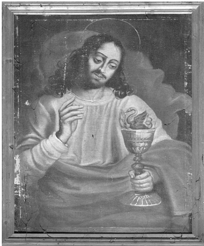
Saint Jean l'évangéliste.