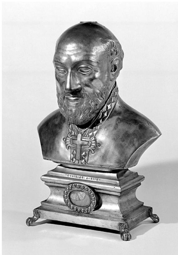
Vue générale de trois quarts.