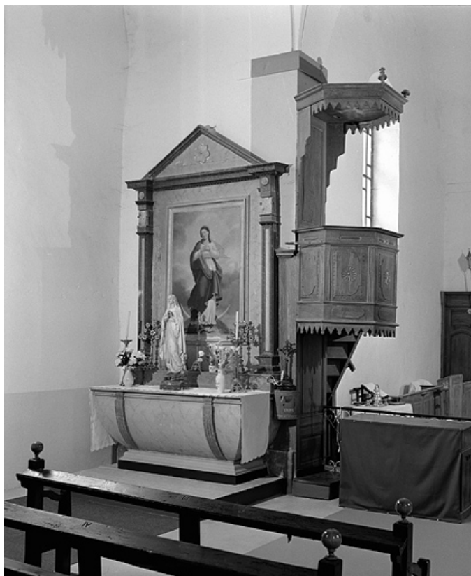
Vue d'ensemble de l'autel retable nord.

39, Villard-Saint-Sauveur, lieudit : le Villard