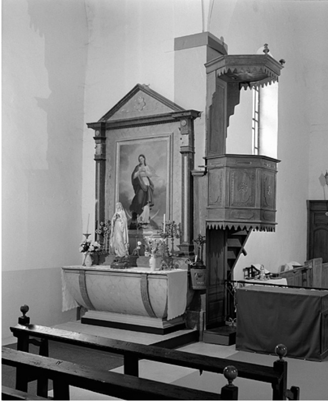
Vue d'ensemble de l'autel retable nord. 39, Villard-Saint-Sauveur, lieudit : le Villard