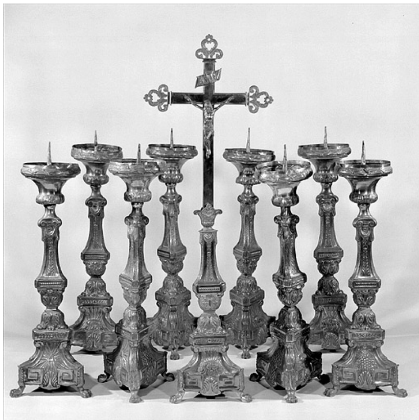
Vue d'ensemble. 39, Septmoncel