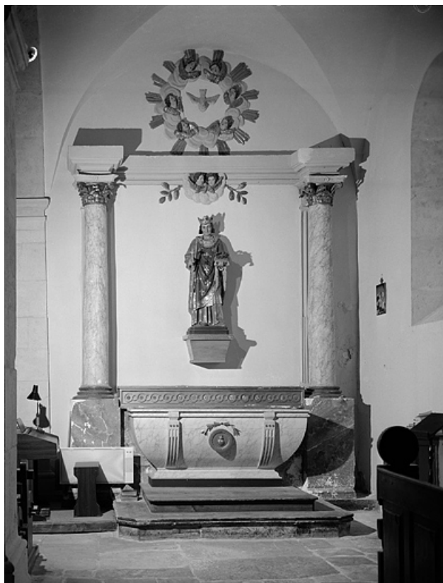
Vue d'ensemble de l'autel retable sud.