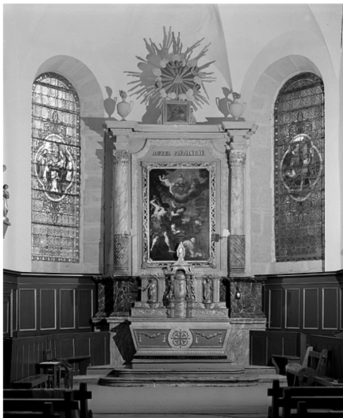
Vue d'ensemble, de face.