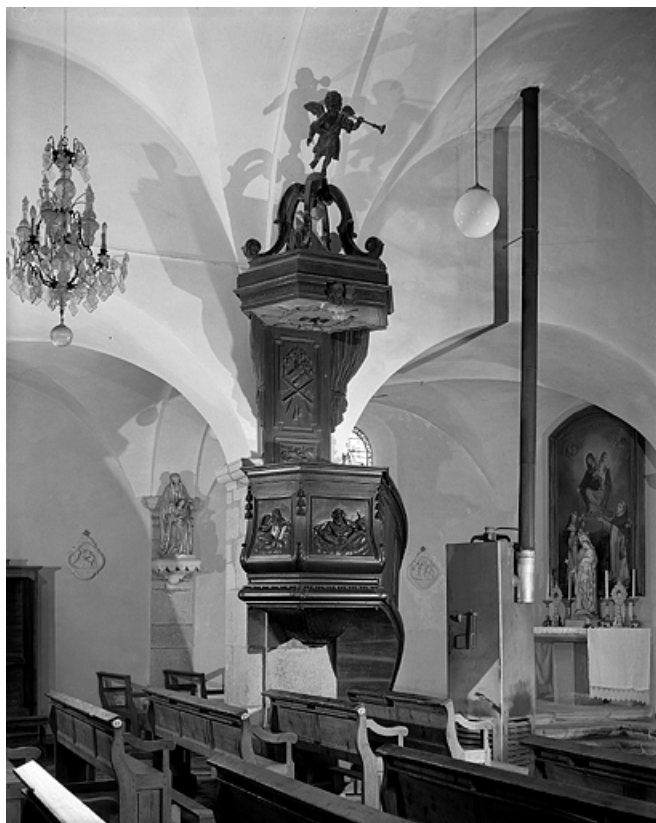
Vue générale. 39, La Rixouse