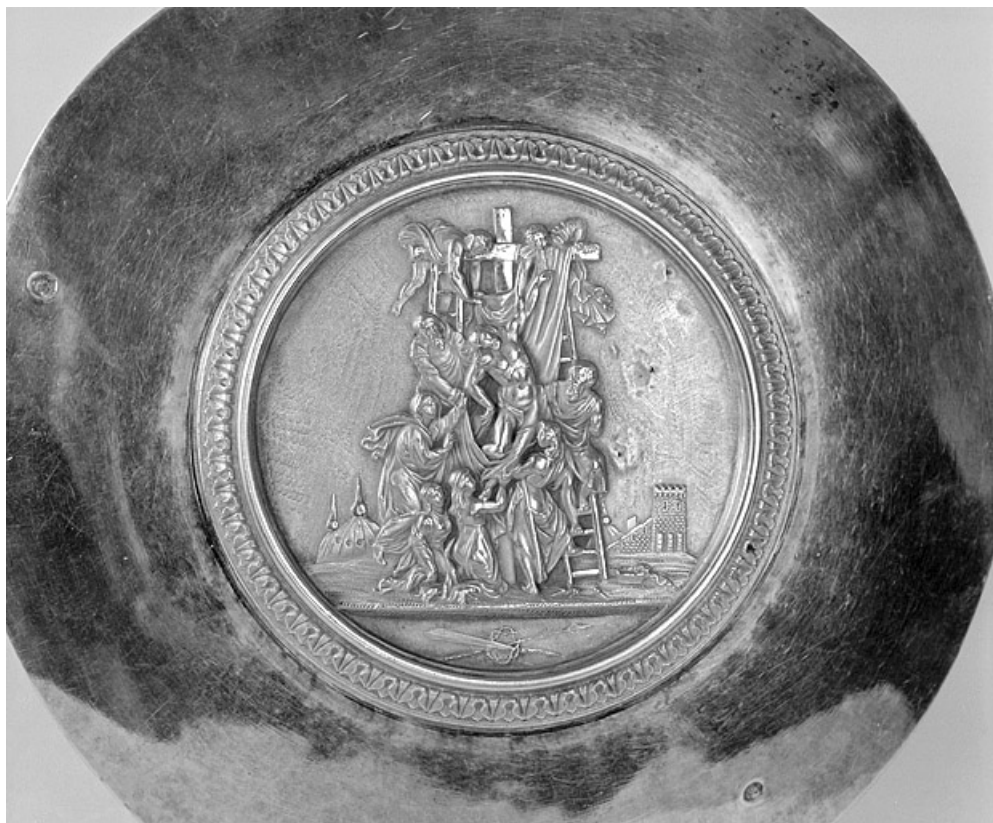
La descente de croix sur la patène.