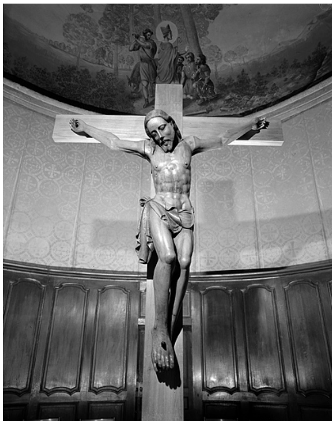
Vue de face. 39, Molinges