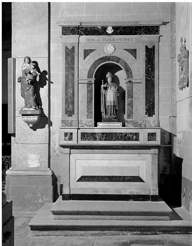
L'autel retable sud.