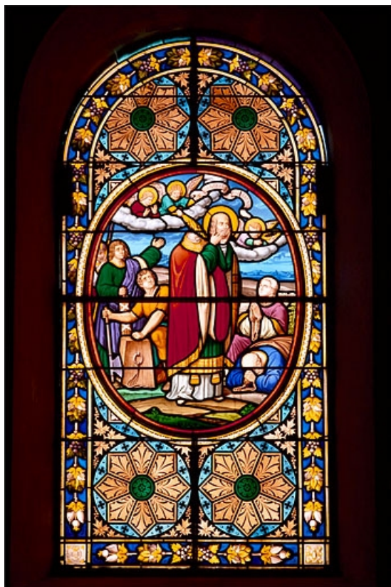
Baie 6 : saint Denis céphalophore.