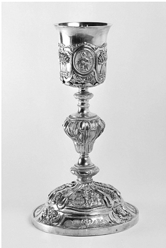
Le calic, vu du côté de la Crucifixion sur le pied. 39, Leschères