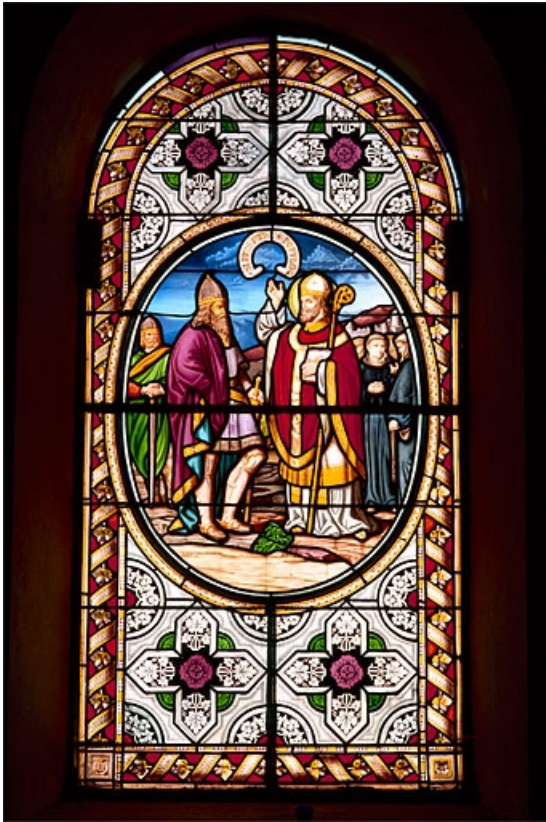
Baie 8 : saint Denis bénissant le roi Dagobert. 39, Leschères