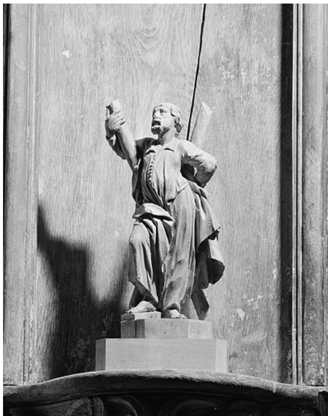
Saint André. 39, Lamoura