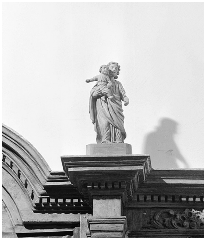
Saint Joseph à l'Enfant. 39, Lamoura