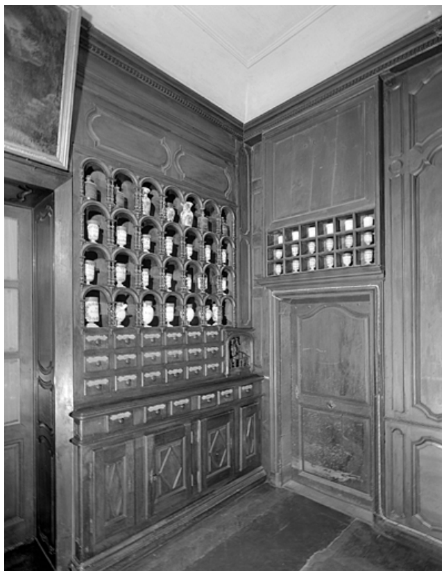
Vue du mur à droite de la porte du salon. 39, Lons-le-Saunier place de l' Hôtel de Ville