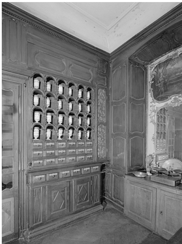
Vue du mur à droite de la porte.

39, Lons-le-Saunier place de l' Hôtel de Ville