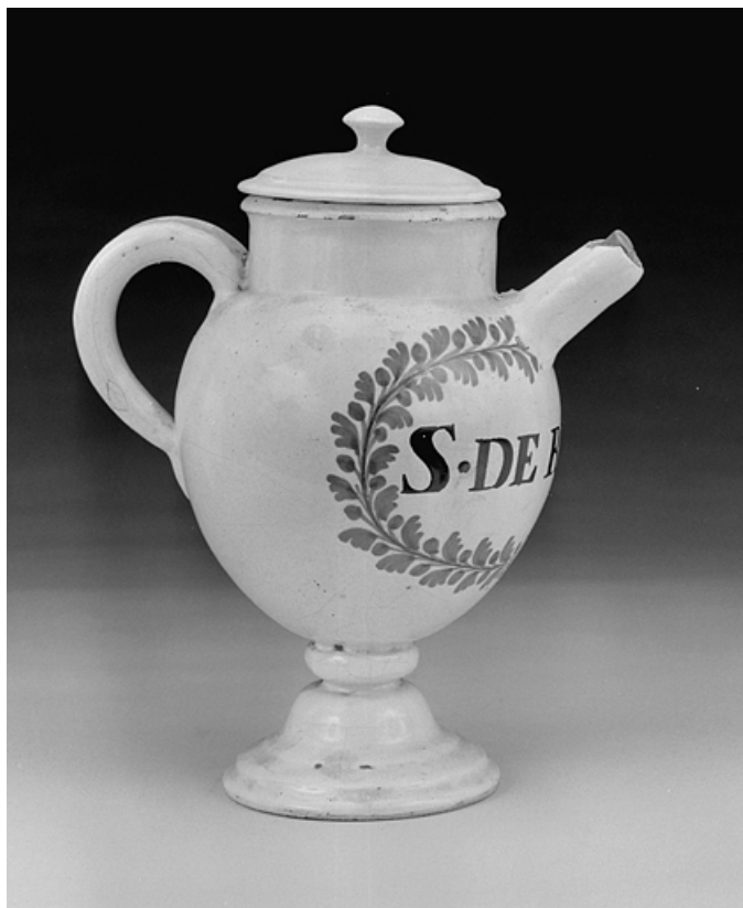
Vue d'une chevrette.

39, Lons-le-Saunier place de l' Hôtel de Ville