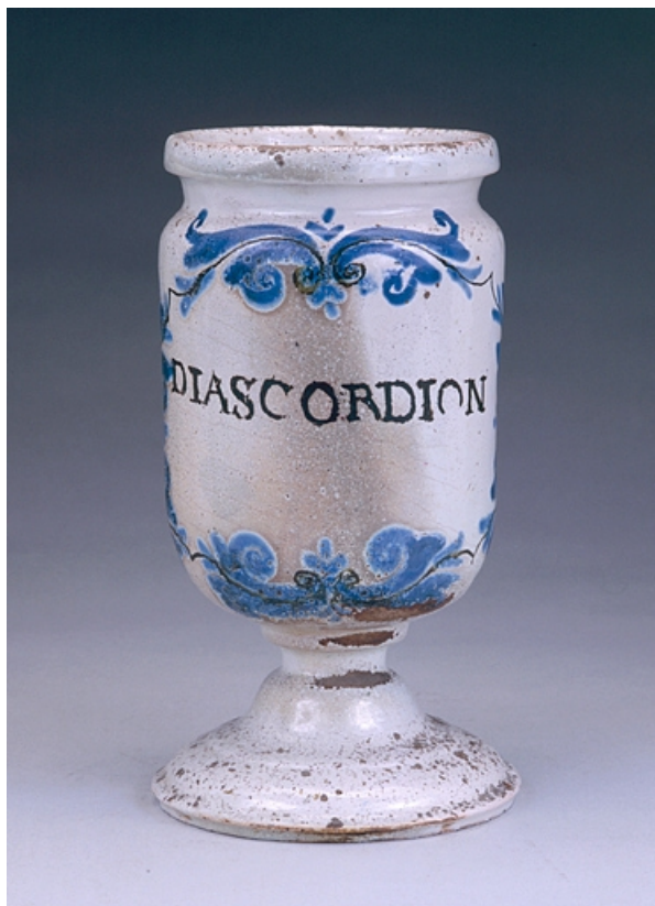
Vue de l'un des albarellos, de trois quarts.

39, Lons-le-Saunier place de l' Hôtel de Ville