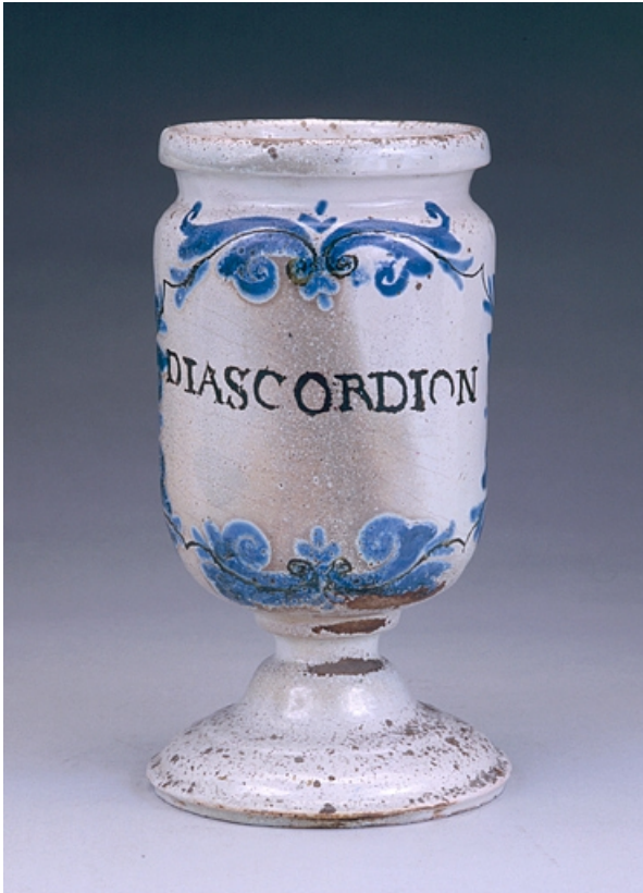
Vue de l'un des albarells, de trois quarts.

39, Lons-le-Saunier place de l' Hôtel de Ville