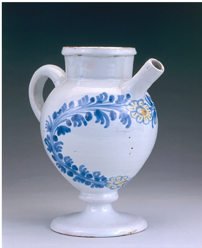
Vue d'une chevrette.

39, Lons-le-Saunier place de l' Hôtel de Ville