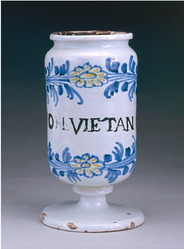
Vue d'un albarello.

39, Lons-le-Saunier place de l' Hôtel de Ville