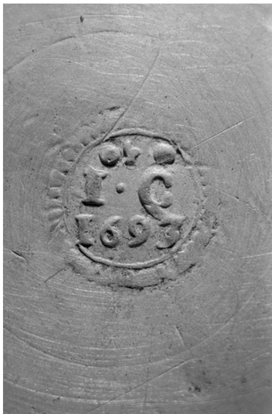
Le poinçon de potier d'étain.

39, Lons-le-Saunier place de l' Hôtel de Ville