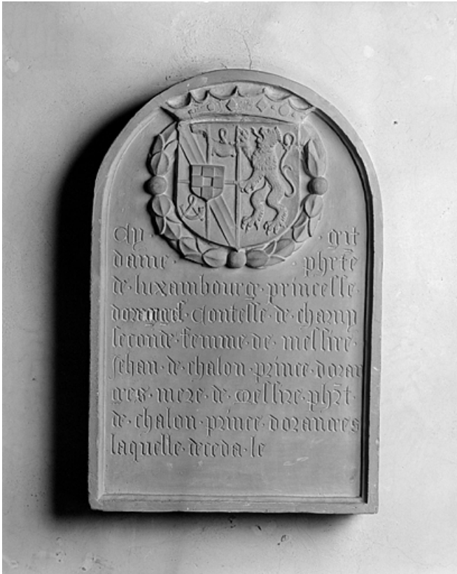
Epitaphe de Philiberte de Luxembourg.