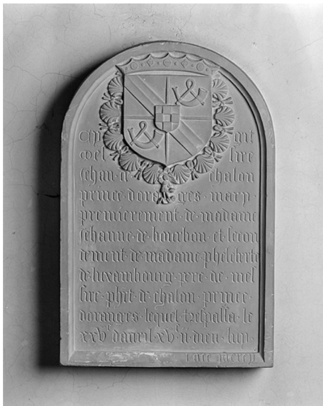
Epitaphe de Jean IV de Chalon Arlay.