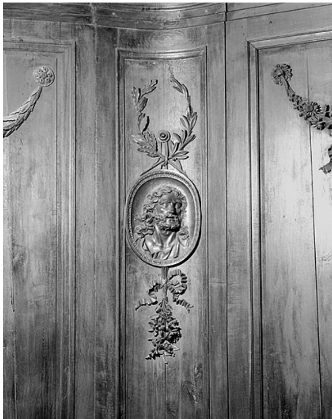
Côté sud : neuvième parclose.