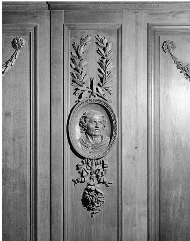
Côté sud : deuxième parclose.