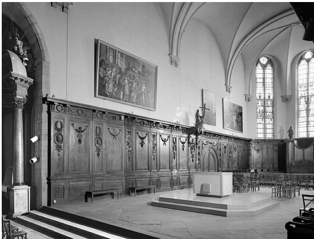
Vue générale du côté nord.