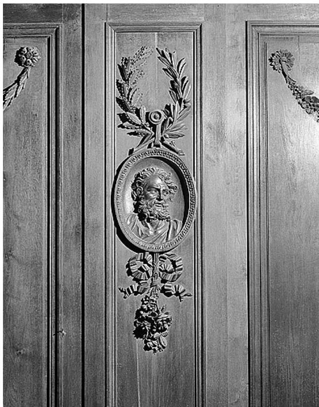
Panneau : buste de saint.