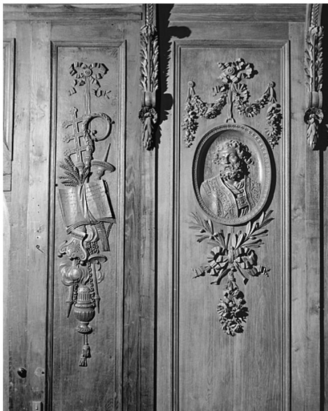
Côté sud : sixième parclose.