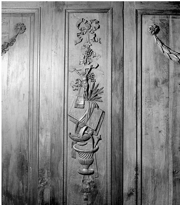
Côté sud : huitième parclose.