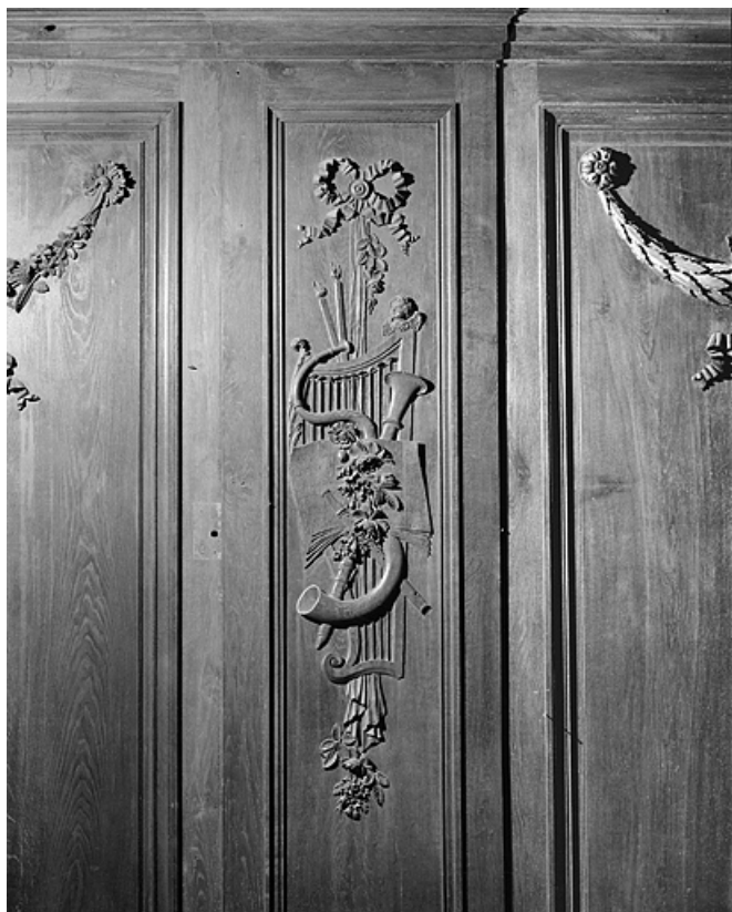
Panneau : chute d'instruments de musique.