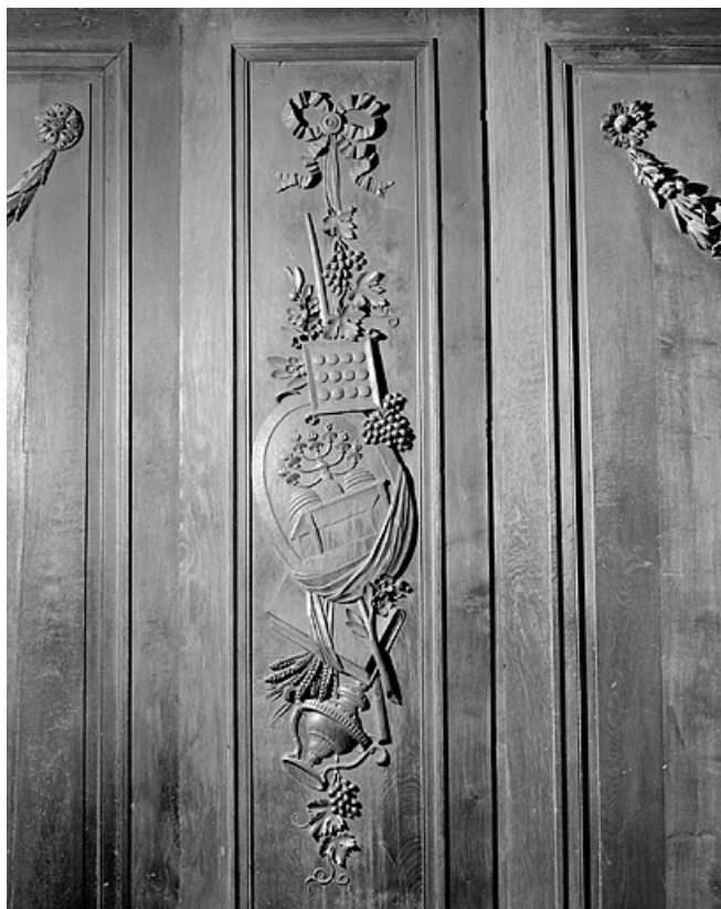
Côté nord : dixième parclose.