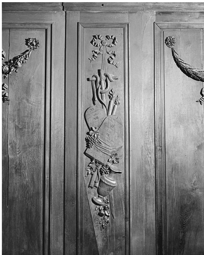
Côté sud : dixième parclose.