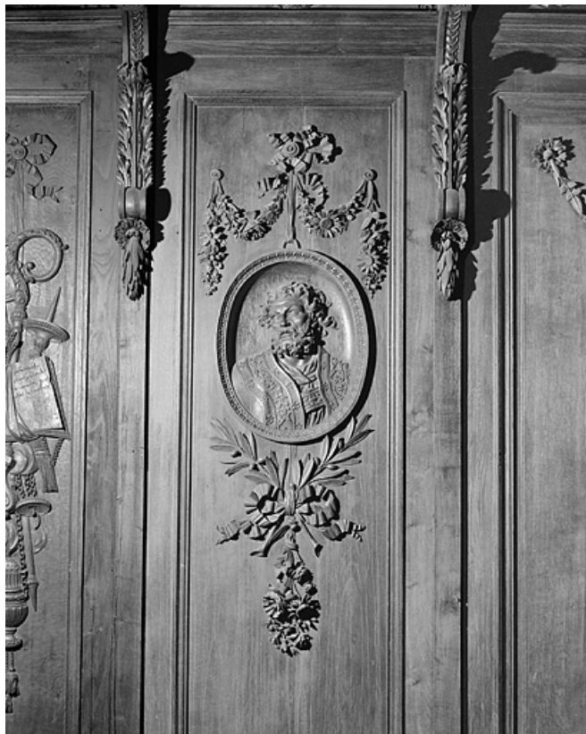
Panneau : buste de saint.