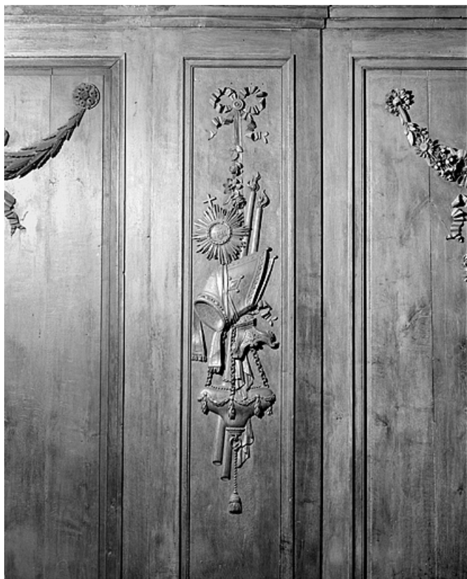
Côté nord : huitième parclose.