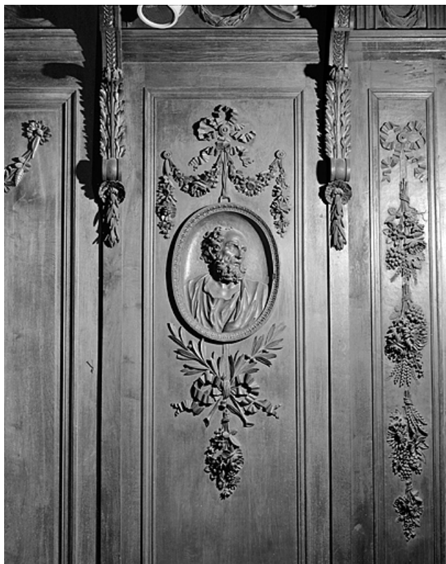
Panneau : buste de saint.