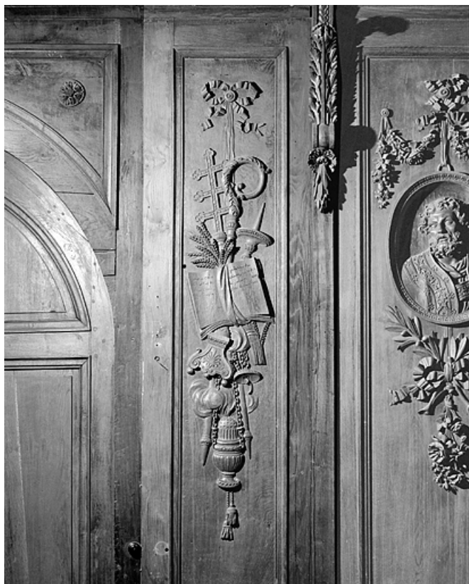
Côté sud : parclose à droite de la porte.