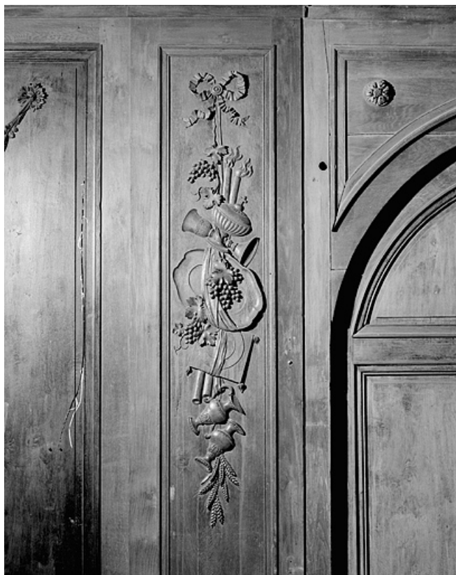
Côté sud : parclose à gauche de la porte.