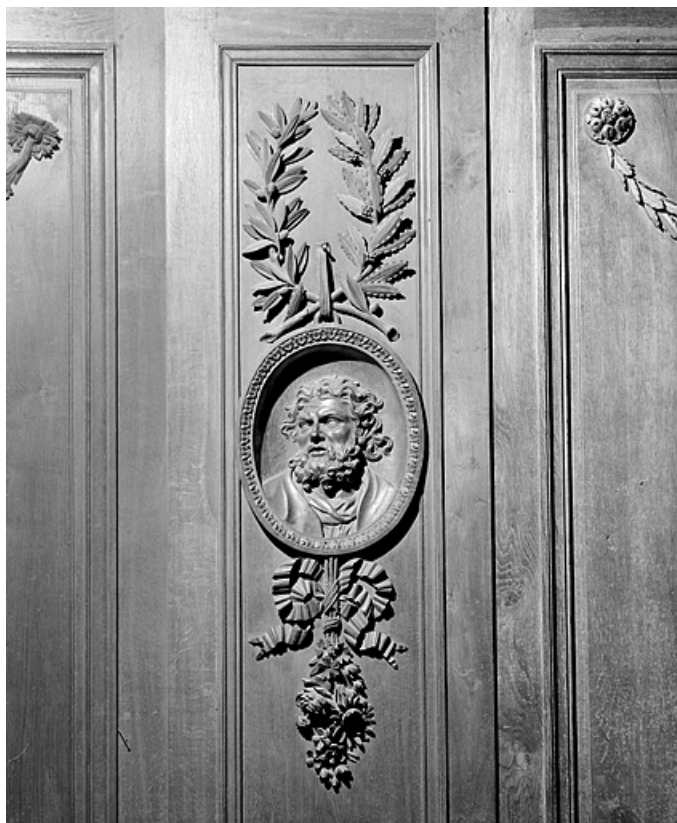
Côté nord : deuxième parclose.