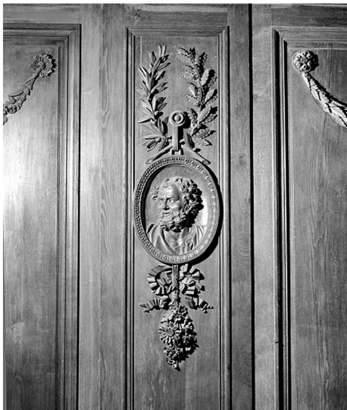
Côté sud : cinquième parclose.