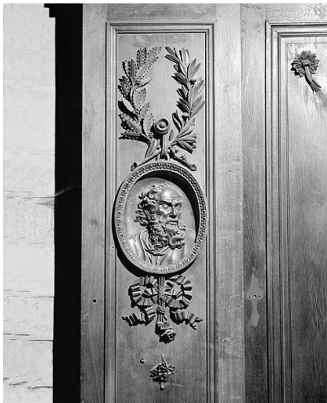
Côté nord : première parclose.