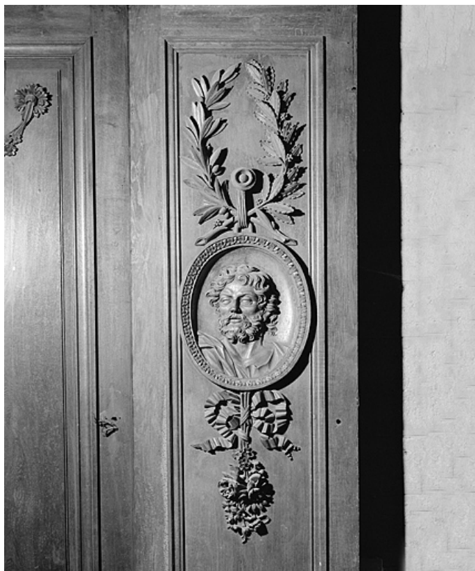
Panneau : buste de saint.