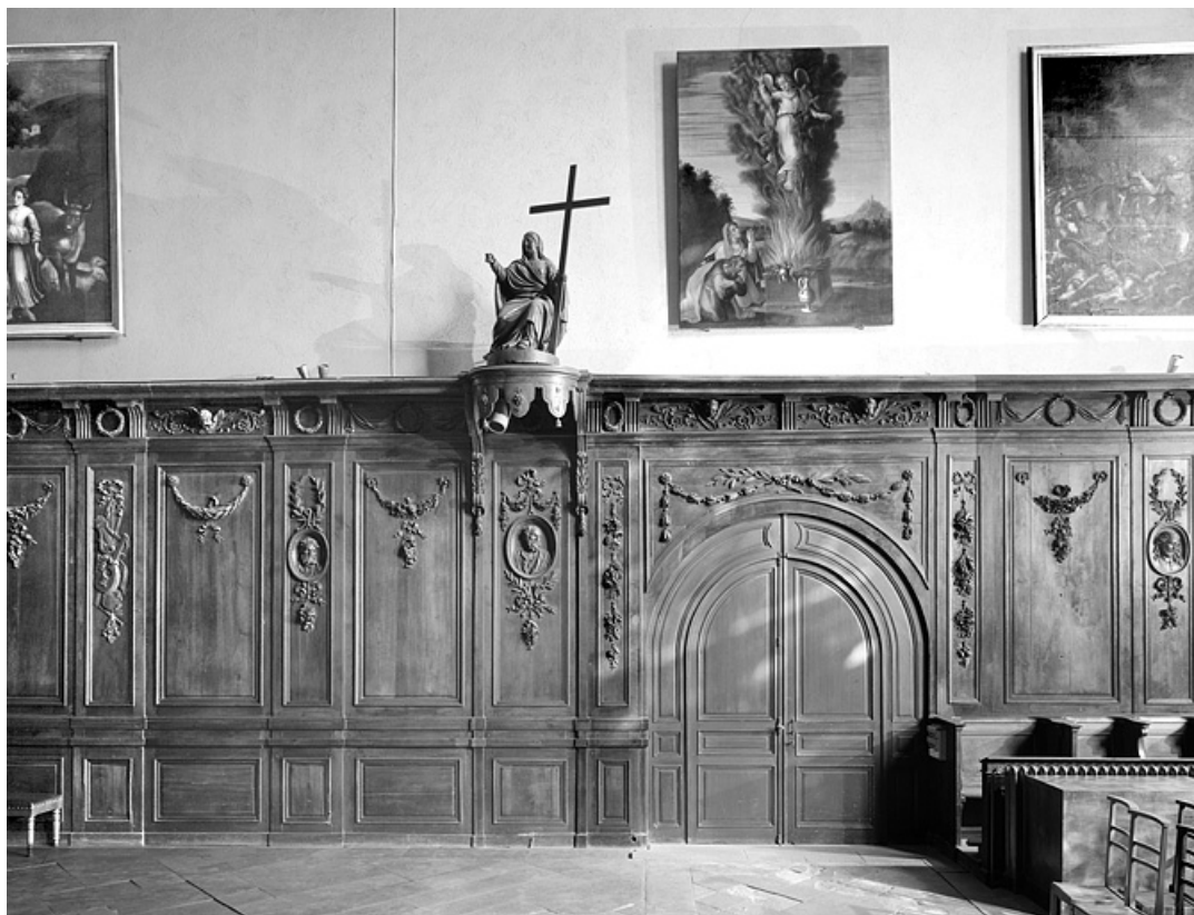
Côté nord : porte.