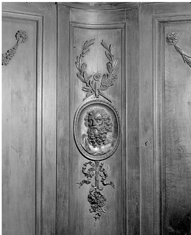
Côté nord : neuvième parclose.