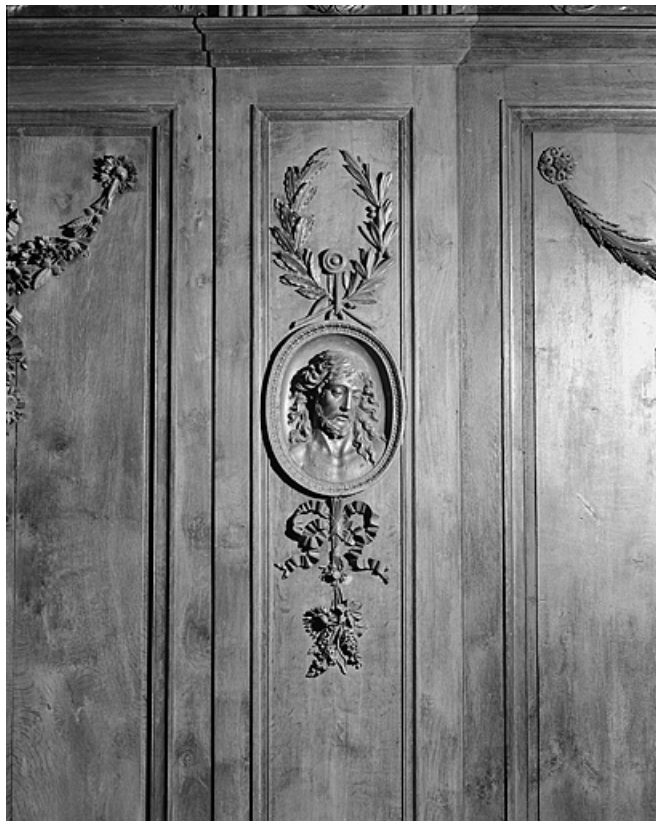
Panneau : buste du Christ.