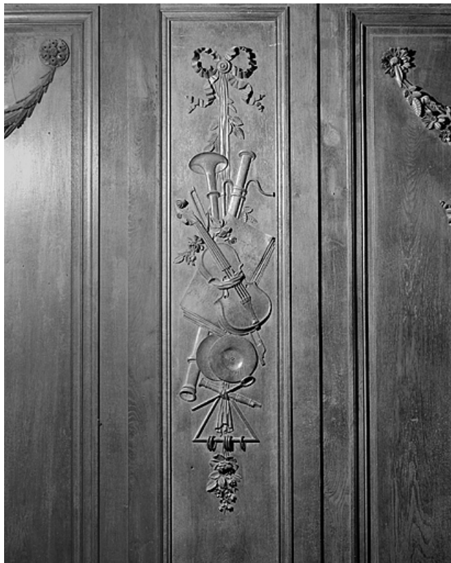
Panneau : chute d'instruments de musique.