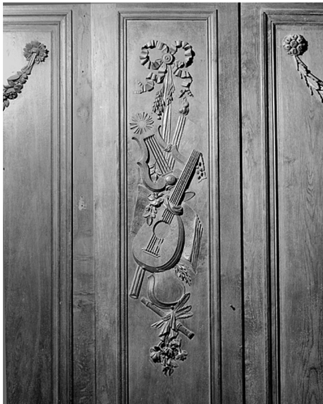
Côté nord : quatrième parclose.