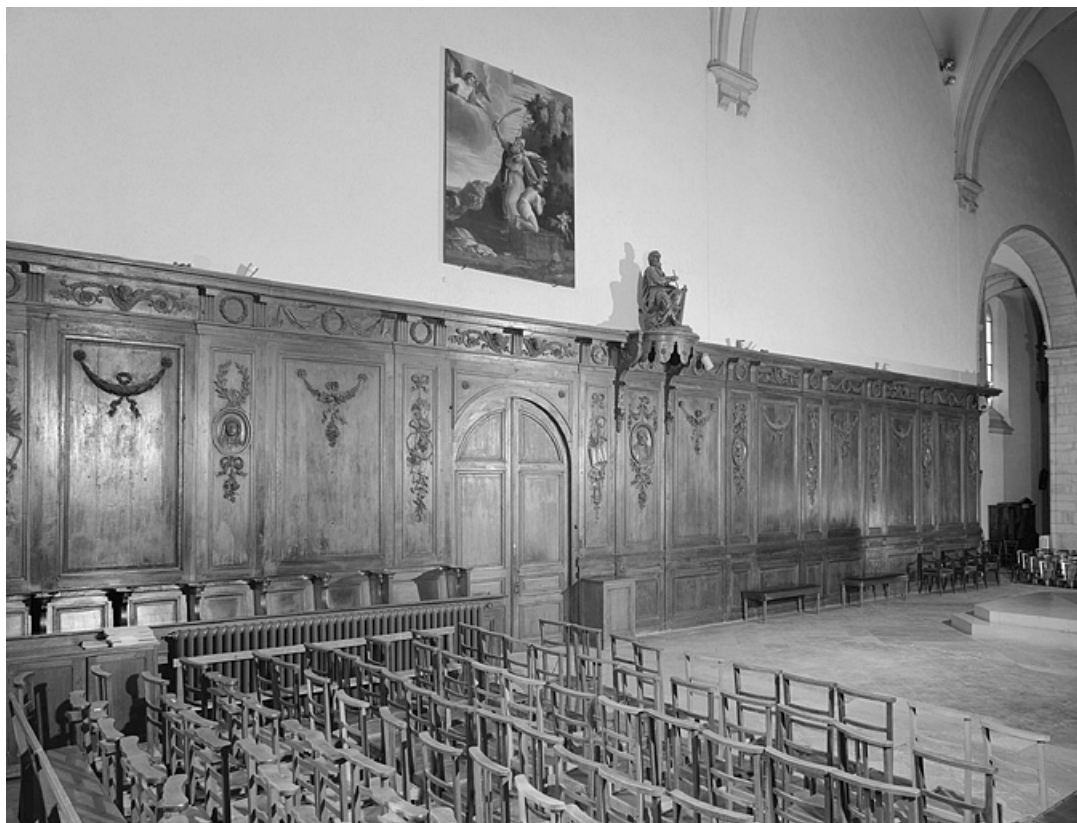
Vue générale du côté sud.