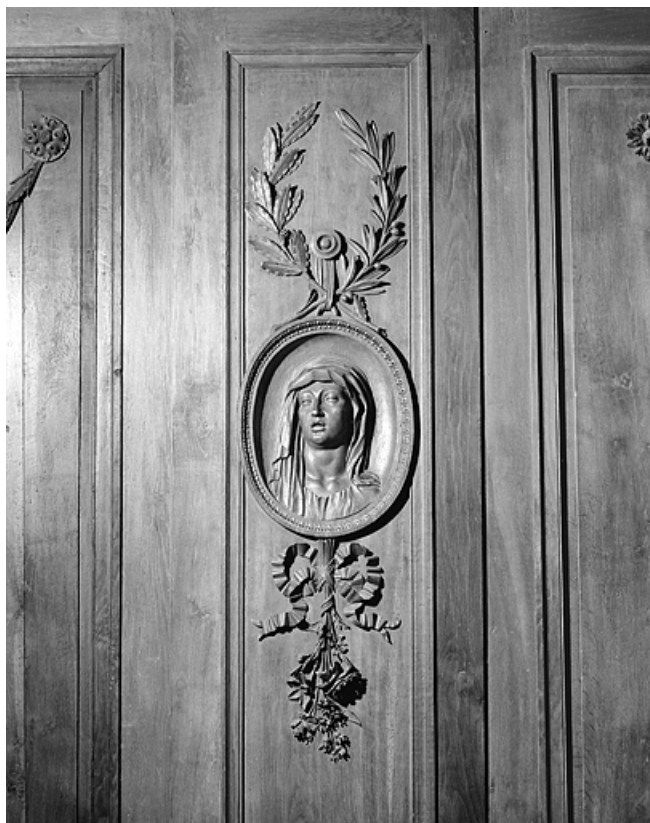
Panneau : buste de la Vierge.