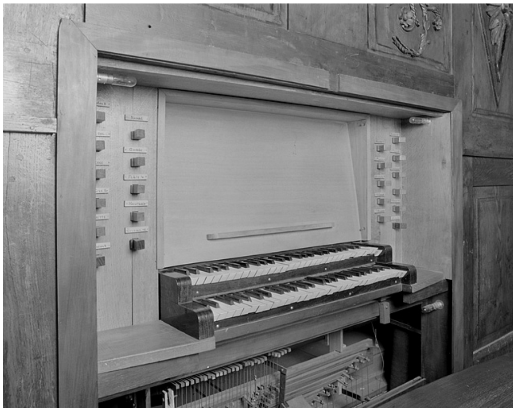
Console en fenêtre, vue de trois quarts gauche.

39, Lons-le-Saunier, 1 rue de la Préfecture