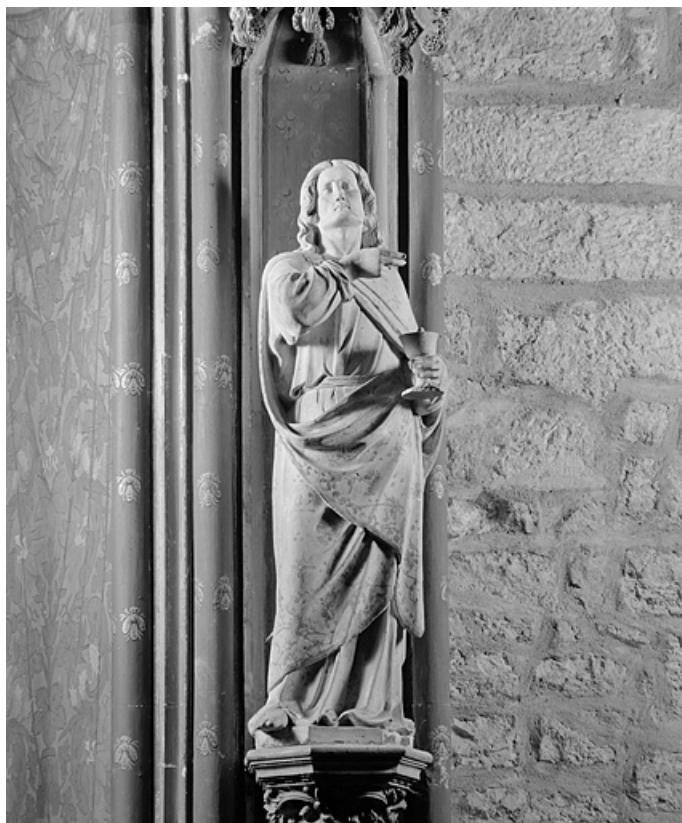
Saint Jean l'évangéliste.

39, Lons-le-Saunier, 1 rue de la Préfecture