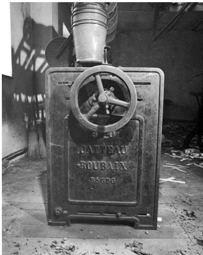
Marque du constructeur (extrémité gauche).