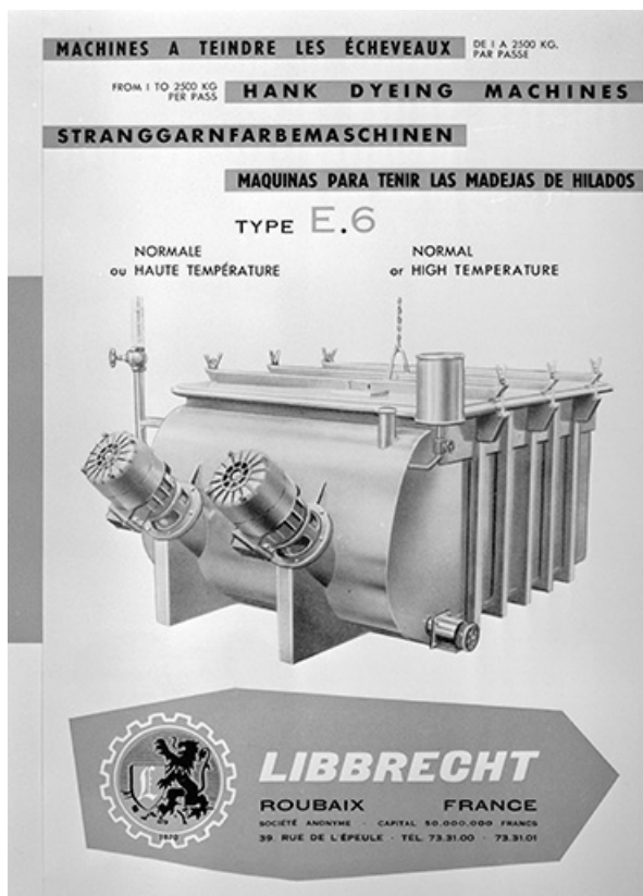
[Machine à teindre les écheveaux Libbrecht type E.6 vue de face]. 39, Balanod, lieudit : sous Roches