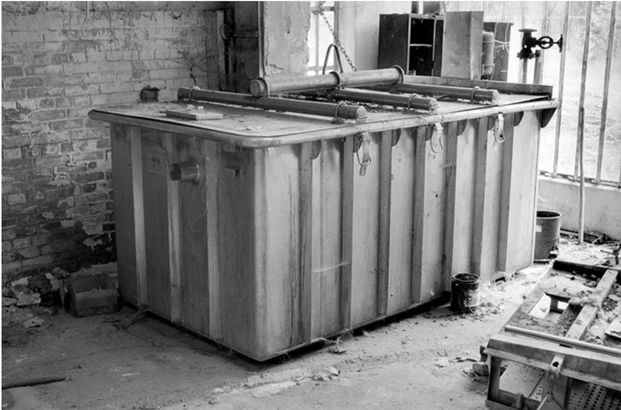
Vue d'ensemble en plongée.