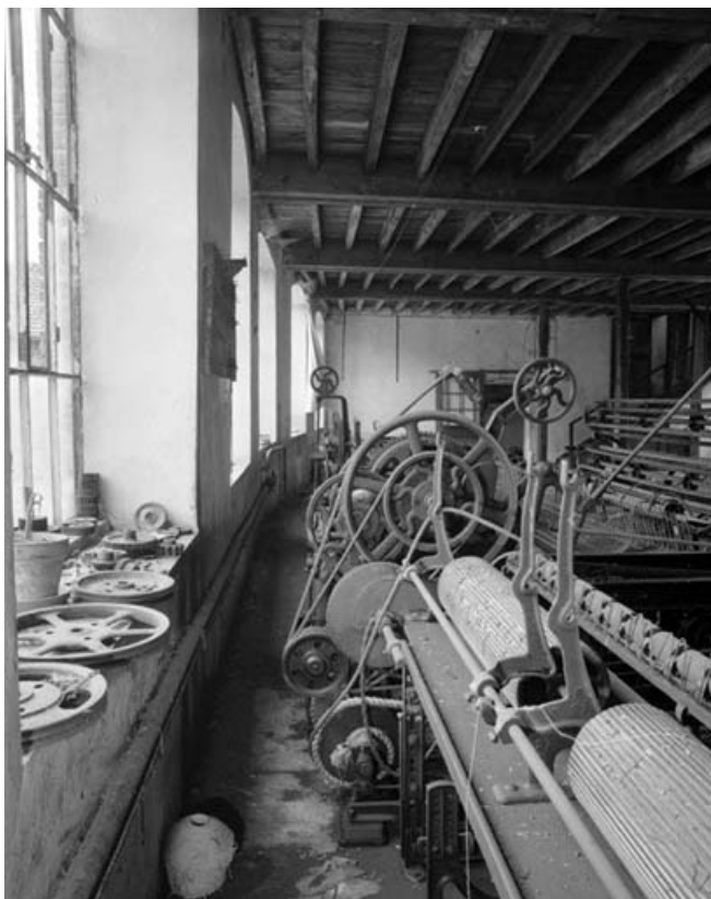
Système moteur : partie arrière vue de la droite.