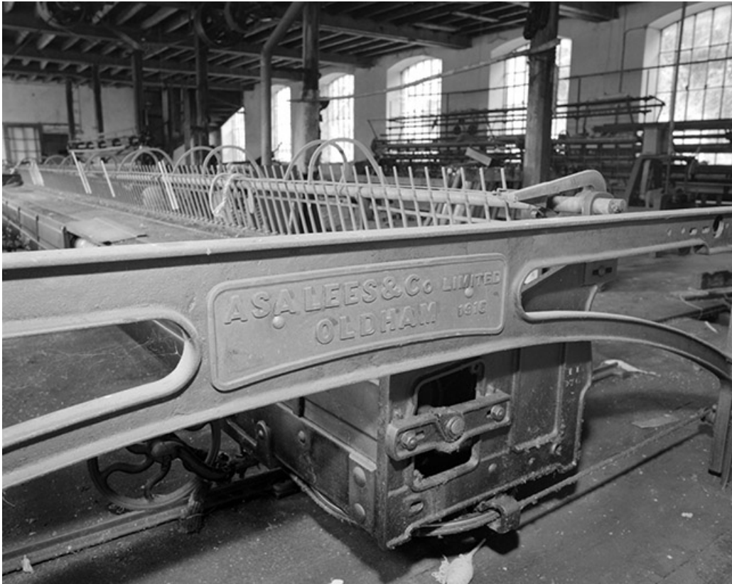
Extrémité du chariot du module de gauche : plaque de constructeur.