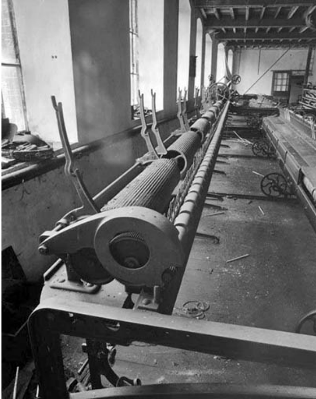
Ratelier du module de gauche. De gauche à droite, supports des cannelles, tambours cannelés et cylindres presseurs (surmontant les cylindres alimentaires non visibles).