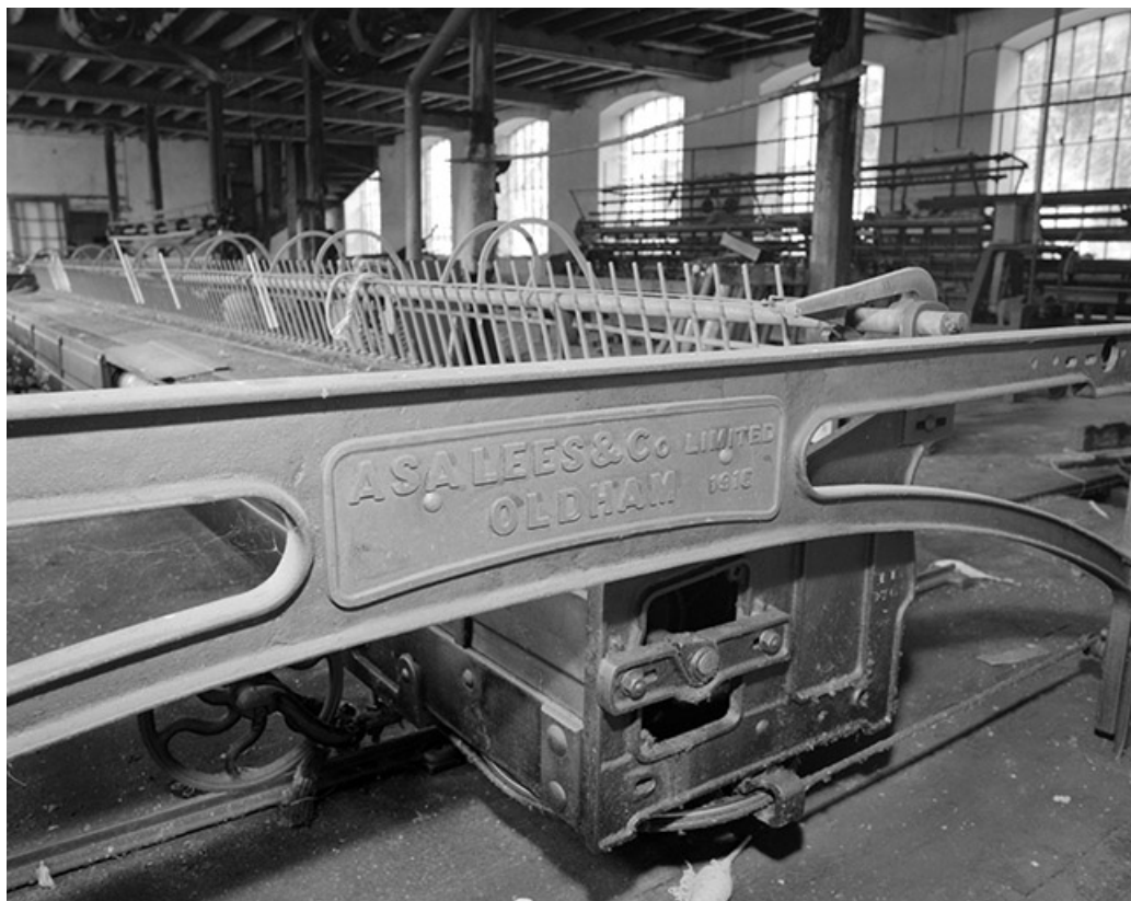
Extrémité du chariot du module de gauche : plaque de constructeur.