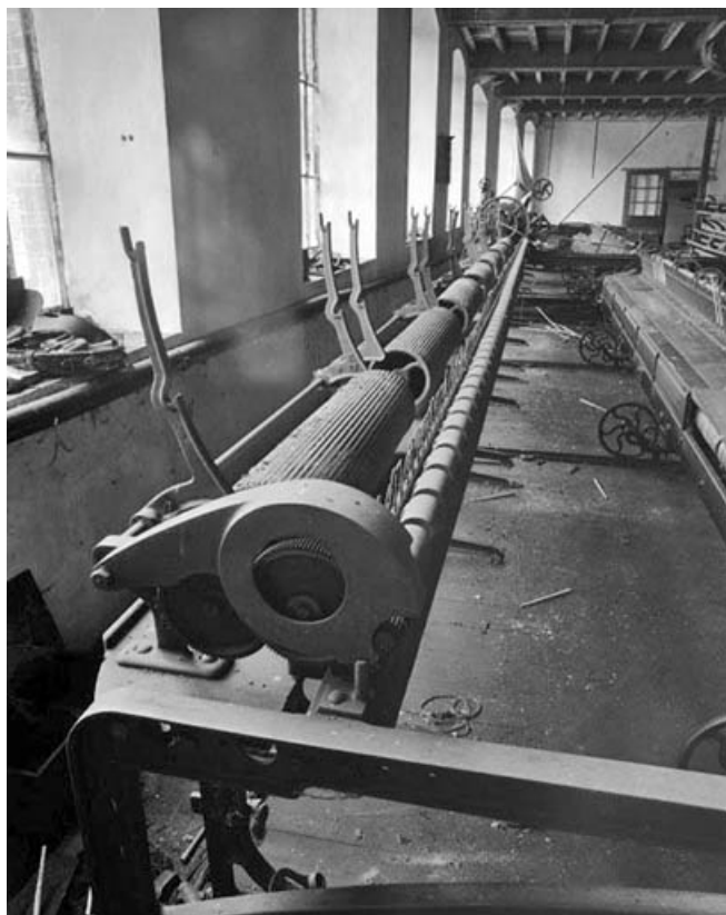
Ratelier du module de gauche. De gauche à droite, supports des cannelles, tambours cannelés et cylindres presseurs (surmontant les cylindres alimentaires non visibles).