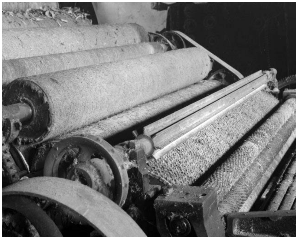
Détail du cylindre briseur. De droite à gauche, rouleaux alimentaires, cylindre briseur puis cylindres cardes de l'avant-train. 39, Balanod, lieudit : sous Roches