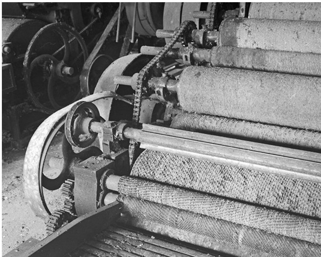
Détail du cylindre briseur. De gauche à droite, rouleaux alimentaires, cylindre briseur puis cylindres cardes de l'avant-train. 39, Balanod, lieudit : sous Roches