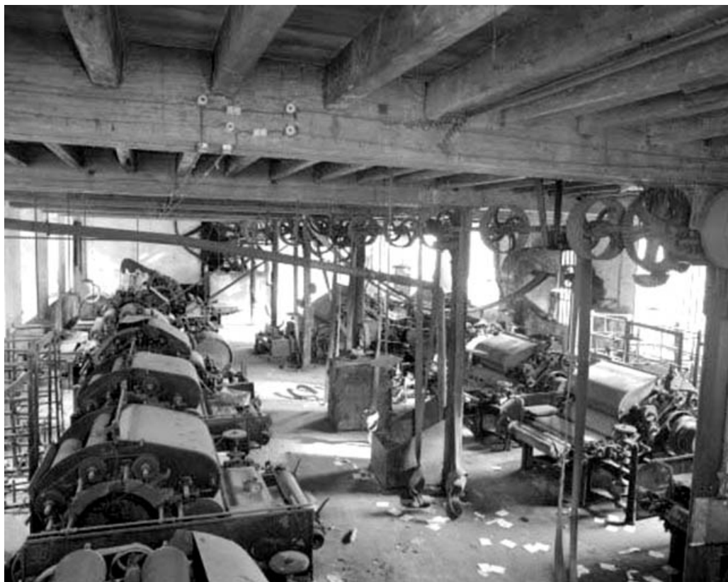
Vue d'ensemble des cardes.