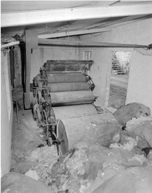
Vue d'ensemble depuis l'arrière.