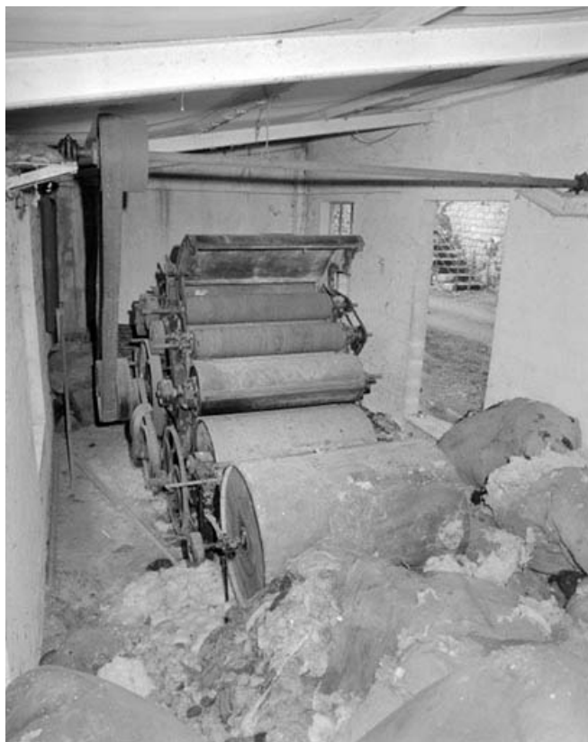
Vue d'ensemble depuis l'arrière.