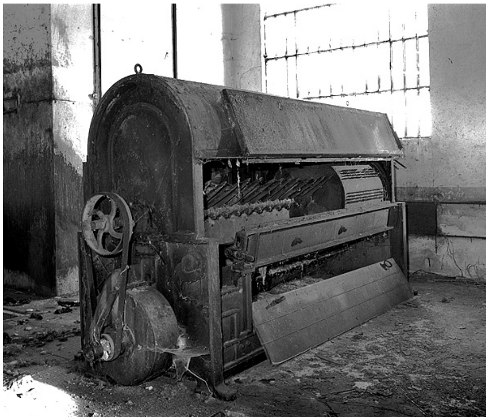
Face arrière vue de trois quarts gauche, capot ouvert.