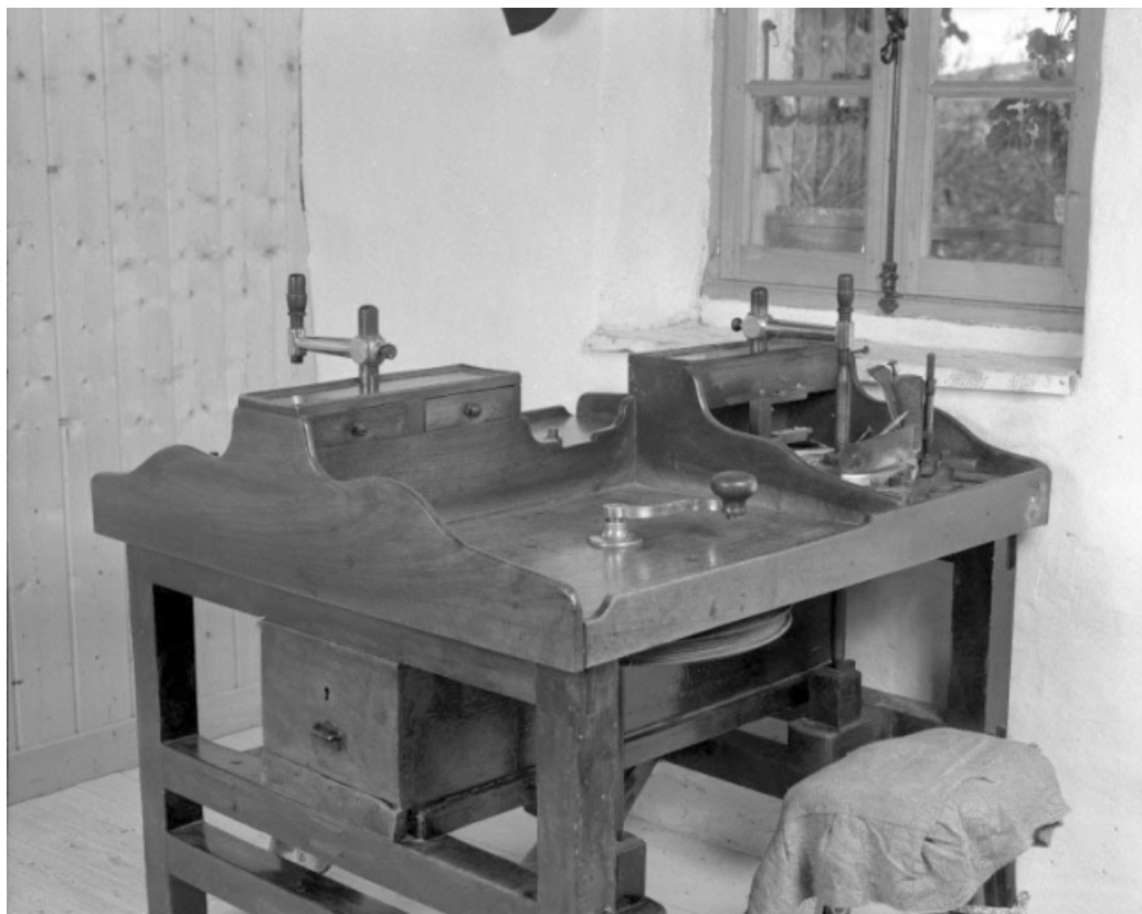
Le plateau et ses 2 postes de travail. Système moteur au premier plan.