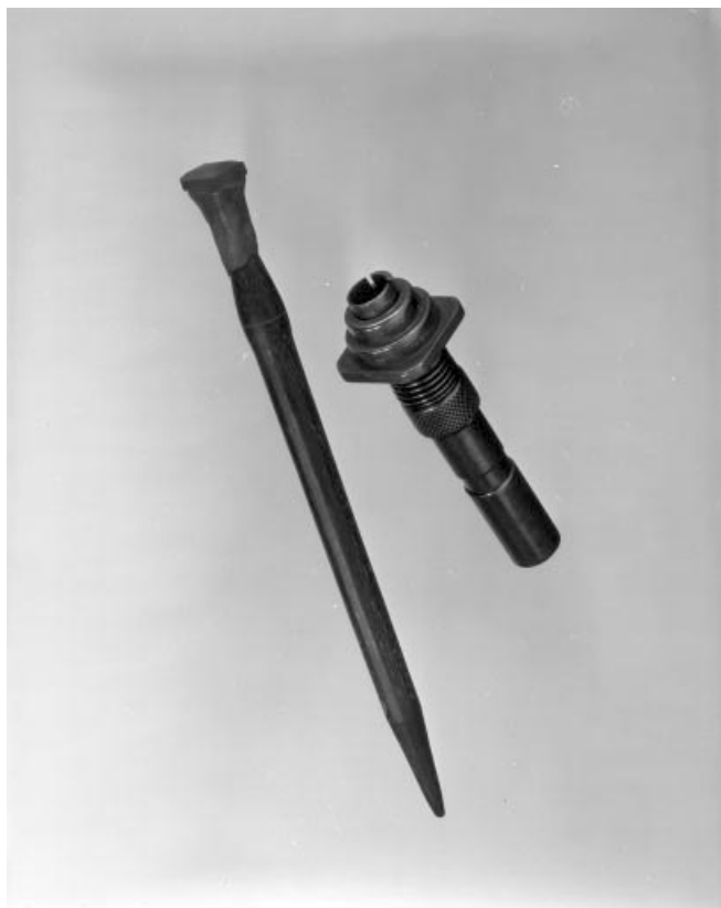
Bâton mécanique et étui diviseur.