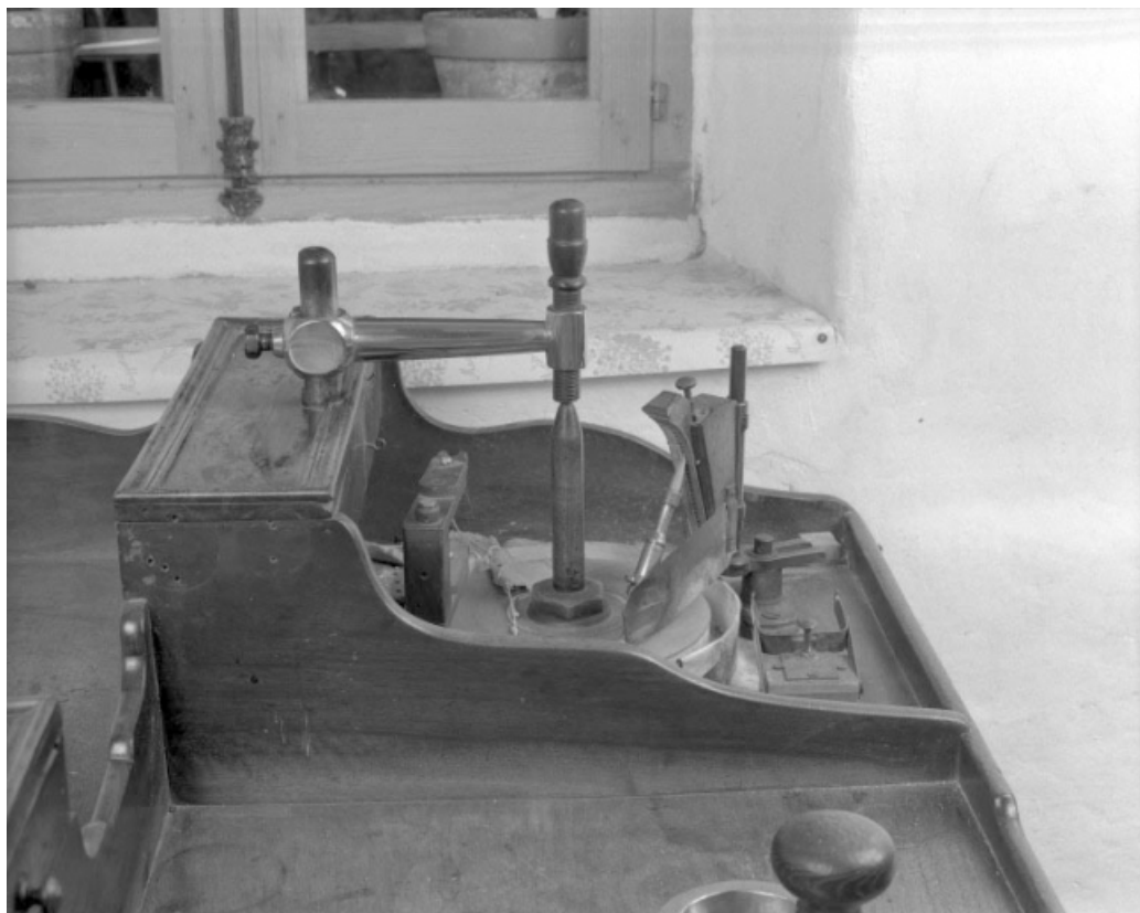
Poste de taille. Le bâton mécanique dans son étui diviseur s'appuie sur l'invention et repose sur la meule.