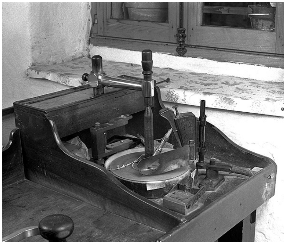
Poste de taille. Le bâton mécanique dans son étui diviseur s'appuie sur l'invention et repose sur la meule.