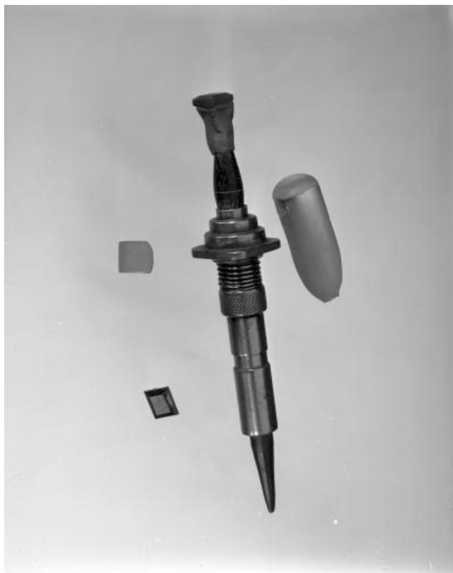
Bâton mécanique, étui diviseur et pierres synthétiques.