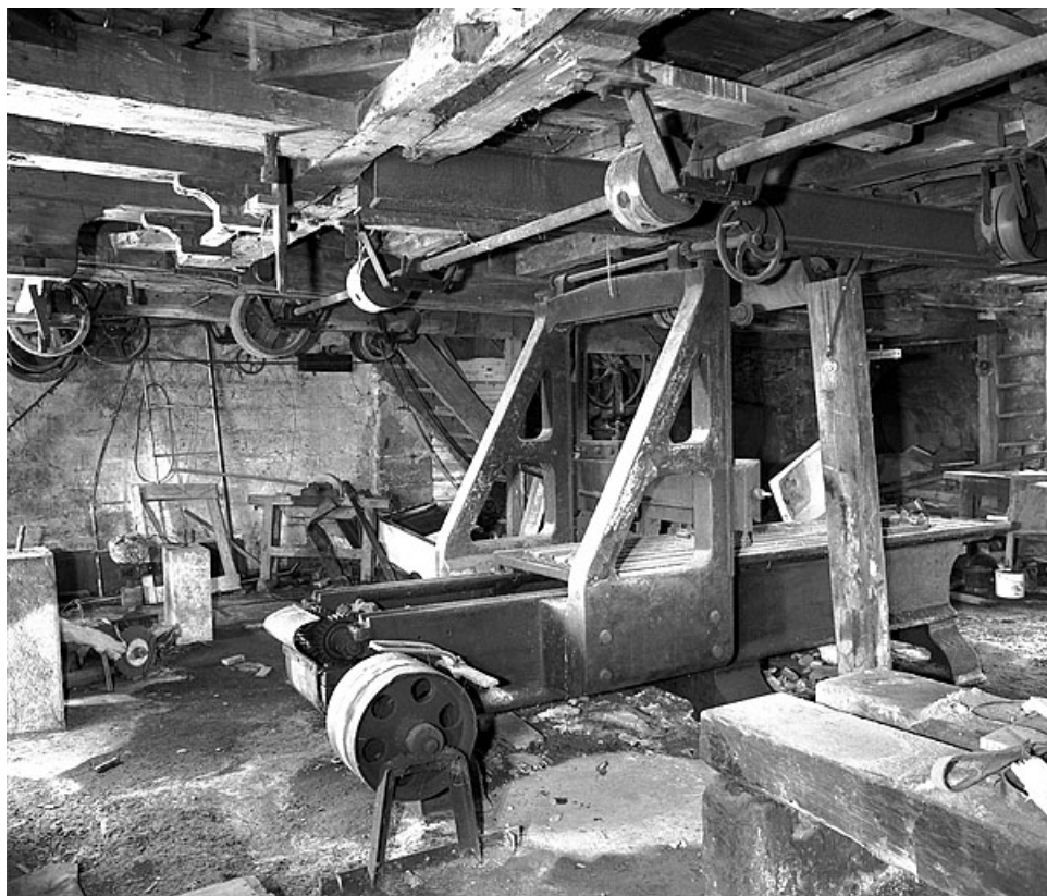
Partie arrière : poulies et engrenages d'entraînement de la table. En côté de l'entretoise, manivelle de réglage en hauteur de la traverse porte-outil.