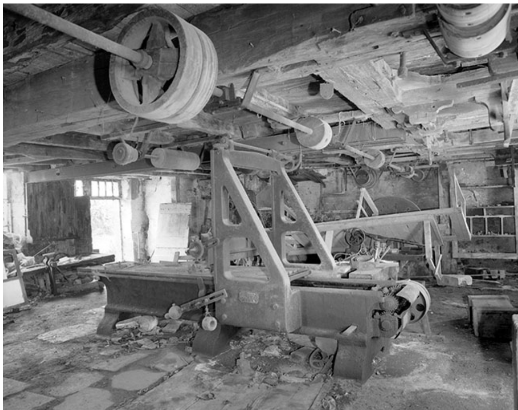
Vue d'ensemble depuis l'arrière.