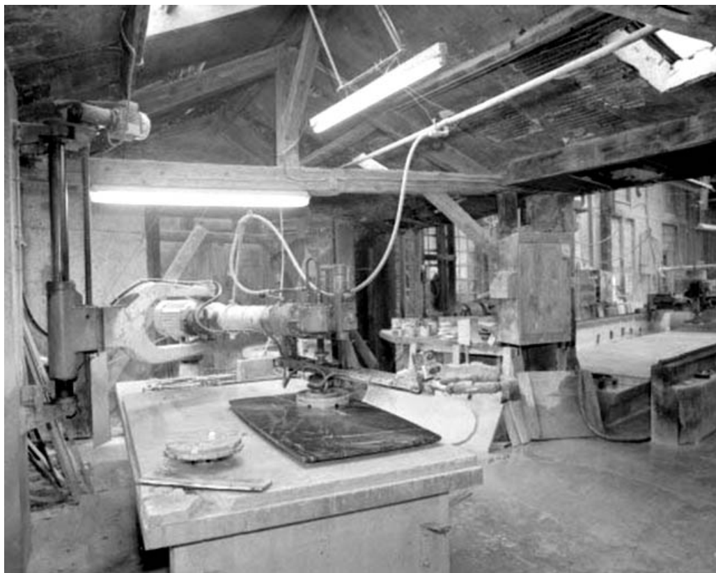
Polissoir prêt à fonctionner.

39, Saint-Amour, 2 à 6 rue de la Marbrerie