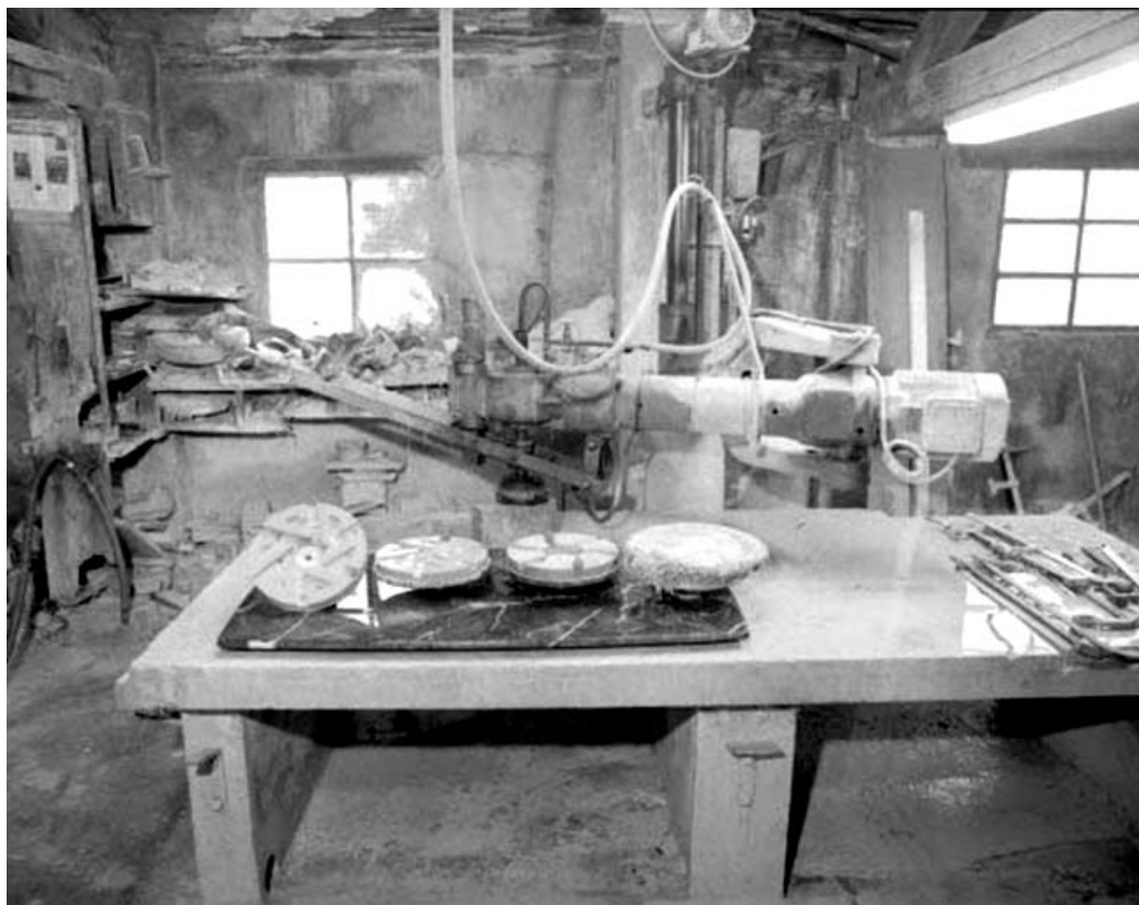
Polissoir à genouillère et ses plateaux. Plateaux à revêtement en carborandum, en acide oxalyque et en cordes. 39, Saint-Amour, 2 à 6 rue de la Marbrerie