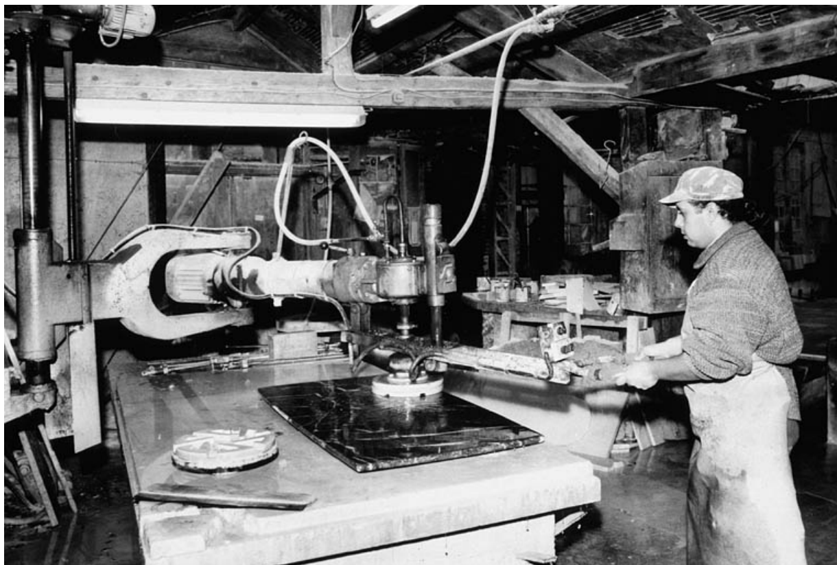
Polissoir en fonctionnement.

39, Saint-Amour, 2 à 6 rue de la Marbrerie