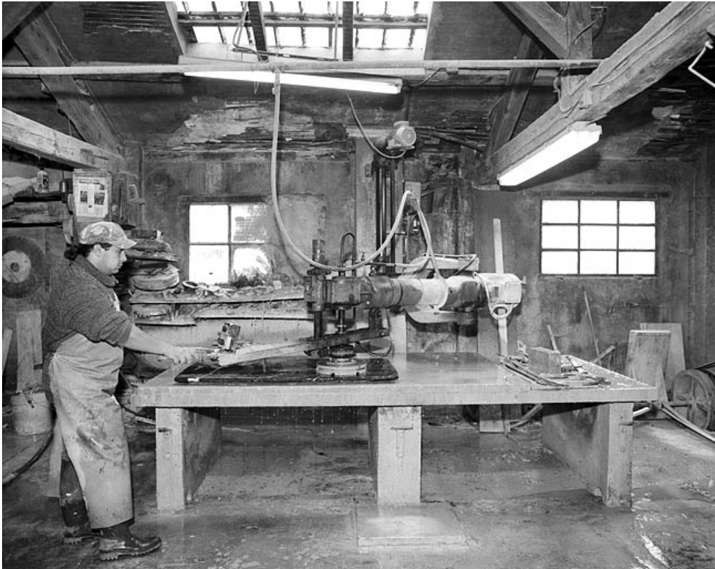
Polissoir en fonctionnement.

39, Saint-Amour, 2 à 6 rue de la Marbrerie