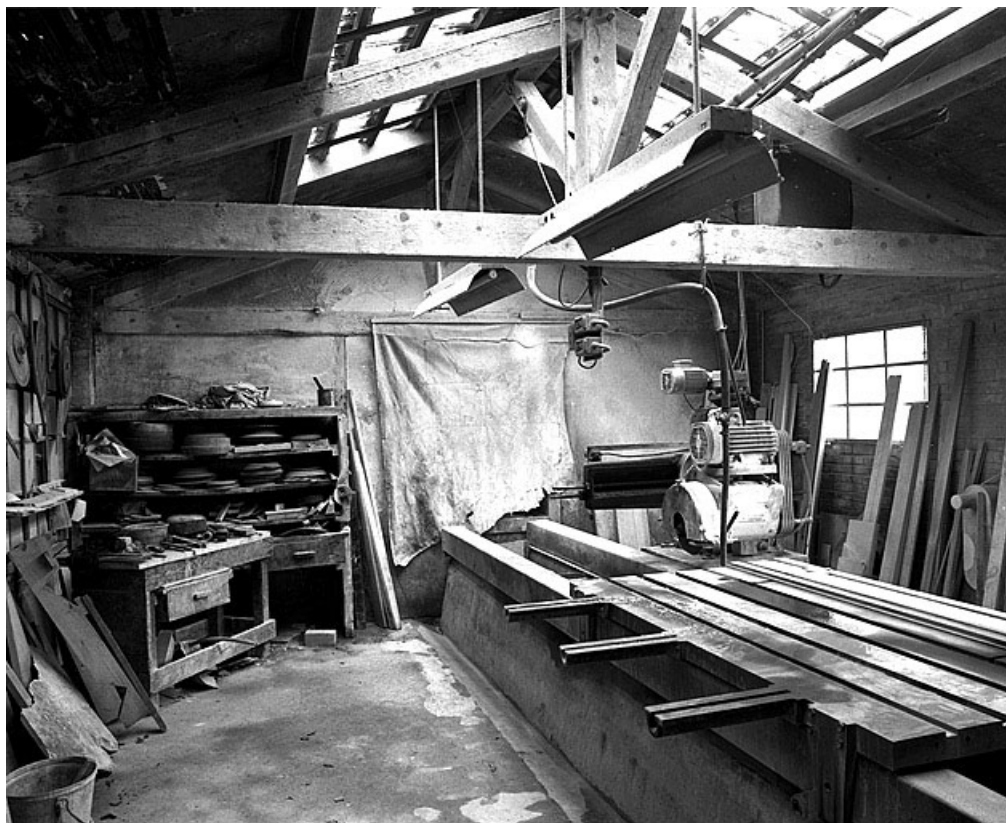
Débiteuse-moulineuse sud : vue d'ensemble.

39, Saint-Amour, 2 à 6 rue de la Marbrerie