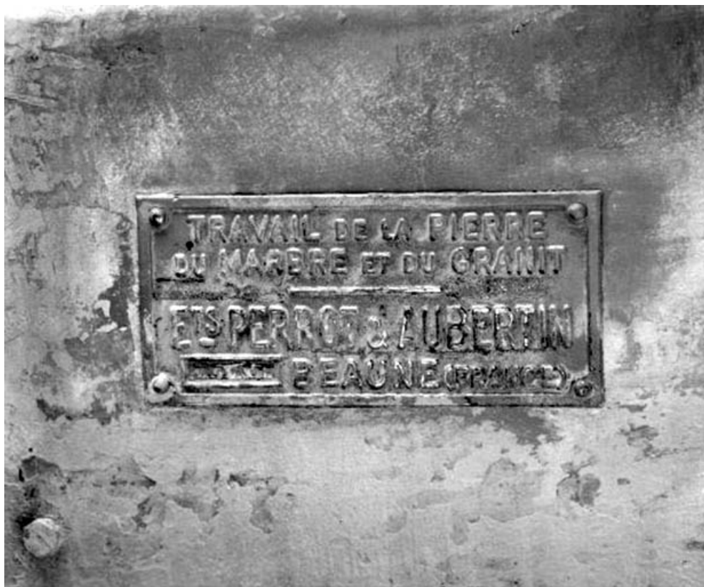
Débiteuse-moulureuse sud : plaque du constructeur.

39, Saint-Amour, 2 à 6 rue de la Marbrerie