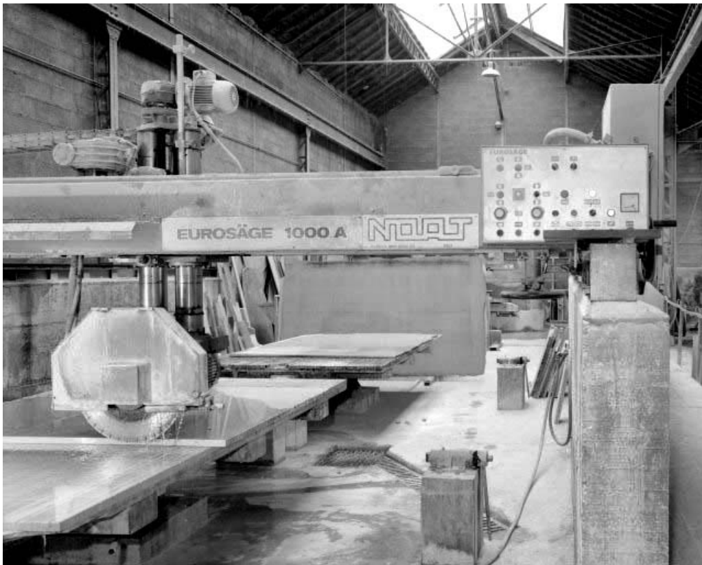
Lame circulaire et armoire de commande.

39, Saint-Amour, 2 à 6 rue de la Marbrerie