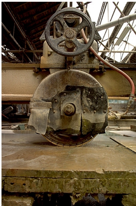
Débiteuse nord : détail de l'organe de sciage.

39, Saint-Amour, 2 à 6 rue de la Marbrerie