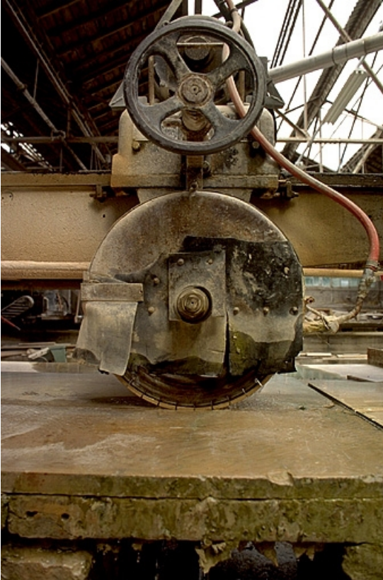
Débiteuse nord : détail de l'organe de sciage.

39, Saint-Amour, 2 à 6 rue de la Marbrerie