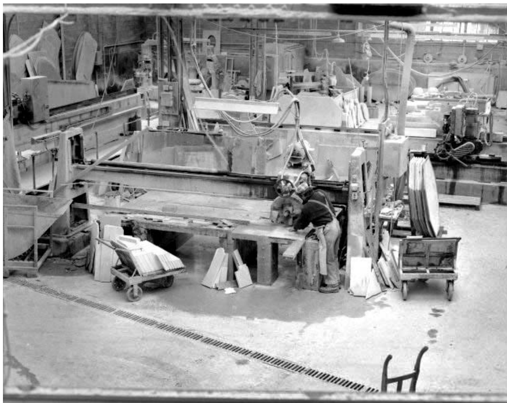
Débiteuse nord : vue d'ensemble plongeante.

39, Saint-Amour, 2 à 6 rue de la Marbrerie