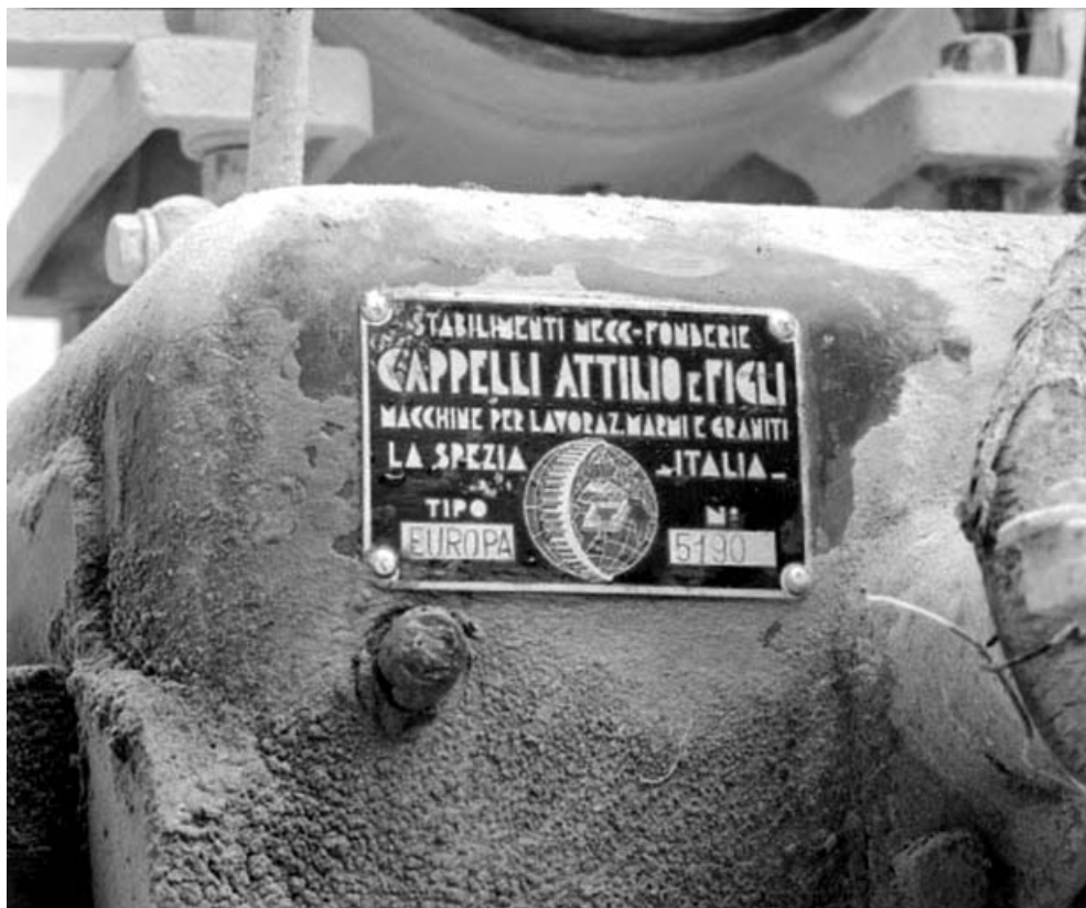
Débiteuse nord : plaque du constructeur.

39, Saint-Amour, 2 à 6 rue de la Marbrerie