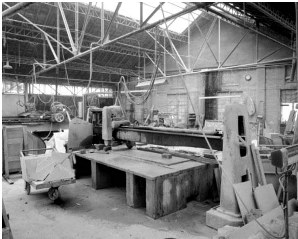
Débiteuse nord vue de l'arrière.

39, Saint-Amour, 2 à 6 rue de la Marbrerie